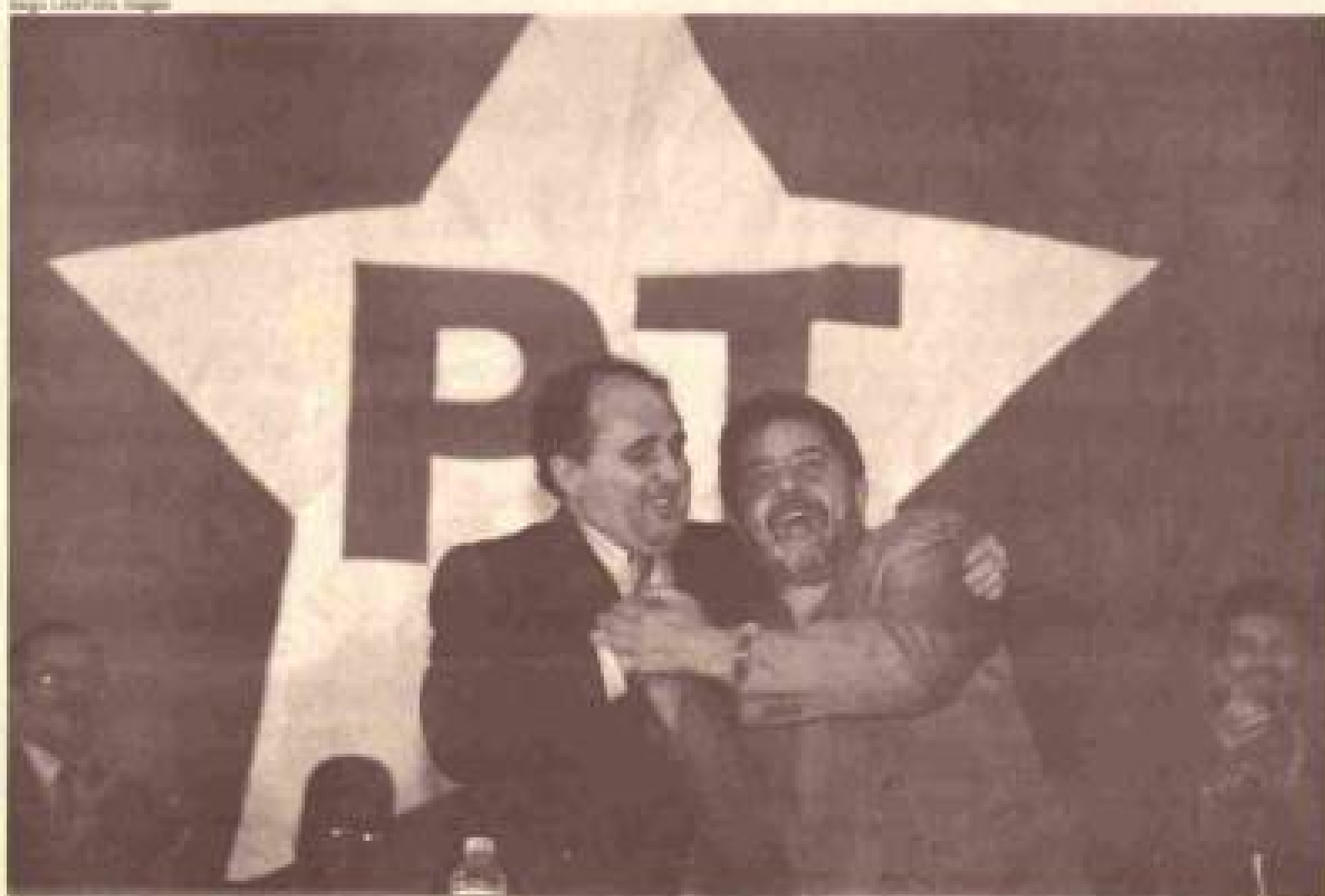
Cristovam Buarque e Lula comemoram o lançamento da candidatura no Centro de Convenções Ulysses Guimarães

Foram várias as manifestações de 97 que mostraram a resistência popular ao