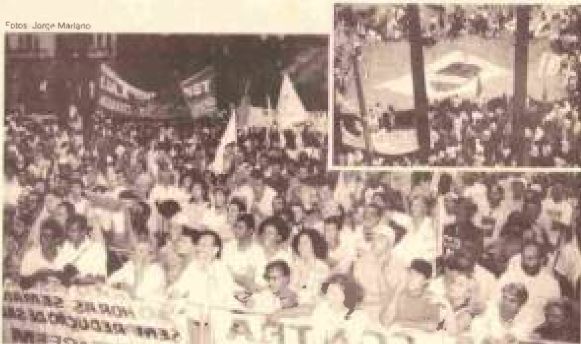
Marcha pelo Emprego, na praça da Sé, em 5 de dezembro (no detalhe, bandeira de 30 metros feita por manifestantes)