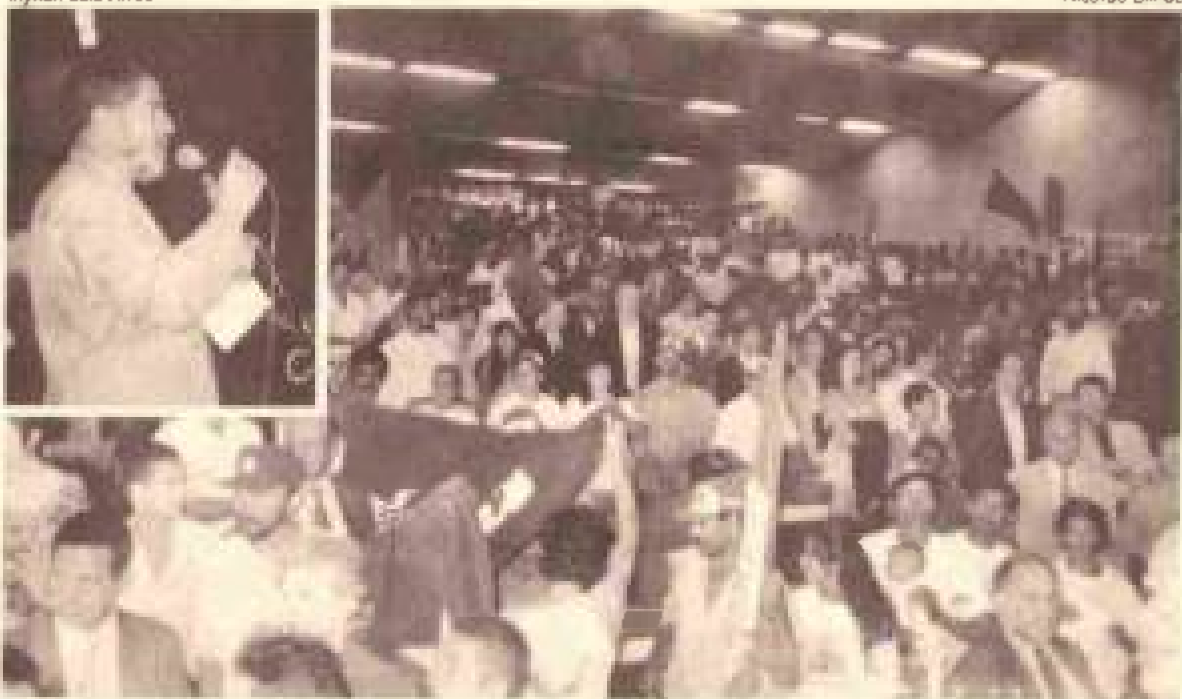
Mais de 1.500 pessoas lotaram o Centro de Convenções, em Brasília, no dia 11 de dezembro, no ato que lançou Lula candidato a presidente da República