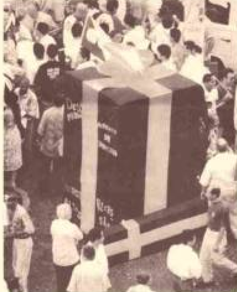
Pacote fiscal do governo mereceu crítica dos manifestantes presentes na praça da Sé

dos mais variados segmentos e partidos: sindicalistas, estudantes, professores, negros, gays e lésbicas, mulheres, religiosos, aposentados, sem-tetos, sem-terra, encorajados, ONGs, PT, PC do B, PDT, PSB, PCB, PSTU e até um dirigente da central sindical Cosatu, da África do Sul.