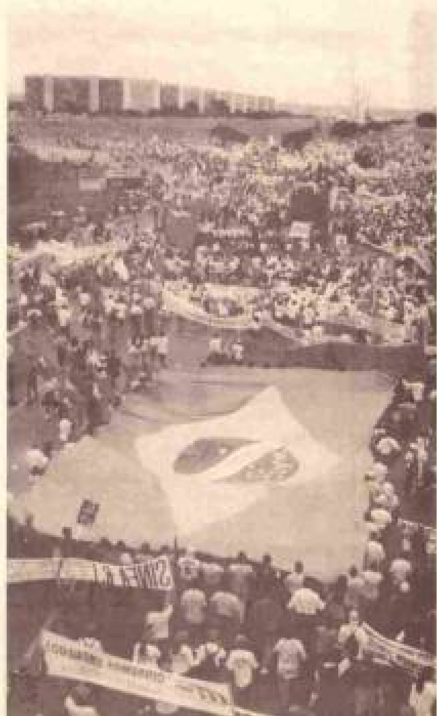
Marcha dos sem-terra chega a Brasília em 17 de abril. 100 mil pessoas ocupam as ruas da cidade, reivindicando a implantação da reforma agrária