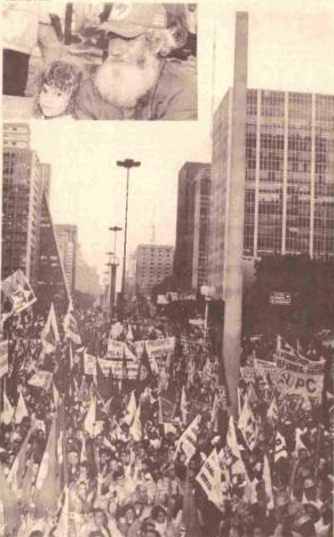
No dia 25 de julho, milhares de trabalhadores se juntam na Av. Paulista, após longas horas de caminhada, para protestar contra a política de FHC (no detalhe, família de sem-terra)