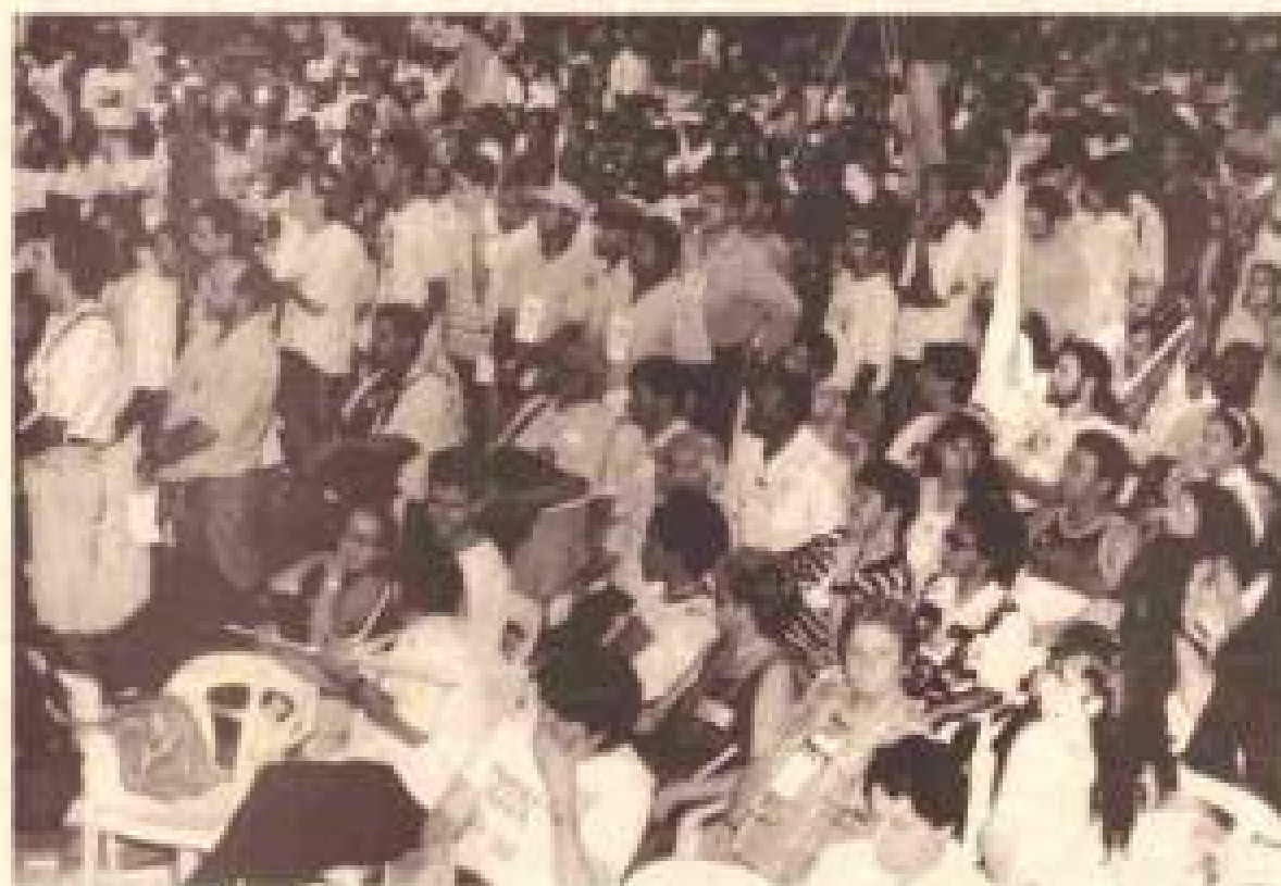
Encontro Popular reuniu representantes de 1.153 organizações dos 27 Estados da Federação: lançadas as sementes que germinarão em lutas do povo