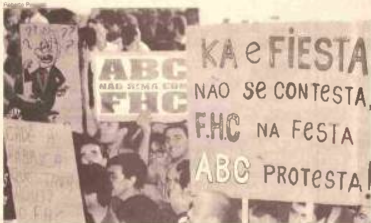
Fernando Henrique Cardoso visita a Ford, em 14 de março, e é recebido com vaias

Lula anuncia oficialmente sua candidatura, pelo PT, à Presidência da República, em ato que conta com a presença de representantes dos partidos do Bloco das Oposições, de várias entidades sociais e sindicais, além de parlamentares, prefeitos e o governador do PT do Distrito Federal.