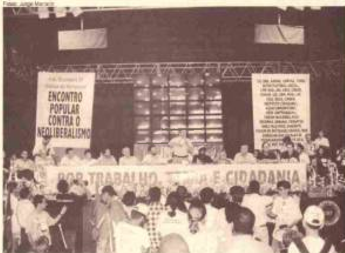
Lula discursa no ginásio do Ibirapuera, onde 4.200 lideranças de partidos e movimentos populares aprovaram plataforma e agenda comuns de luta contra o neoliberalismo para 98

Para preparar o cumprimento da plataforma e agenda comum de lutas, foi formado um Fórum Nacional por Trabalho, Terra e Cidadania, composto por representantes das entidades e partidos organizadores do Encontro. O Fórum fará sua próxima reunião no dia 20 de janeiro, na sede nacional da CUT, em São Paulo.