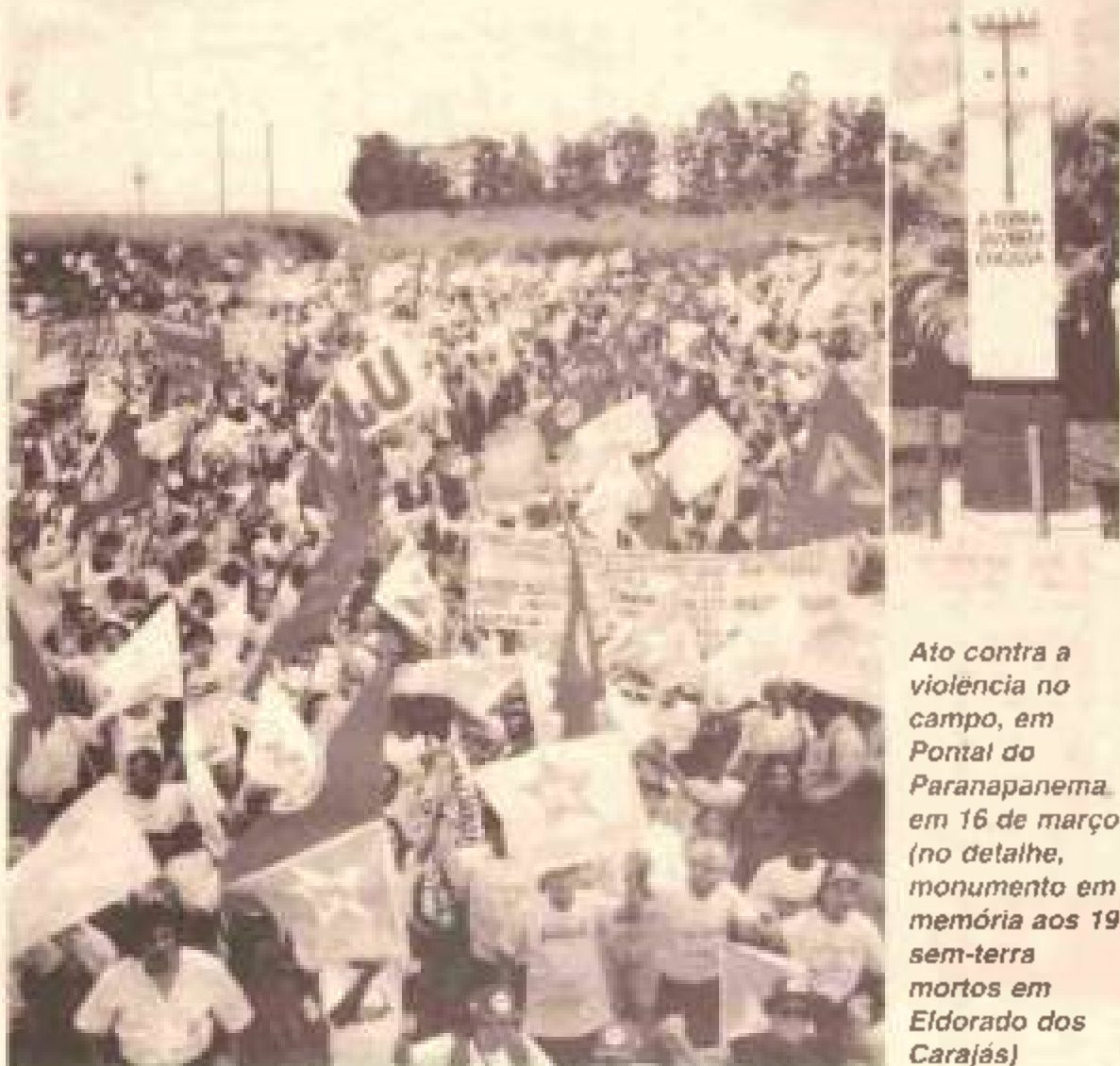
Ato contra a violência no campo, em Pontal do Paranapanema, em 16 de março (no detalhe, monumento em memória aos 19 sem-terra mortos em Eldorado dos Carajás)