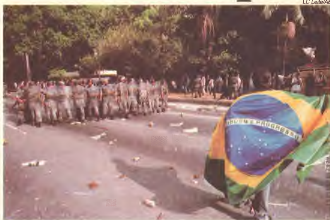
Dia 18 de maio, av Paulista, São Paulo. A tropa de choque da polícia militar ataca professores, servidores da saúde, estudantes, metroviários e todos que tinham cara de trabalhador. Sem escrúpulos, usam balas de borracha, bombas de gás, cães, cavalos, espadas, cacetes, jatos de pimenta e muita truculência para tentar conter a insatisfação gerada pelo aumento da miséria.

Delegações de sem terra do Rio Grande do Sul, Santa Catarina, São Paulo e Rio de Janeiro estarão presentes ao protesto em Curitiba, que será coberto também pela imprensa internacional.