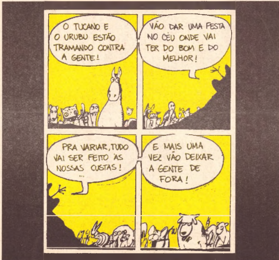
Um dos episódios criados por Mangoni para o Gibi "O Sapo Barbudo" (ver p. 13)

A terceira fase — a adoção da nova moeda — é na verdade uma dolarização disfarçada, com a paridade do real com o dólar. As duas fases anteriores — afirmavam os responsáveis pelo plano — tinham como objetivo preparar o caminho para a reforma monetária. A primei-