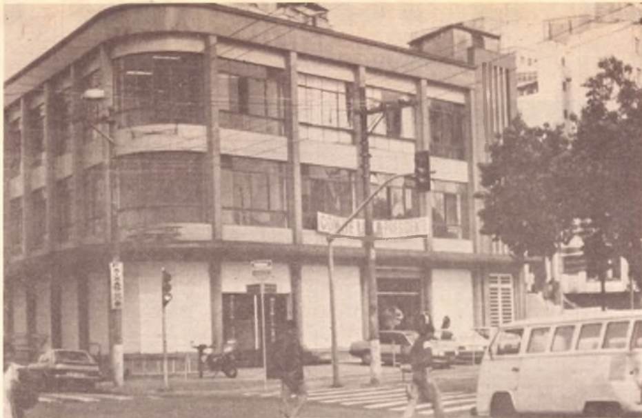
Sede do Comitê Nacional Lula - Presidente

O material fotográfico e os desenhos serão produzidos pelo Comitê de Cultura, aproveitando trabalhos realizados nas caravanas e fotos e cartuns de publicações da imprensa de todo o país. Haverá rodízio do material exposto a cada quinze dias.