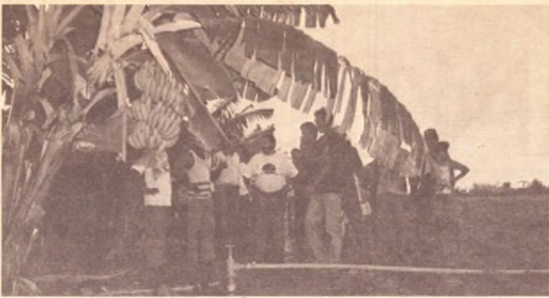
Caravana visita Projeto Jaíba