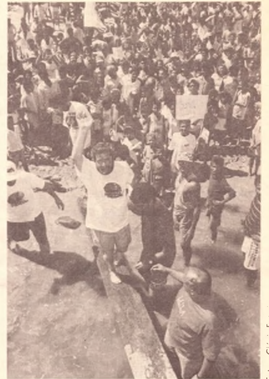
Lula em Morpará (BA)

No entanto, passou despercebido pela mídia que em Arcos mais de 6 mil pessoas esperavam Lula na praça até 23 horas, numa noite fria de segunda-feira. Que prefeitos de outros partidos apoiaram ou receberam com ousadia Lula em São