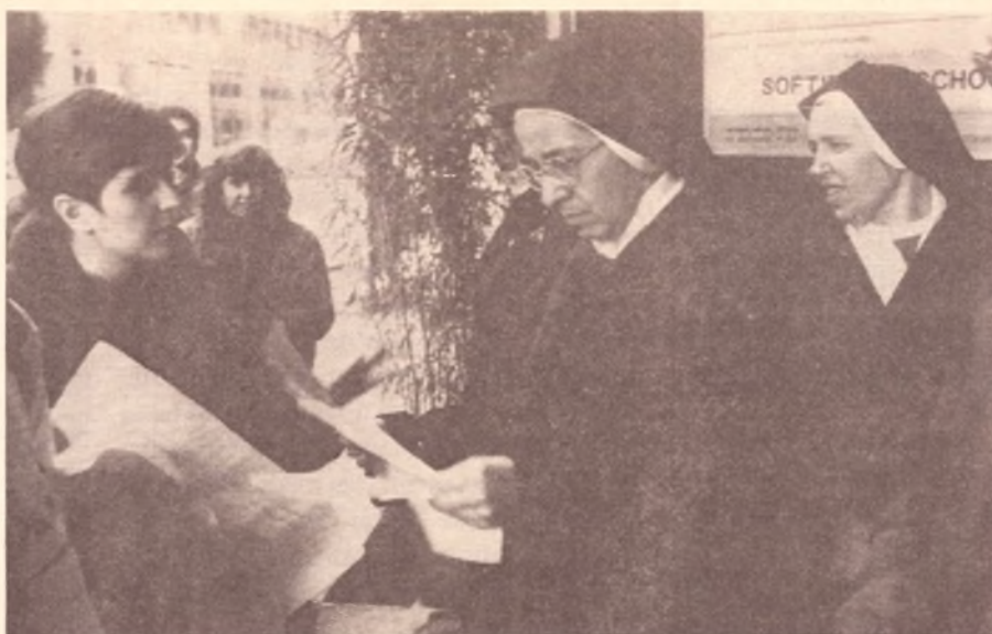
Militantes do PT fazem boca de urna em Milão (Itália) durante o segundo turno das eleições de 1989

O gibi, com uma tiragem de 20 mil exemplares, apresenta "A verdadeira história da festa no céu", "Fernando HenRIQUINHO, o pobre candidato rico" (desenhos acima), "Conselhos políticos de Maquiavel", notas de rodapé de Carlito Maia e mais surpresas. A distribuição ficará por enquanto no eixo Rio-São Paulo, mas encomendas podem ser feitas pelo telefone (011) 223-7999