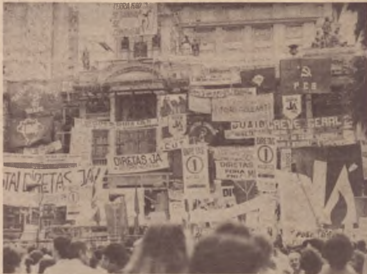
Comício em Porto Alegre: a disputa dos espaços.

Apesar de ter uma participação expressiva na arregimentação