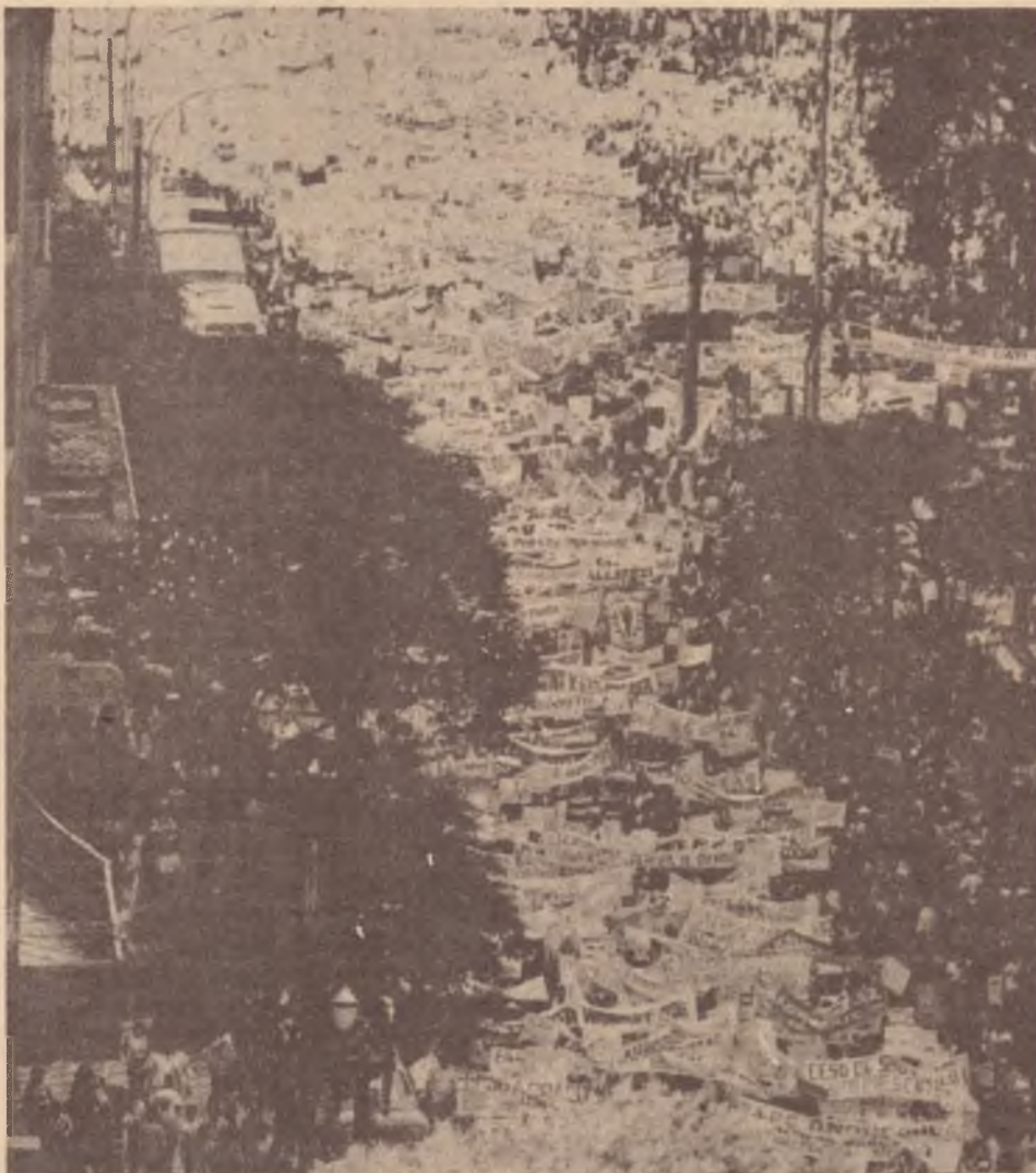
A grande passeata do dia 5 de abril

E, mais ainda, não se tratava simplesmente de três setores do magistério público — professores, diretores e supervisores — que se aliavam num movimento reivindicatório. Eram três setores profissionalmente hierarquizados dentro da estrutura funcional da Secretaria de Educação. Essa hierarquia, se foi enormemente abalada através da prática