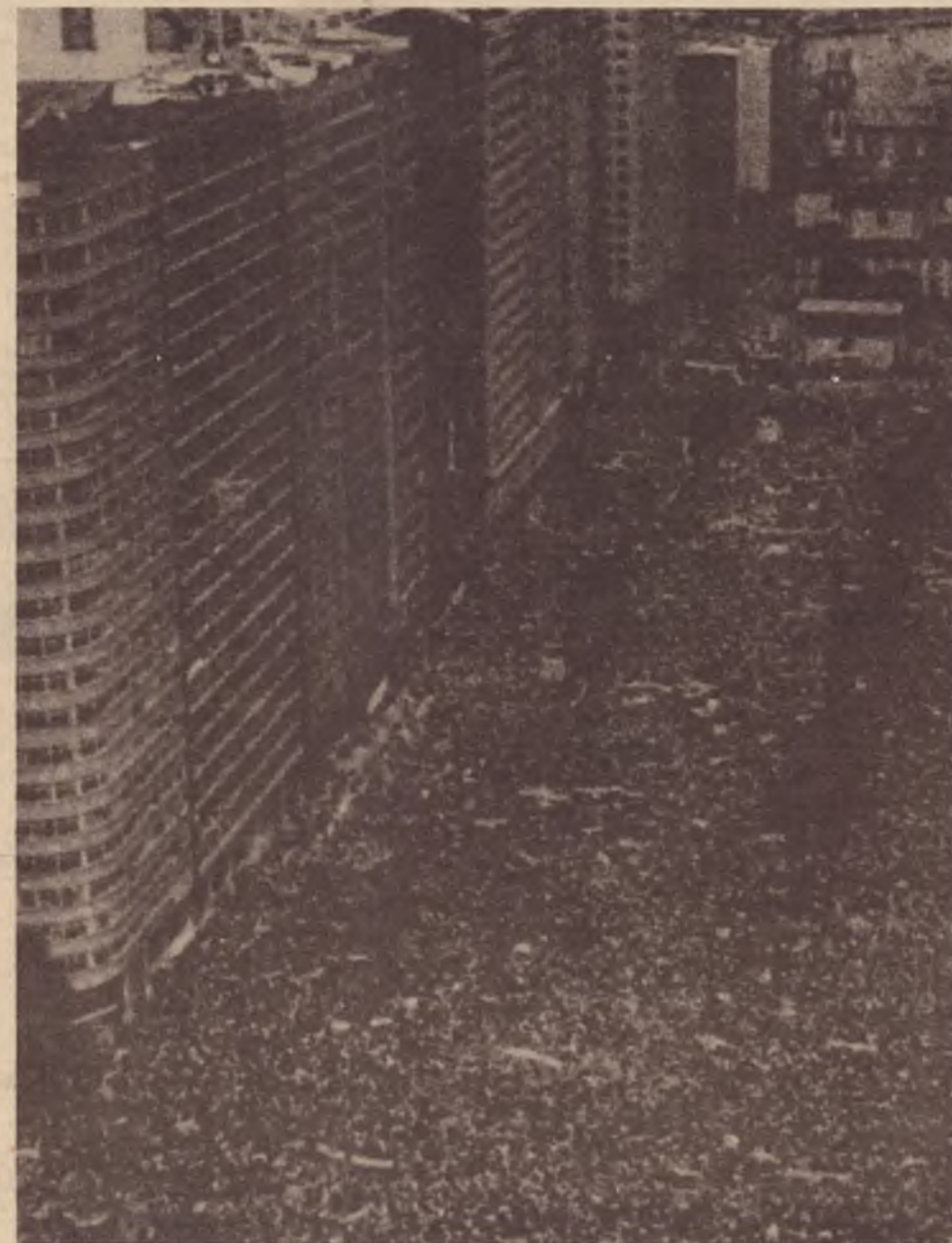
O grande comício do dia 10 de abril no Rio: as massas na rua

— Lula: O negócio é o seguinte: o Supra-Partidário definiu como paralisação nacional das atividades; o Jair e o Joaquim entenderam, corretamente, que isso quer dizer greve geral; outros chamavam de parada cívica. Não importa. O fato é que logo em seguida vários setores da oposição e da imprensa caíram de pau. E aí alguns companheiros acharam que era preciso avaliar e aprofundar melhor a questão da greve. Eu acho que a CUT agiu corretamente, pois do contrário teria ficado sozinha, isolada na proposta, na medida em que o Supra-Partidário deixou de assumir a questão. Mas veja bem: um dos argumentos do Comitê é