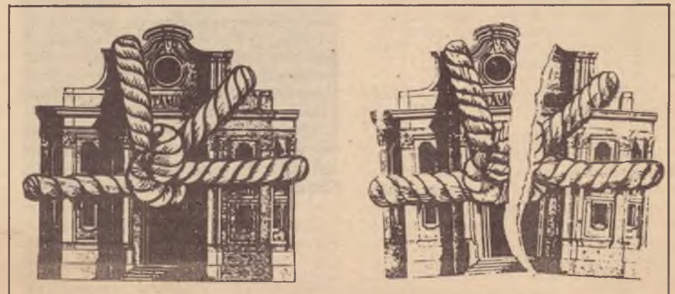
O poder não apenas se constrói e se toma... mas se destrói

Finalmente, o programa de governo proposto, embora se refira à plataforma "Trabalho, Terra e Liberdade", é muito mais moderado. Por exemplo, a única nacionalização proposta é a dos bancos estrangeiros, que têm pouca importância no Brasil.