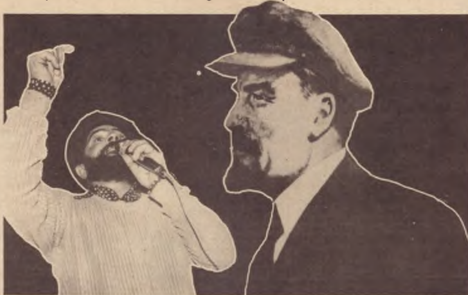
Lula, reconduzido por unanimidade à presidência do PT: deve haver lugar para a esquerda que ajuda a construir o partido.

Realizada a votação, a proposta "Por um PT de massa" obteve 158 votos; "O