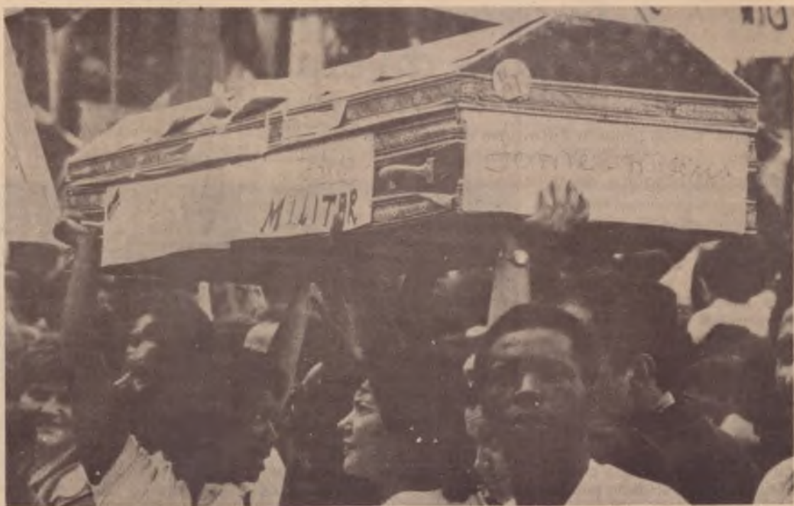
Nas ruas, o desejo forte de enterrar a ditadura

A potência do movimento de massas colocou em andamento um processo forte de desestabilização do regime que coloca como uma possibilidade real o fim da ditadura militar que há vinte anos domina o país.