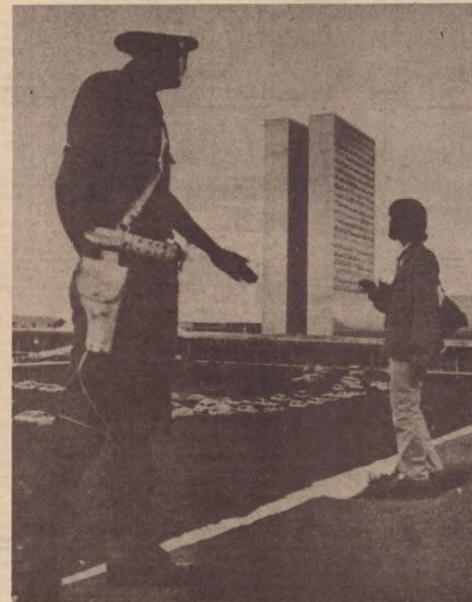
Dia 25 de abril: o cerco ao Congresso

— Lula: Eu não sei, pode ser; depende do Comitê avaliar; não sei se já não está muito em cima. O que eu acho é que temos tempo pela frente e que há várias datas, dependendo apenas do Comitê, ou melhor dos vários comitês estaduais e do nacional, avaliarem qual é a melhor oportunidade. O que eu insisto é que a decisão quanto aos encaminhamentos devem ficar é a cargo dos comitês. Eles