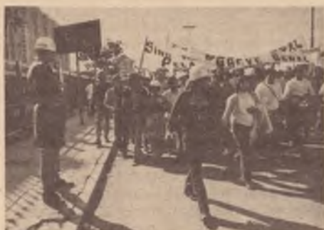
Em defesa da greve geral

Entre os pontos altos a defesa de greve geral e a proposta de boicote ao Colégio Eleitoral. Entre os negativos, uma colocação confusa sobre a estratégia da luta pelo poder e uma plataforma rebaixada em relação aquelas já aprovadas pelo partido.