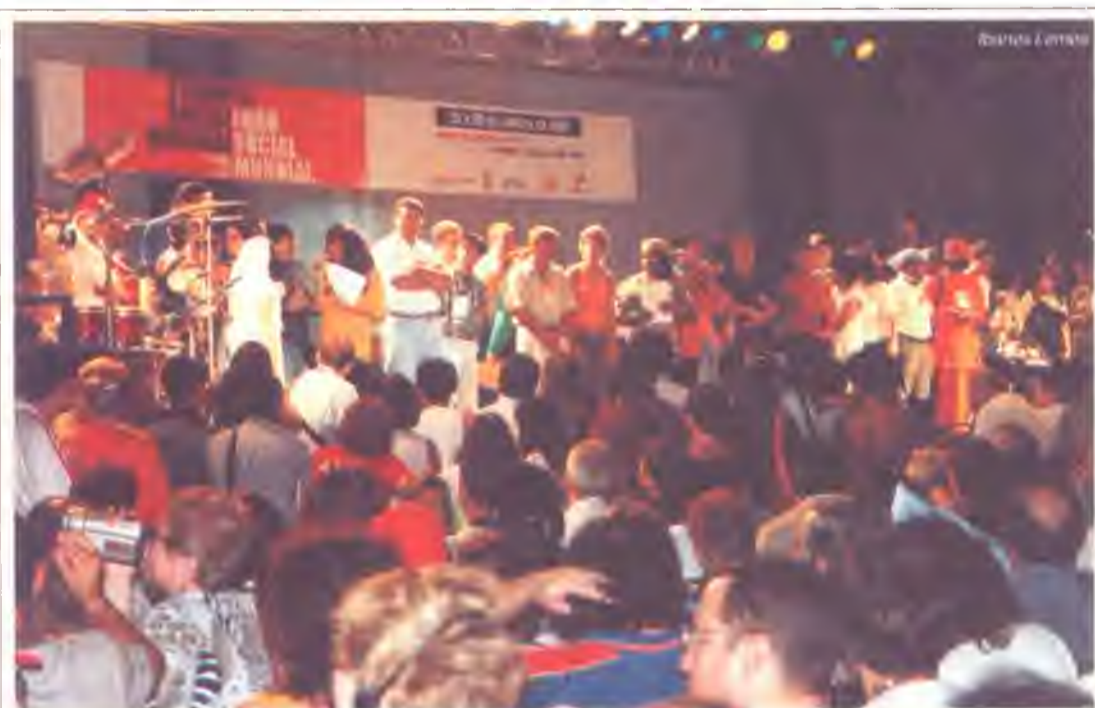
Encerramento do FSM, em janeiro de 2001, na capital gaúcha

capitais e investimentos do país vizinho para o Brasil é descartada pelo deputado. “Quem quiser sair da Argentina também não virá para o Brasil porque o país não tem infra-estrutura”, disse o líder da bancada petista. Outra consequência da crise cambial que se avoluma no Brasil apontada por Pinheiro é o impacto da alta do dólar em setores como de medicamentos e equipamentos, dependentes de importações. “Tudo isso deixa o mercado em polvorosa e espero que FHC aprenda a lição de De La Rúa (presidente da Argentina), que só piorou a situação ao cortar salários”, declarou o deputado.