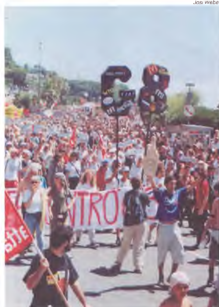
Manifestantes antiglobalização, em Gênova, registrados por Josi Weber, funcionária do DN que participou dos protestos

“Com ou sem o Berlusconi as manifestações teriam acontecido”, enfatizou Maitan questionando a tese difundida na Itália, de que as manifestações teriam sido