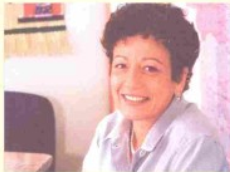
A ministra Nilcéa Freire, da Secretaria de Mulheres

O enfrentamento à violência contra a mulher exige ações em diferentes áreas, de forma sistemática e continuada, constituindo uma efetiva rede de articulação de serviços que reúna esforços de diferentes níveis de governo, da sociedade civil organizada e da comunidade em geral. Isso significa construir uma parceria para prevenir, atender e erradicar os mais diversos tipos e formas de violência de gênero. Essa parceria funciona na forma