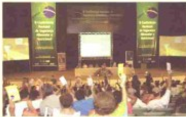
Conferência Nacional de Segurança Alimentar

na conferência, foram aprovadas 48 propostas que serão entregues ao presidente Luiz Inácio Lula da Silva para orientar as ações no