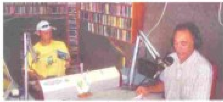
Rádio comunitária de Icapuí, cidade administrada pelo PT