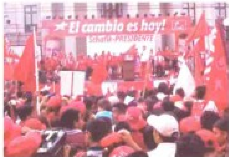
Campanha da FMLN, derrotada na eleição deste ano