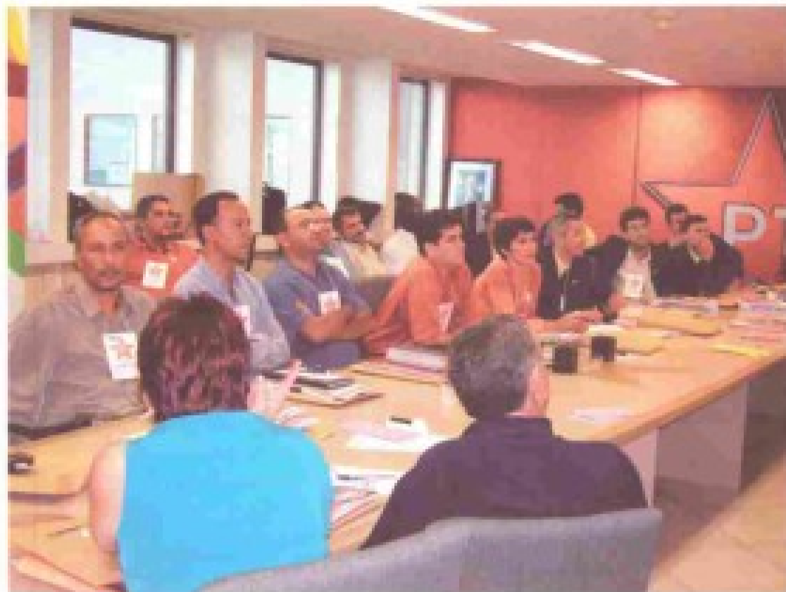
O Fórum Nacional de Vereadores do PT se reuniu em Brasília para discutir as eleições

O fórum decidiu que cada um dos GTs estaduais deve indicar um coordenador nas eleições 2004, com o intuito de preparar uma rede de informações. Segundo Gleber, o encontro reiterou a confiança no governo Lula, mas ressaltou a importância do trabalho da militância.