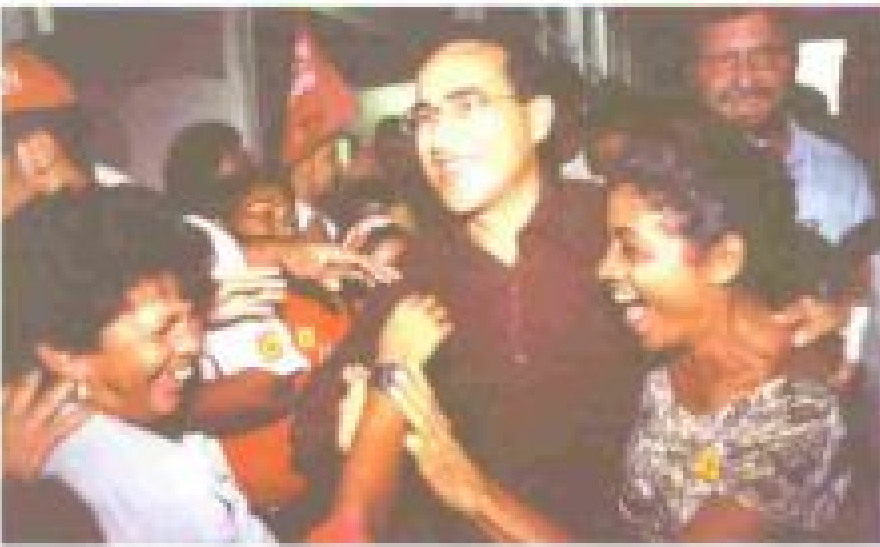
A administração do PT em Belém foi aprovada nas urnas com a reeleição