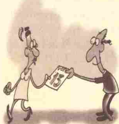
Boca de urna

Enfeitá-lo também é permitido. É dia de transformá-lo em "árvore de Natal", com adesivos, faixas, bandeiras etc. Carreatas e uso de alto-falantes, entretanto, são proibidos.