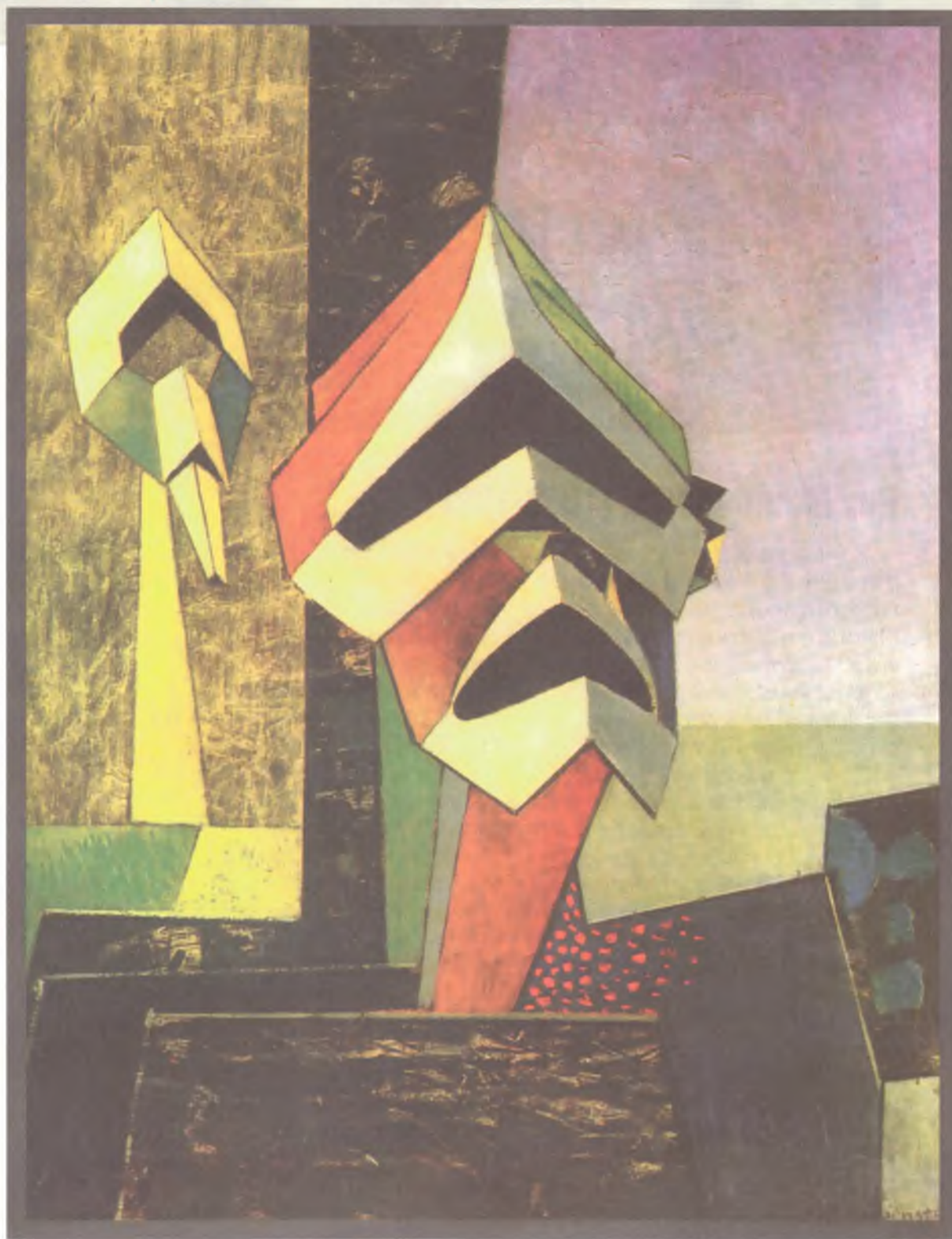
MAX ERNST - O NASCIMENTO DA COMÉDIA, 1942

O capítulo "estalinismo" está se fechando. Já era tempo. Isso cria a possibilidade - não para as próximas semanas, mas para o século XXI - de agrupar novamente gerações de revolucionários ao redor da bandeira vermelha de Outubro de 1917 - não como modelo único, mas como herança preciosa e insubstituível da tradição dos oprimidos. Isso não é uma certeza, mas uma possibilidade histórica, uma chance que nos é dada. A nós cabe apanhá-la.