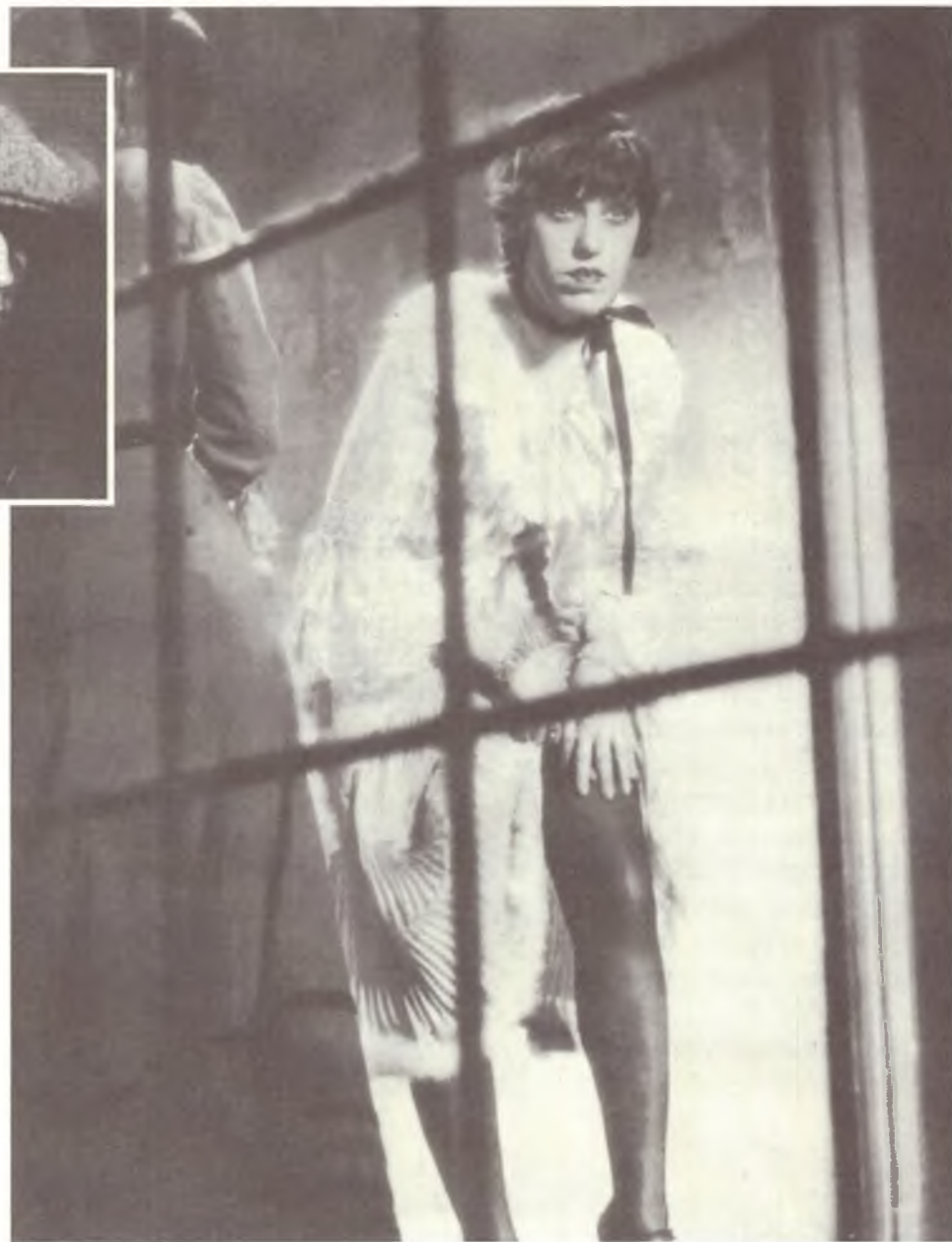
FOTOGRAFIA DO ATOR DO BERLINER ENSEMBLE

9 e 10 de outubro de 1997 não ficarão na história do teatro brasileiro, diferente do que aconteceu na França em 1954, quando o Berliner Ensemble , apresentou-se aí pela primeira vez. A passagem por Paris da companhia teatral fundada por Bertolt Brecht foi rica em conseqüências, pela adoção ou pela recusa de novos princípios e práticas éticas e estéticas que ele trazia. Entender o impacto mitigado do desembarque pela primeira vez no Brasil do Berliner Ensemble , fundado em 1949 e emblema do teatro de inspiração política, significa mergulhar no imenso - e infundável - debate entre a arte teatral e a dimensão política.