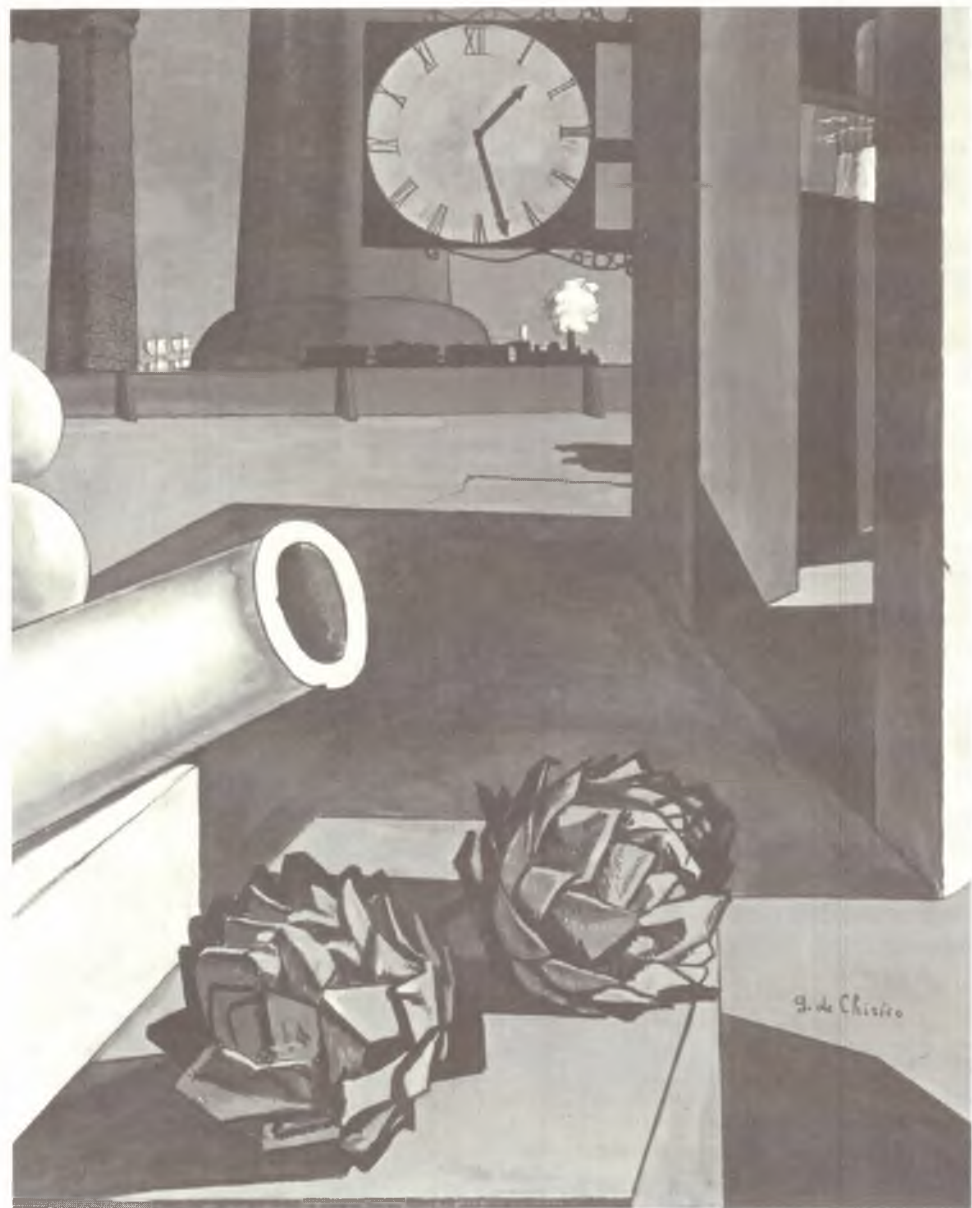
GIORGIO DE CHIRICO

Privatizações - Vender empresas rentáveis (e obviamente o mercado só compra pressas) traz, no curto prazo, um aporte