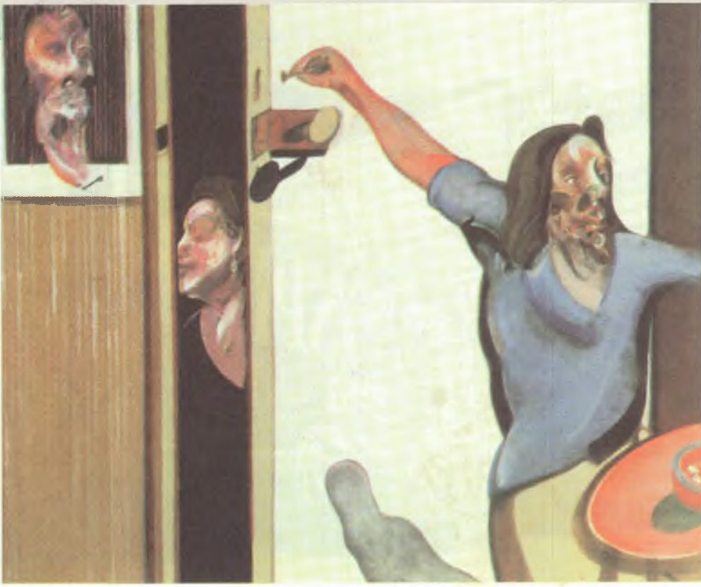
FRANCIS BACON - THE ARTIST AT WORK - 1969