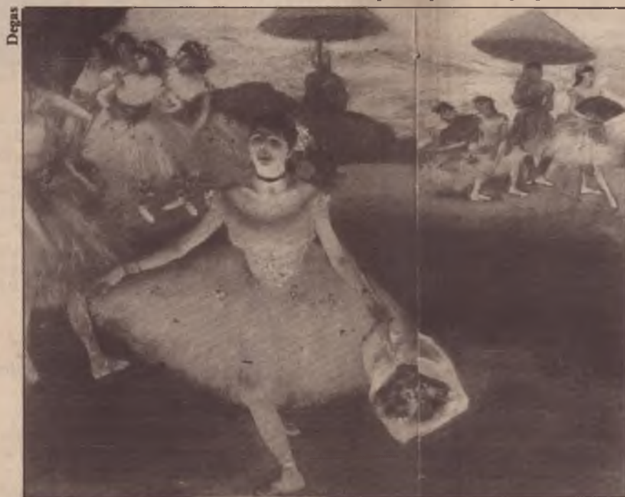
Bailarina com buquê fazendo mesura

A forma específica de estruturação deste organismo e a sua inserção na estrutura do governo ainda estão em discussão.