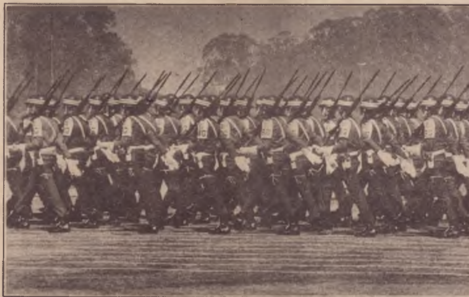
Poder militar: o "núcleo duro" da dominação burguesa

Estas contradições que configuram uma crise de legitimação do papel das Forças Armadas, somadas ao inevitável desgaste de vinte anos de ditadura, são mais que condições para que o PT avance e consolide uma consciência democrática e anti-militarista de massas que será tanto mais vital quanto mais avance a luta dos trabalhadores.