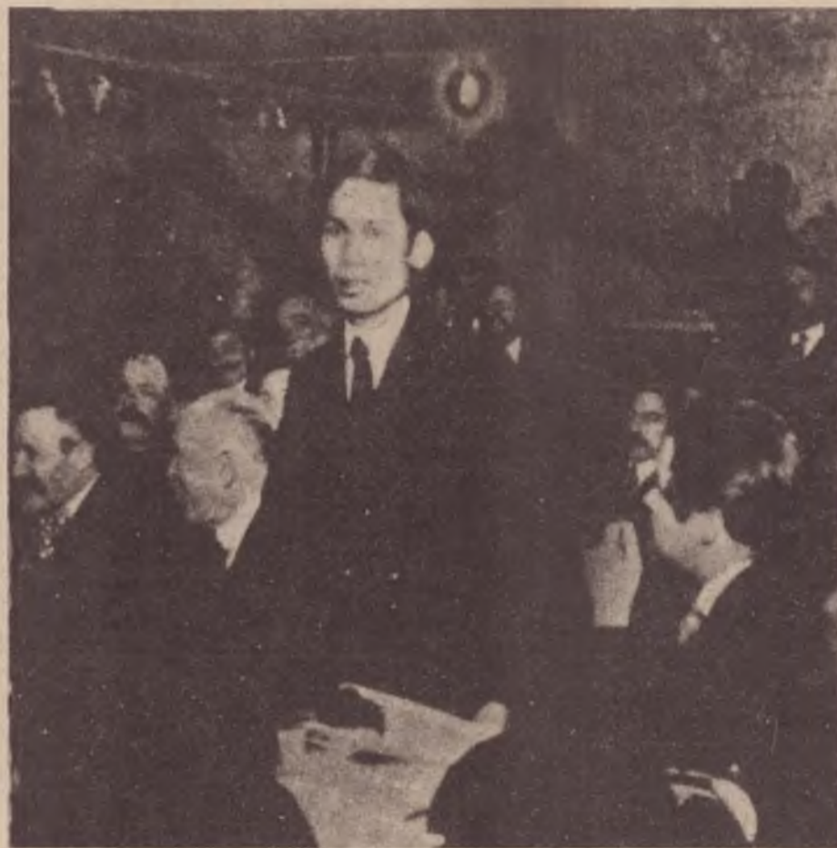
Ho Chi Ming aos trinta anos (1920) em uma reunião em Paris

A situação política ainda fica mais complicada quando, em 1939, Stalin e Hitler assinam um pacto de não agressão. A Alemanha nazista deixa, então, de ser a "inimiga principal" e a França e a Inglaterra, que eram, até então, aliadas para os estalinistas, passam a ser "belicistas". Nesse momento, cai o governo da Frente Popular na França. O novo governo francês resolve, em 26/9, colocar na ilegalidade o PCF. No Vietnã, a repressão sobre a esquerda não tardou: centenas de militantes foram presos e a suas organizações foram ilegalizadas.