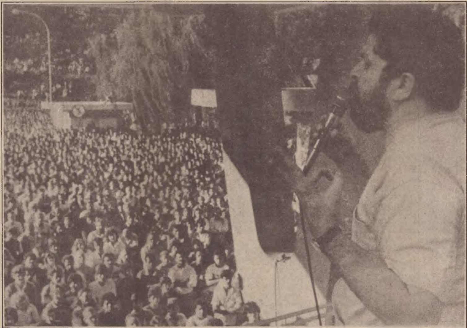
Lula discursa, como candidato à presidência, aos operários em greve no ABC

Podemos afirmar que o documento aprovado cria um campo comum com as análises e posições que a tendência Democracia Socialista vem desenvolvendo especialmente após as mudanças na luta de classes introduzidas pelas eleições de novembro de 1988. Trata-se agora de consolidar este campo, clarificá-lo e extrair dele todas as consequências políticas para a campanha