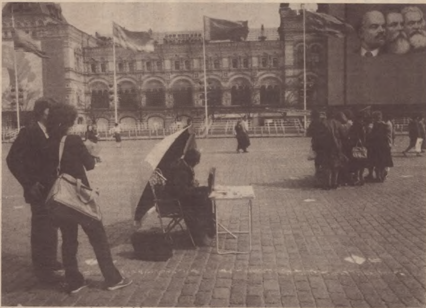
As bandeiras, os nomes, os mitos: o poder da burocracia em xeque

Atualmente, a Europa Oriental está sendo sacudida por uma crise sem paralelo desde o fim da Segunda Guerra Mundial. É na Romênia, sem dúvida, que ela é mais grave. Mas, nesse país, a chapa de chumbo do regime Ceaucescu, por enquanto, pesa de tal maneira que os aspectos políticos dessa crise permanecem sufocados, menos para a minoria húngara. Na Alemanha Oriental, onde o nível de vida é mais elevado, esta crise ainda não explodiu abertamente. Mas a estabilidade relativa destes dois países, sem dúvida, não durará muito.