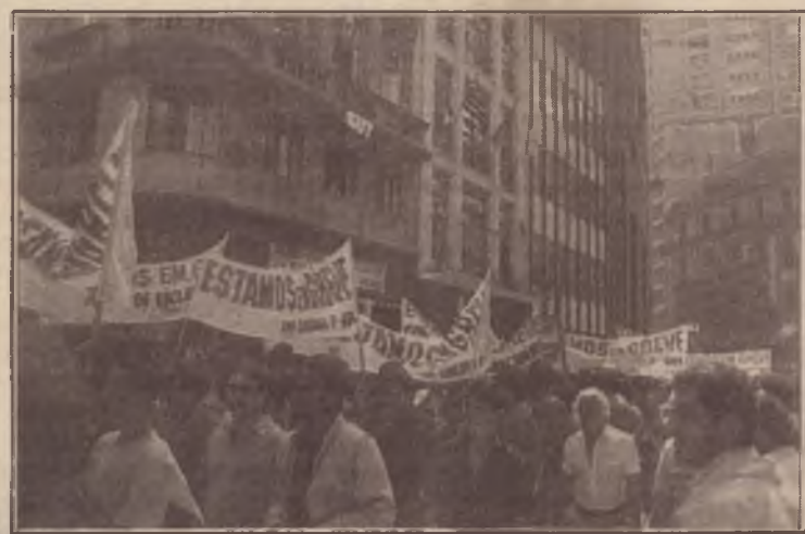
Greve dos bancários em São Paulo: testando forças