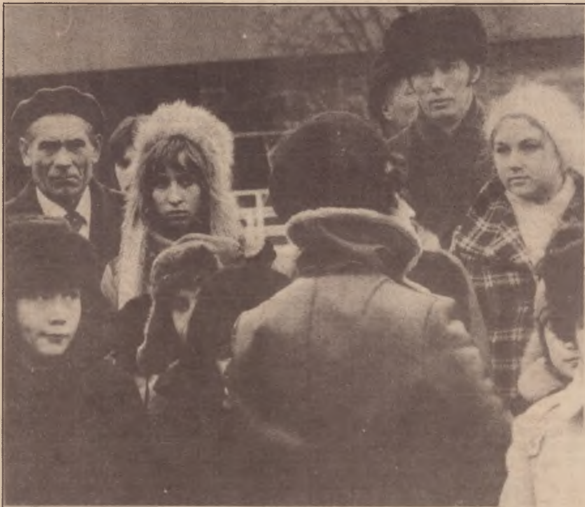
Febre em Moscou: a política vai às ruas

verdade sobre Trotski é, portanto, um combate político importante: atinge as raízes do próprio stalinismo e é condição de sua crítica radical. Muitos soviéticos travarão esse combate por motivos de salubridade moral (sem referência a um acordo com suas idéias que são ainda pouco conhecidas): Leon Trotski encarnando a única filiação histórica com a Revolução de Outubro e a luta intransigente contra o stalinismo.