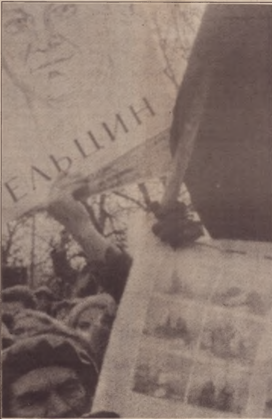
Sob uma bandeira vermelha, os partidários de Yeltsin em Moscou

ao burocratismo quanto a uma estreita lógica de rentabilidade de mercado, inapropriada e injusta.