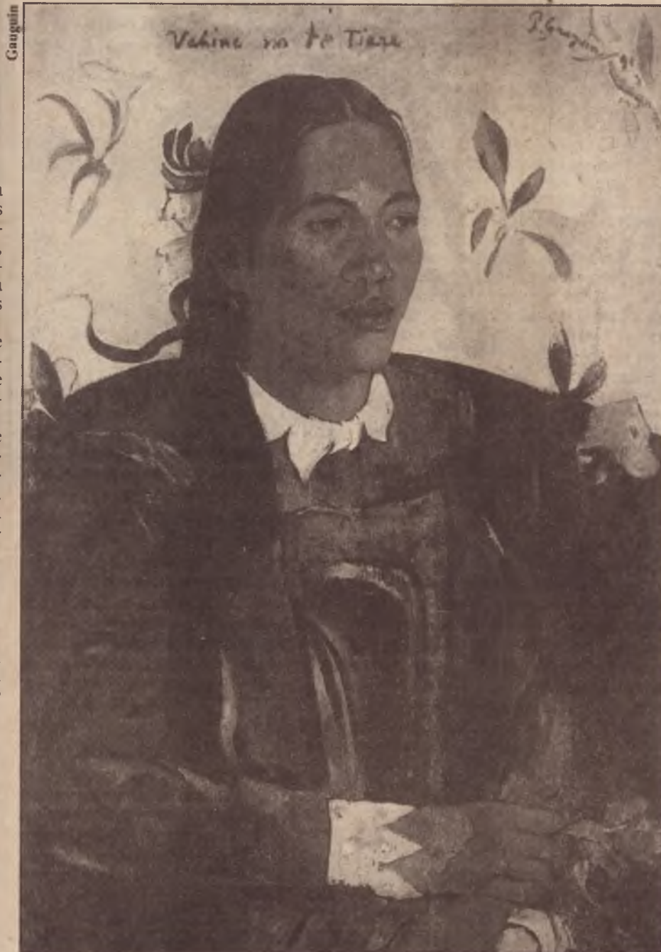
Vahine no te Tiare (Jovem taitiana com uma flor)

b) no âmbito da gravidez, atendimento especial e apoio psicológico nas