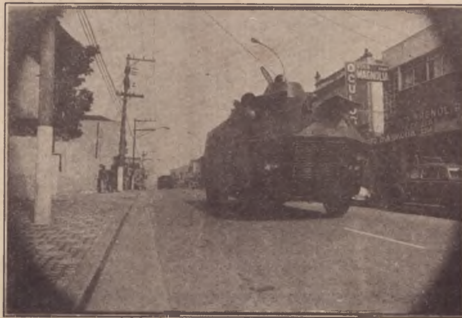
Uma peça do arsenal de guerra contra o povo

Já a polícia civil, inteiramente despreparada e incapaz de cumprir sua função investigativa e esclarecedora de quem cometeu crimes, com a sua camada dirigente assustadoramente corrompida por toda a sorte de contraven-