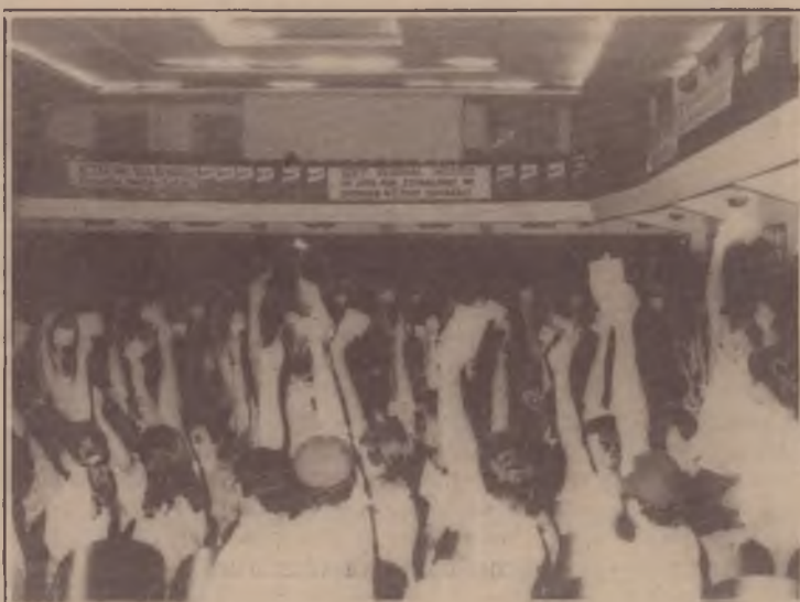
O Congresso gaúcho contou com forte presença rural

Centenas de delegados de sindicatos de trabalhadores rurais presentes ao Congresso demonstra-