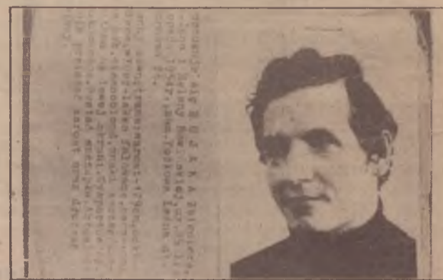
A expedição da prisão de Bujak, lançada logo após o golpe de dezembro de 1981.

Apesar da crescente repressão, a resistência de massas à burocracia persiste e precisa mais do que nunca da solidariedade internacional.