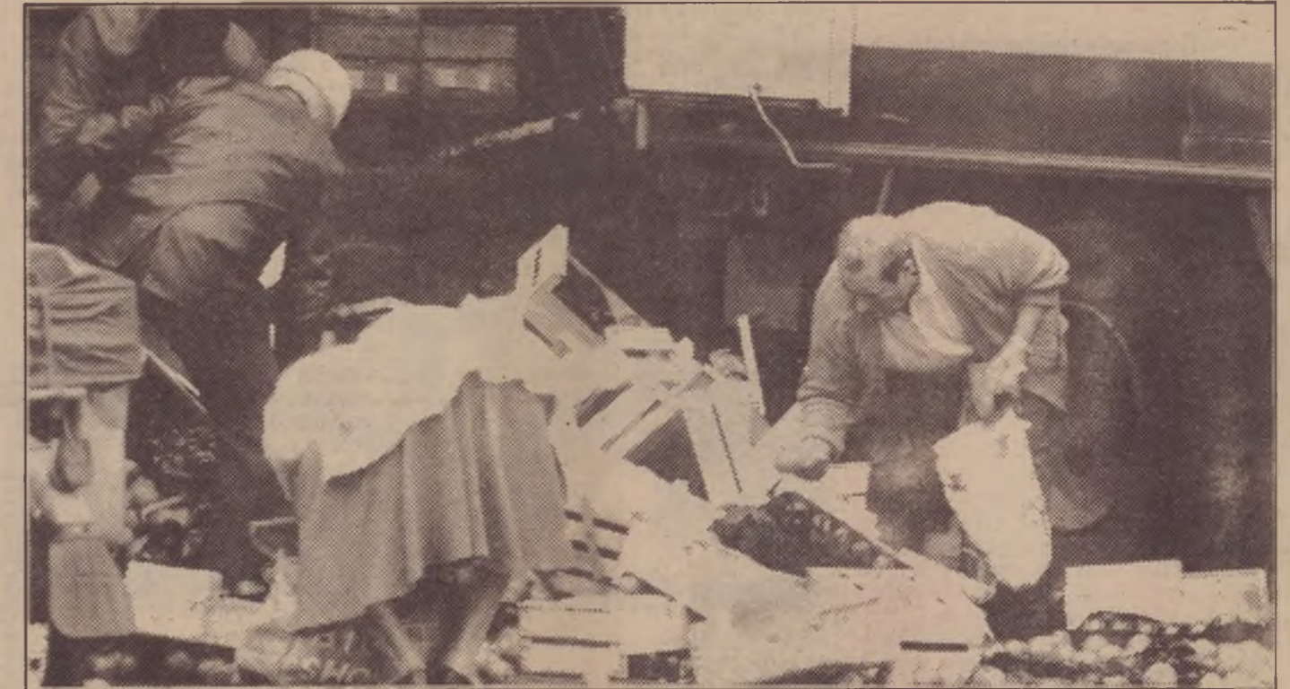
Os desempregados recebem cada vez menos ajuda

Em 1981, eles voltaram a crescer para cerca de 38%, o que equivalia ao nível de 1971, em plena guerra do Vietnã. Desde 1980 — Reagan foi eleito em novembro deste mesmo ano — os gastos do Pentágono e das armas nucleares aumentaram respectivamente em 63 e 51% em dólares constantes. O lema é o desenvolvimento dos setores de alta tecnologia que absorvem 20% dos gastos do Pentágono. Vê-se aqui a fragilidade de um equilíbrio econômico baseado sobre um tal setor. Que sobrevenha alguns erros como a explosão da nave Challenger (à qual estavam designadas certas missões militares) ou a explosão de um míssil Titan, e será todo o programa americano de lançamento de satélites que se achará minado.