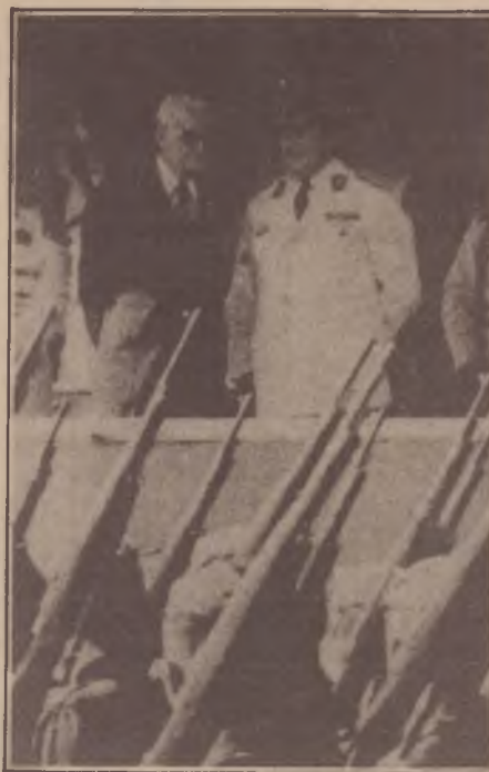
Geisel e Stroessner: fiéis parceiros

A crise econômica vem assolando o Paraguai a partir do momento em que deixaram de afluir os dólares referentes às obras hidroelétricas de Itaipu. Com um orçamento cinco vezes maior do que o Produto Interno Bruto paraguaio, Itaipu atuou como um poderoso propulsor da economia. Ao fim das obras, o Paraguai se viu reduzido a sua realidade de país agrário que, graças à corrupção internacional, conseguiu acumular um monstruoso capital financeiro, o que de forma permanente ameaça desestabilizar seu comércio in-