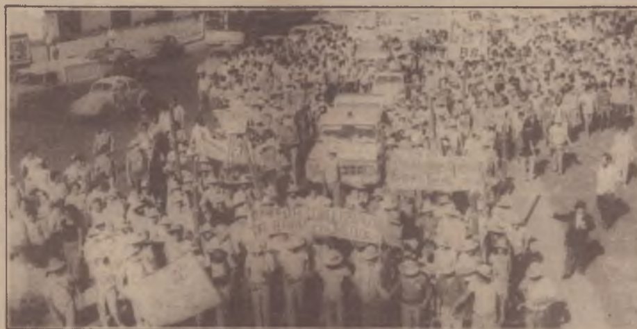
Na avenida Assis Brasil em Porto Alegre, a caminhada dos sem-terra.

Após 28 dias de caminhada, os sem-terra chegaram a Porto Alegre. Cerca de 250 colonos e mais de cinco mil pessoas percorreram os municípios da grande Porto Alegre, realizando grandes manifestações em São Leopoldo, Canoas e na Praça da Matriz, em frente ao palácio do governo do Estado. Acampados no saguão da Assembléia Legislativa e nos jardins do Inbra, os sem-terra fizeram jejum de um dia, em