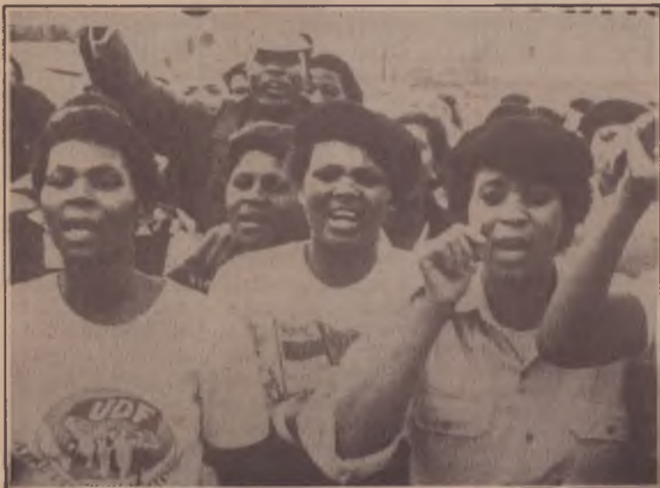
As frentes de oposição agrupam dois a três milhões de pessoas.

• 1982: uma grande reanimação do movimento sindical sul-africano se evidencia. Durante este ano, os trabalhadores realizam em torno de uma greve por dia. A partir de 1980, a economia sul-africana sofre a sua mais grave crise desde 1930.