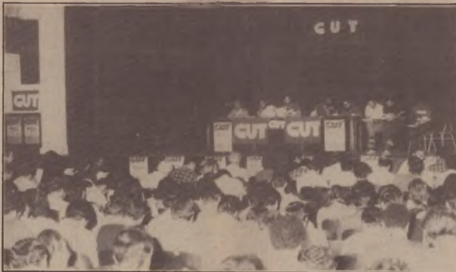
A plenária do III Congresso da CUT gaúcha

Não é outro o caráter da plataforma da Campanha Nacional de Lutas. Esta plataforma reúne as questões essenciais hoje colocadas pelo movimento sindical: salário, emprego, democracia e luta anti-imperialista, estas duas últimas