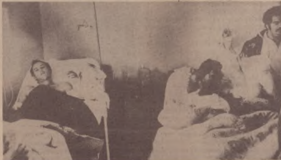
No hospital, muitos feridos pelas balas da polícia