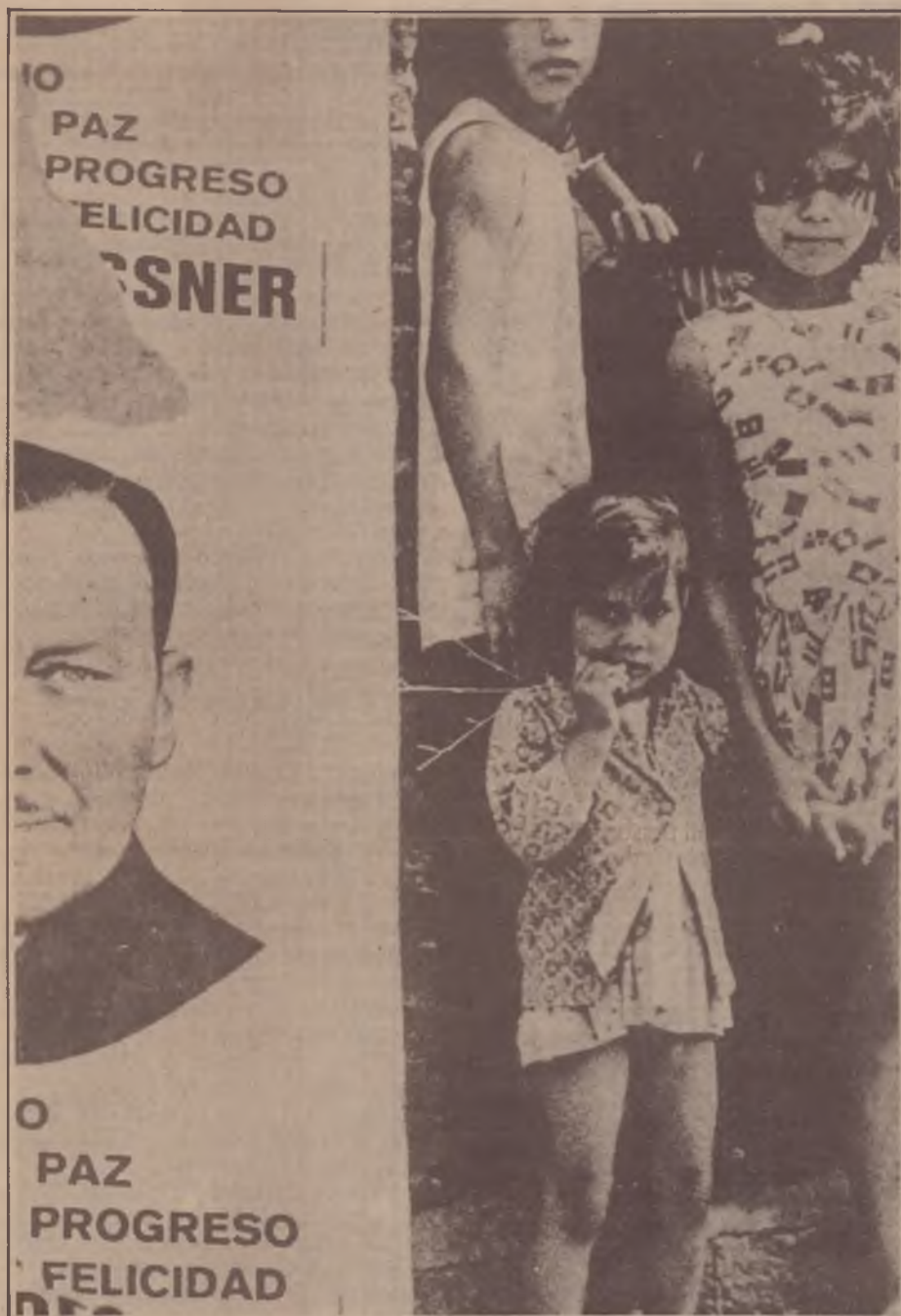
Stroessner: símbolo de brutalidade, corrupção e miséria.

ções em 1988). Para isso, já se prepararam duas personagens habilitadas para ser seu sucessor: o general Andrés Rodríguez (o segundo depois de Stroessner) e o presidente da Corte Suprema da Justiça, Luis María Argaña, que é apresentado à opinião pública como um paladino da honestidade. O general Rodríguez, comprovadamente um dos principais articuladores do narco-tráfico no continente, por exigência dos EUA, e com os olhos postos na sucessão, se converteu em repressor do contrabando de drogas e a cavalaria, que se encontra sob o seu comando, realizou várias ações contra redes de contrabandistas menores.