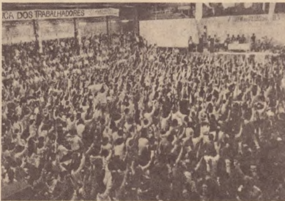
Presença massiva nas assembleias do sindicato dos bancários em São Paulo

As respostas dos trabalhadores tem sido de luta. Dia 23 de junho, dia de Protesto contra o pacote das estatais, reuniu no Rio de Janeiro mais de 50 mil trabalhadores: manifestações semelhantes ocorreram em vários outros estados, assembleias das categorias e setores tem se multiplicado reafirmando sua disposição de ir a greve na luta por seus direitos.