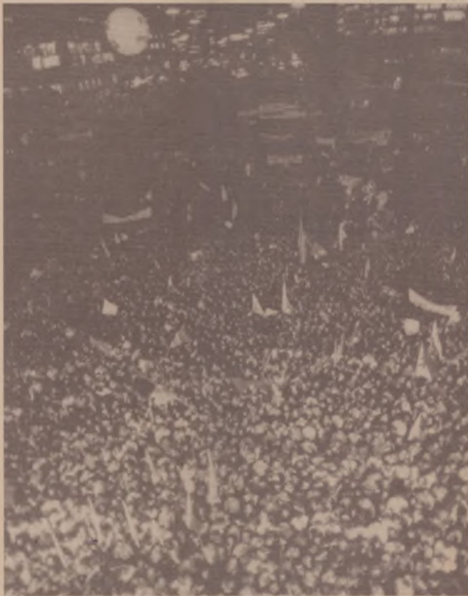
Manifestação no Vale do Anhangabaú, em São Paulo, no dia 25 de agosto de 1992

Criou para o Brasil, ao contrário do que se passa no cenário internacional, a possibilidade histórica de um caminho alternativo à ordem mais desigual, mais opressiva, radicalmente desumana, que significa o neoliberalismo na periferia do capitalismo.