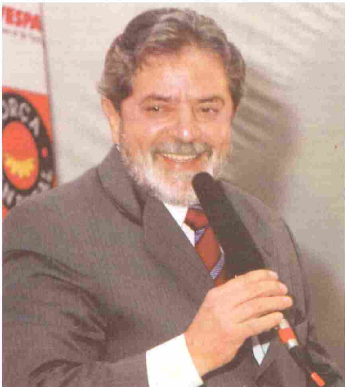
O pré-candidato do PT, Luiz Inácio Lula da Silva, no Encontro com Presidenciais

“Há três ingredientes que um governo precisa oferecer aos investidores nacionais e estrangeiros: