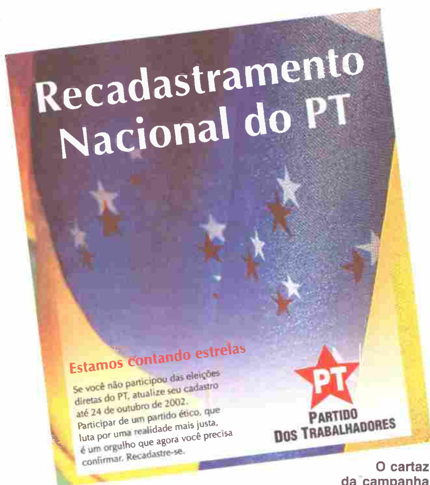
O cartaz da campanha

"O desafio agora é entrar em contato com os filiados que, de certa forma, estão afastados das atividades do partido, mas que ajudaram a tornar o PT, nestes 22 anos, um dos maiores partidos de esquerda do mundo e que anseia uma mudança de rumo que nos leve a uma sociedade realmente democrática e igualitária. E essa mudança cristaliza-se na candidatura de Luiz Inácio Lula da Silva à Presidência da República. Portanto, estamos contando estrelas, sim, convocando a todos companheiros para se juntarem nessa marcha rumo à vitória nas eleições de 2002".