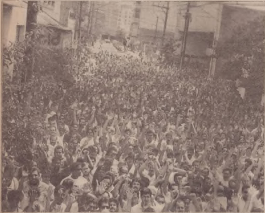
Assembléia de 4 de abril que discutiu o acordo

principal ainda está para ser discutida, disputada e acordada - na retomada das negociações que já está prevista para a primeira semana de abril.