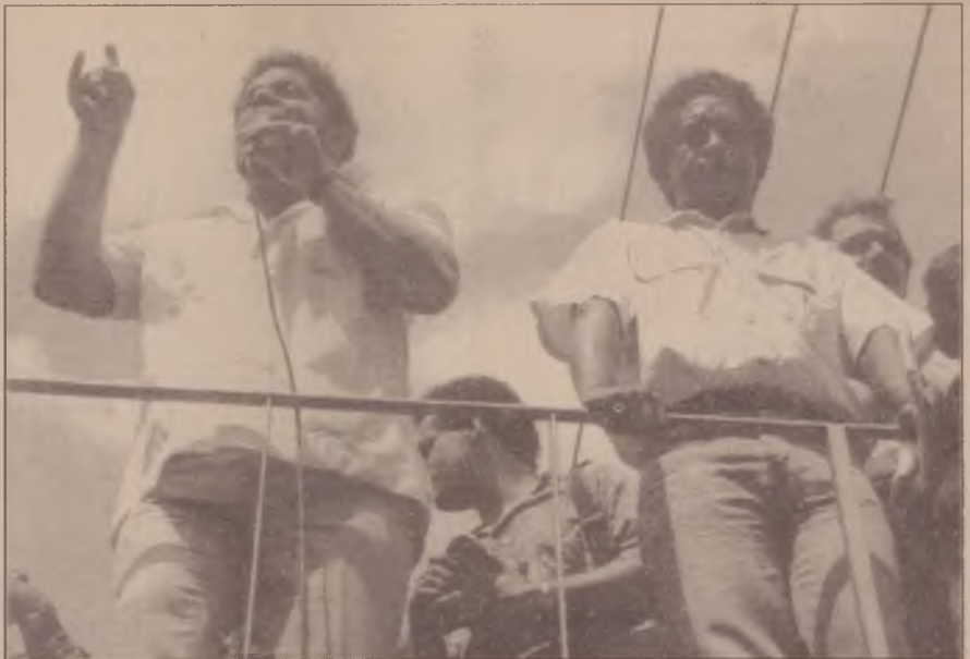
Lula e Vicentinho na assembléia

Porém, nessa batalha, o sindicalismo combativo está visivelmente atrasado. A estatística do IBGE mostrando que em 1991 houve um salto de produtividade da força de trabalho no Brasil - no bojo de uma queda da produção industrial, e de um aumento brutal do desemprego - é