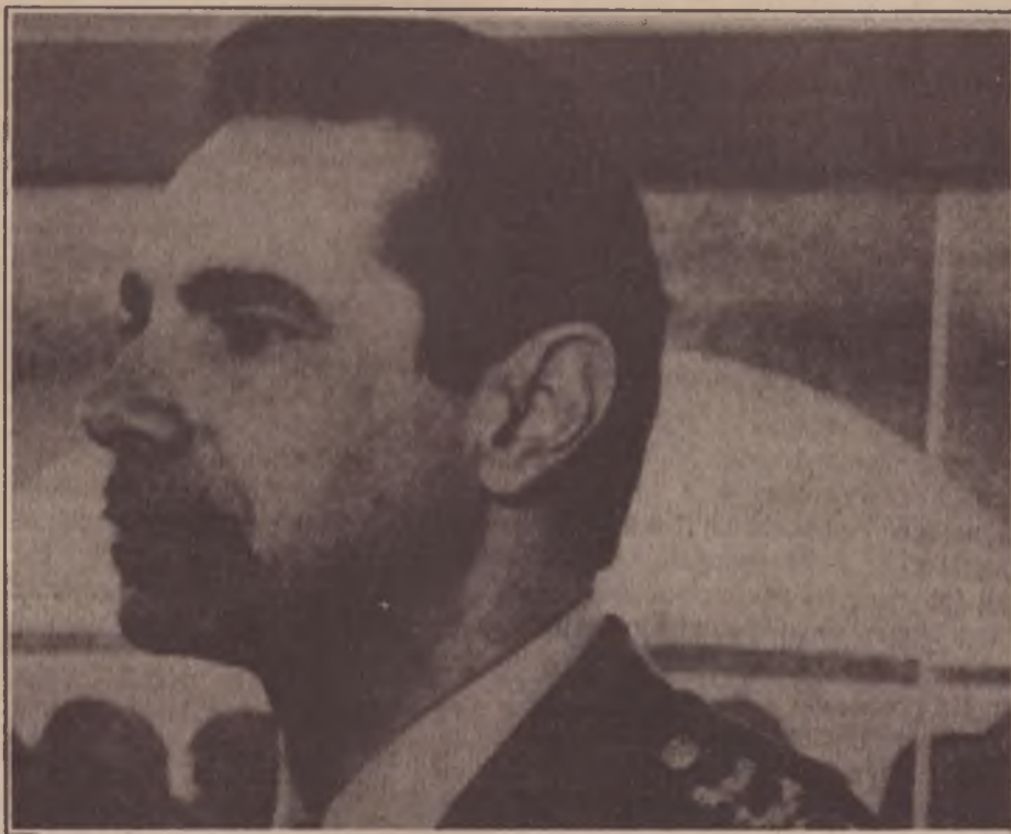
Coronel Ustra ("Tibiriçá"): de torturador a adido militar

A transição conservadora se apóia num pacto com os militares para que nada seja esclarecido. Antigos torturadores estão atuantes, impunes. E zelando pela estabilidade da "Nova República" o SNI acompanha todos os passos do movimento popular no país, coordenando a sua repressão. O preço que o PMDB no poder paga por esse