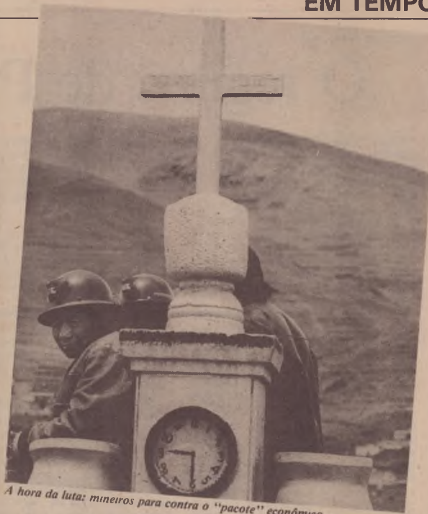
A hora da luta: mineiros para contra o "pacote" econômico

Ao lado da defesa da própria COB, o elemento central da luta hoje, é uma necessidade gigantesca construir um partido revolucionário que retire a esquerda boliviana da situação de atomização total em que se encontra e que possa apresentar alternativas políticas globais, do ponto de vista operário, para o conjunto da sociedade boliviana. Foi a ausência dessa alternativa que permitiu a atual ofensiva contra a própria COB e todas as conquistas centrais do proletariado boliviano.