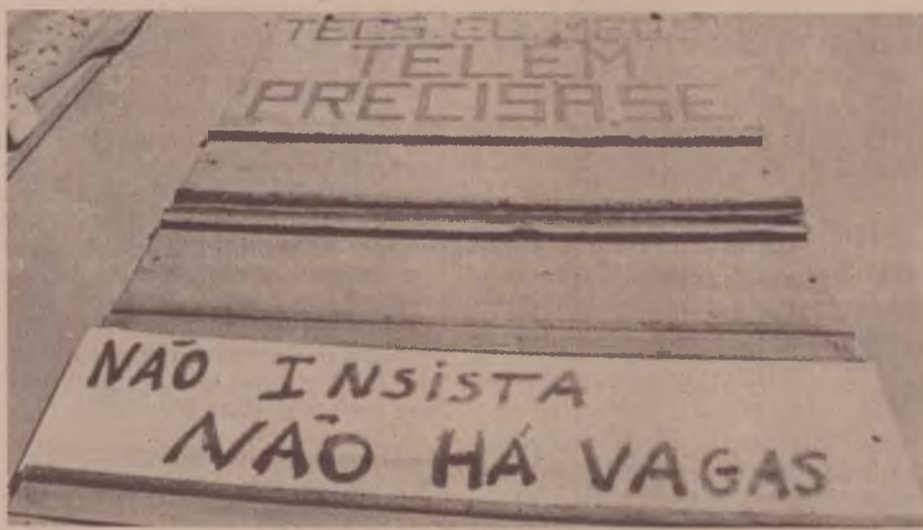
IV PND: suas inconsistências não resolvem problemas sociais

É de se concluir, pois, que o corte dos gastos públicos torna-se gradativa-