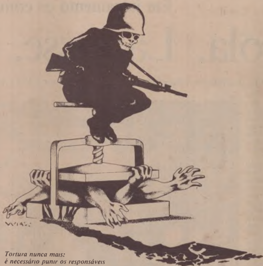
Tortura nunca mais: é necessário punir os responsáveis

Em 28 de agosto de 1979 o governo derrotando no Congresso o projeto de anistia ampla, geral e irrestrita aprova o projeto de Figueiredo: uma anistia limitada, restrita, condicionada e prioritariamente para os aparelhos de repressão policial-política. É uma farsa.