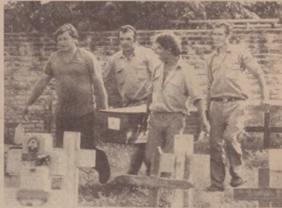
Em Buenos Aires, localizados corpos de desaparecidos.

Dada à grande arbitrariedade, o profundo e extremo rigor destas prisões, Alfonsín vai fazer com que a bancada Radical (também a Peronista votou), vote uma lei que considera que, dado às brutais condições no interior das prisões argentinas, cada dia de prisão valia por dois. Ao ser aprovado fez com que gente, que por exemplo, estivesse condenada a 12 anos e estivesse a 6 na prisão estaria com a pena cumprida. E aqueles que estivessem condenados a 18, tendo completado 2/3 da pena podiam sair através do uso da condicional. São mecanismos, todos eles profundamente azeitados e articulados, que fazem com que sem ter dado anistia ele esvaziou as prisões (ficaram apenas 14 presos políticos), diminuindo o