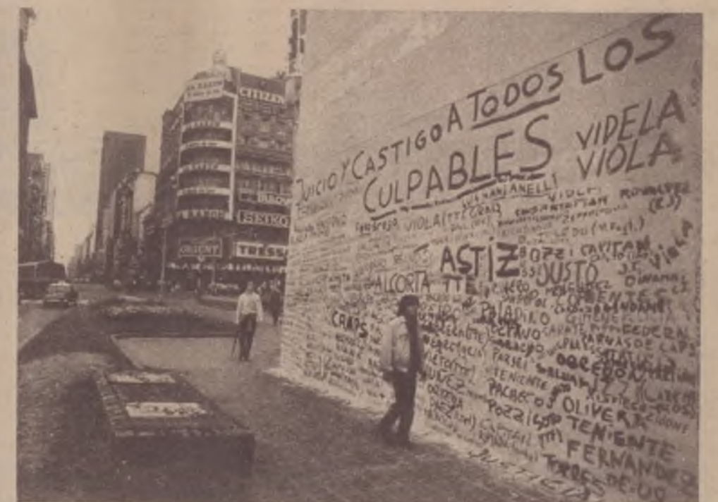
Pressão popular: punir os culpados pela repressão

Tanto no Brasil como na Argentina trata-se de um método, um método através do qual, e no caso da Argentina nesse julgamento ele fica absolutamente claro, há uma intenção do estado através de um acionar clandestino, de eliminar pela morte, no caso da Argentina, de sequestro, desaparecimento, campo de concentração e morte, a oposição política, produzindo assim dois fenômenos importantes: a aniquilação da oposição política e a paralisação da sociedade pelo terror. Então, isso é um método implementado de cima para baixo e não há excesso. O método que é excessivo.