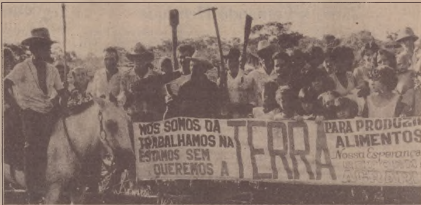
Ocupações: a luta coletiva pela posse da terra

As campanhas salariais já praticamente lançadas exprimem o novo teor das lutas em todo o país. A reforma agrária é item inseparável das pautas de reivindicações de norte a sul. As manifestações camponesas se irradiam para as cidades, a exemplo dos acampamentos do Largo de São Francisco, no