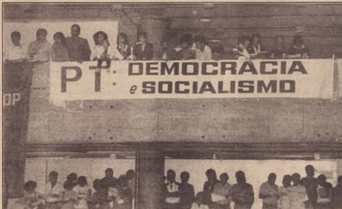
"... um governo hegemônico pelo proletariado e que só poderá se viabilizar com uma ruptura revolucionária"

Para responder a esta pergunta, é importante partir do fato de que o texto passou por muitas modificações desde a sua primeira versão, inclusive no próprio Encontro (incorporação de muitas emendas, muitas delas propostas pela chapa de que participamos), modificações que o melhoraram progressivamente, que o tornaram mais claro, mas que não retiraram algumas