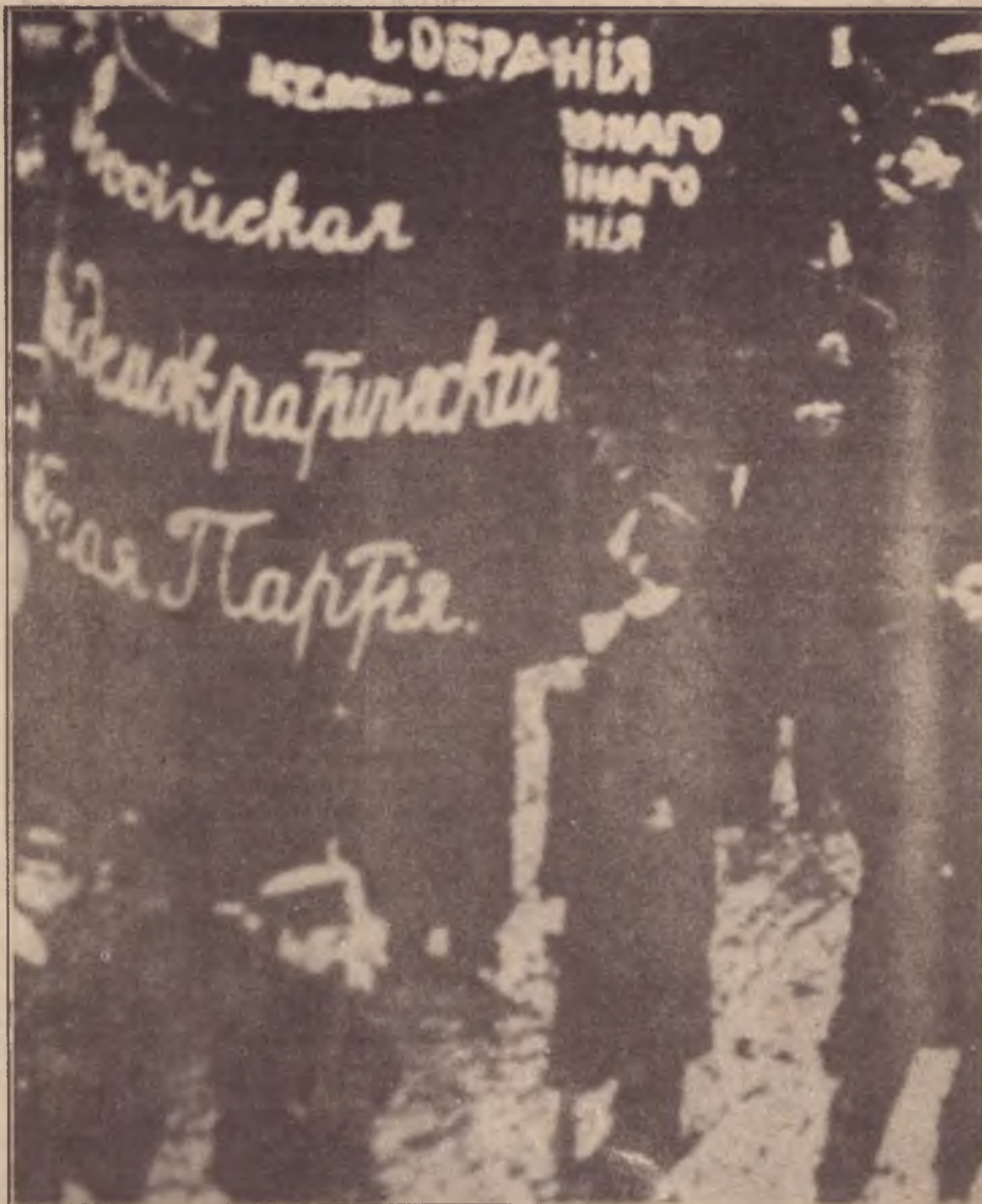
Manifestação anticzarista em Petrogrado: "a revolução é a festa dos oprimidos e explorados", diria Lenin, inspirado nos acontecimentos de 1905.

De extrema importância igualmente foi a compreensão aprovada de que a construção do socialismo significa também a superação de todo o tipo de opressão à emancipação plena das pessoas, mais além de exploração econômica propriamente dita. O Encontro resolveu que "o projeto socialista pelo qual lutamos deve incorporar as perspectivas colocadas pelos diferentes movimentos sociais que combatem opressões específicas como as das mulheres, dos negros, dos jovens, dos homossexuais e suas expressões ideológicas, em particular o feminismo..."