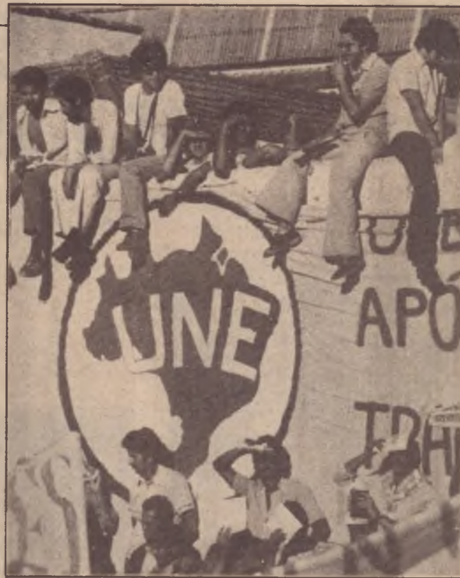
1979: a UNE é reconstruída na luta contra a ditadura

De um lado, ficou o PC do B defendendo a continuidade da política aparelhista que implementou na direção da UNE, que vinha não só afastando a entidade dos estudantes como também aprofundando o seu isolamento na sociedade e principalmente no interior do movimento operário e popular combativo do país. De outro, a oposição liderada pelo PT, que expressava uma avaliação crítica da situação do movimento, a necessidade de colocar a UNE dirigindo a luta dos estudantes nas universidades e ao mesmo tempo junto à CUT, à ANDES, à FASUBRA e ao conjunto do movimento operário e popular combativo do país na luta contra a "Nova República" e ao lado dos trabalhadores em suas lutas.