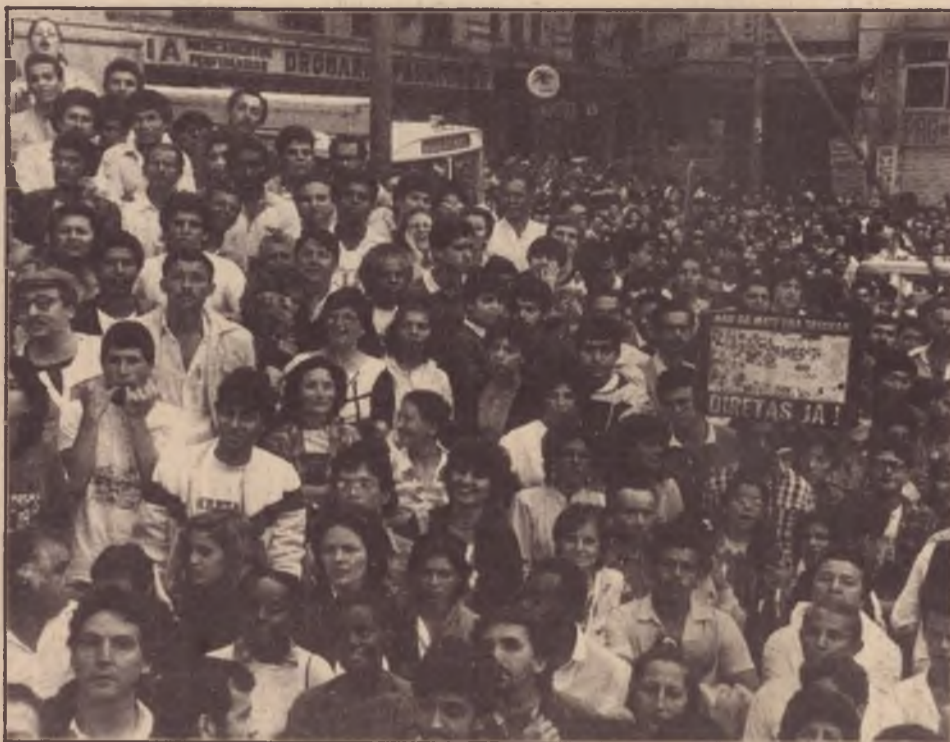
Diretas já: um grito ainda parado no ar

A segunda linha de explicação se voltaria mais para o caráter subjetivo do impasse, isto é: apesar de alcançar um volume de atividade massivo, o movimento operário e popular careceria de grandes fragilidades de consciência política e de organização que impediriam um combate político de massas centralizado à transição burguesa. Se isso é certo, o fundamental dos nossos esforços seria não o de relegar a um futuro longínquo a idéia da organização de uma alternativa global de massas à "Nova República", mas investir com força na solução (ou atenuação) dessas fraquezas políticas