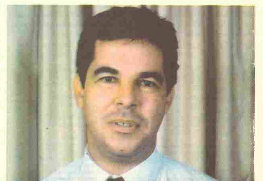
Jorge Viana, o único governador petista (Acre) eleito em primeiro turno