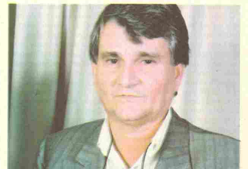
Zeca do PT foi eleito governador do MS com mais de 60% dos votos