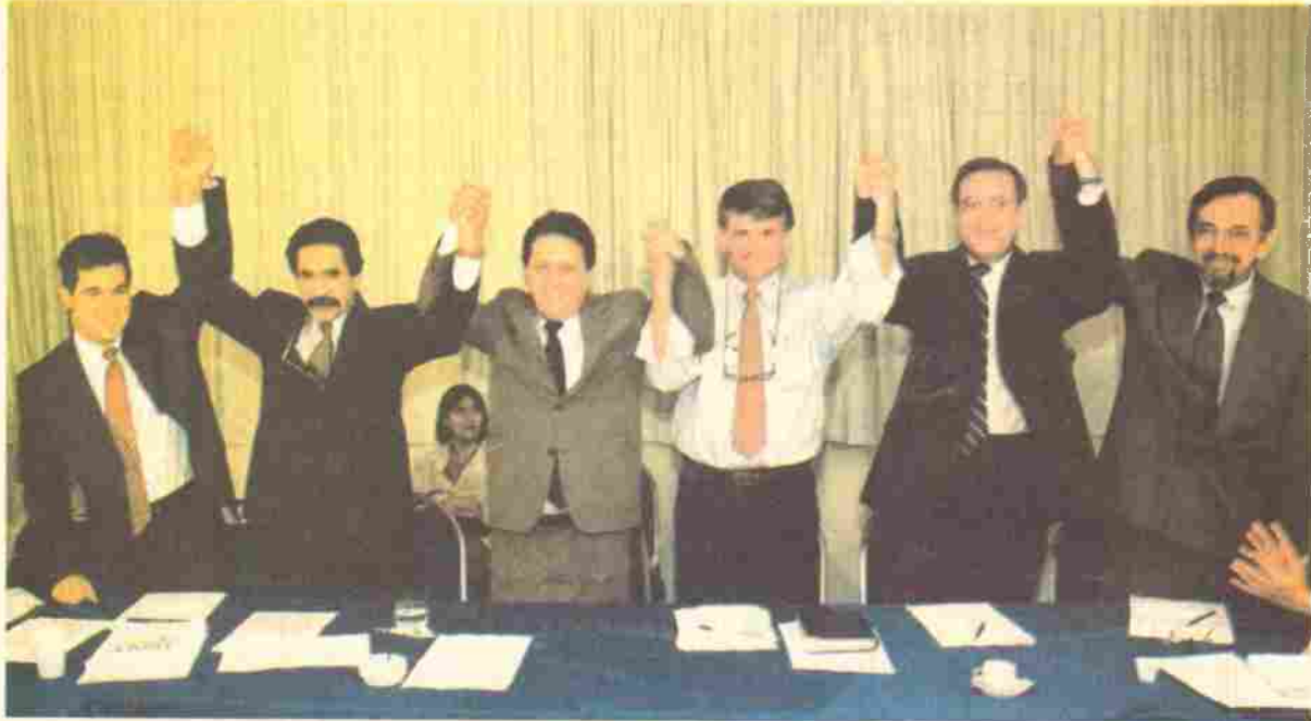
Seis governadores da oposição recém-eleitos reúnem-se para estudar alternativas ao pacote fiscal anunciado pelo governo

Os seis governadores de Estado eleitos por partidos de oposição formalizaram no dia 29, em Brasília, reação ao pacote fiscal anunciado quarta-feira pelo governo.