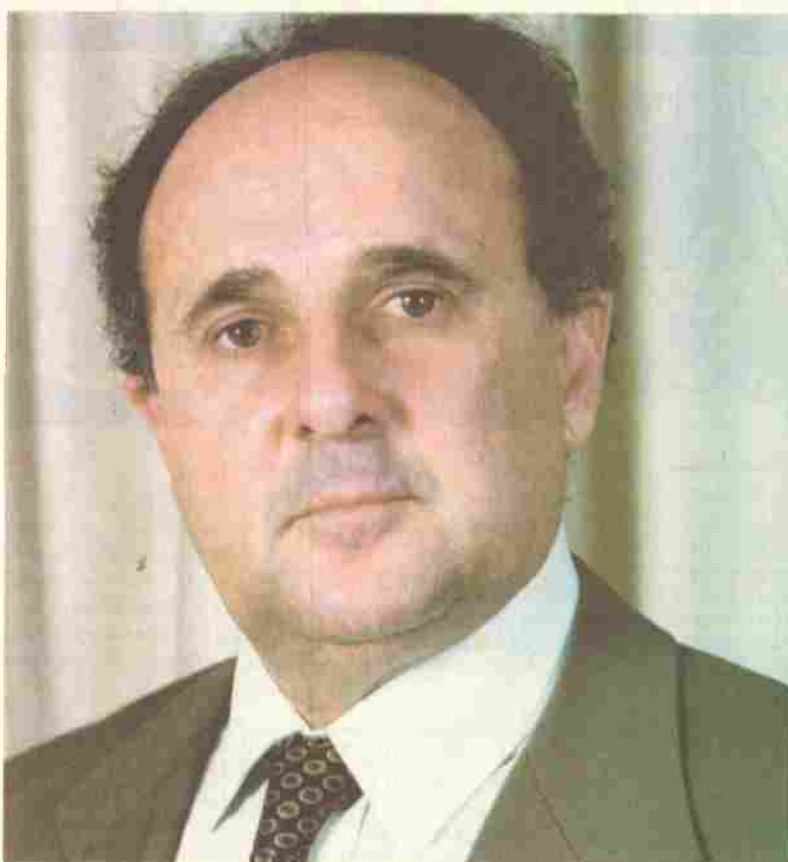
Cristovam Buarque: "você pode contar conosco; o sonho não acabou"

Estaremos juntos nos sindicatos, nos movimentos populares, nos movimentos democráticos, nos nossos partidos reunidos na Frente Brasília Popular, na Câmara Legislativa, no Congresso Nacional. Estaremos juntos sempre que as circunstâncias nos convocarem a assumir nosso lugar na luta por Brasília, pelos interesses