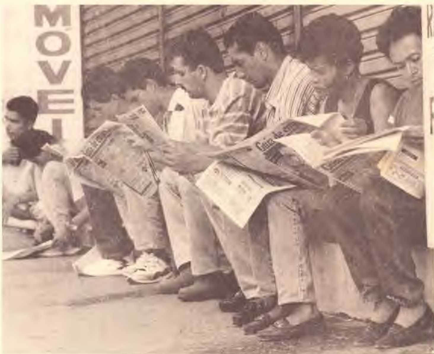
Política adotada pelo Governo Federal desde a implantação do Plano Real provoca desemprego e pretende eliminar direitos históricos dos trabalhadores

A agenda para os próximos meses prevê várias atividades, que contam com o apoio e participação do Partido dos Trabalhadores. E o caso da Conferência Nacional em Defesa da Terra, do Emprego e da Cidadania. Prevista para os dias 4, 5 e 6 de abril, em Brasília, a