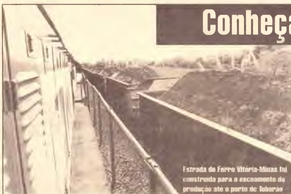
Estrada de Ferro Vitória-Minas foi construída para o escoamento da produção até o porto de Tubarão

No final da década de 1970, o Governo lança o Programa Grande Carajás, na Região Amazônica. A intenção do projeto era criar novas oportunidades de emprego na região, explorar os recursos naturais ali abundantes, preservar e valorizar o meio ambiente e a população locais e servir de mecanismo de integração nacional. O escoamento da produção se daria com a construção da Estrada de Ferro Carajás, ligando o Pará a São Luís do Maranhão, e o