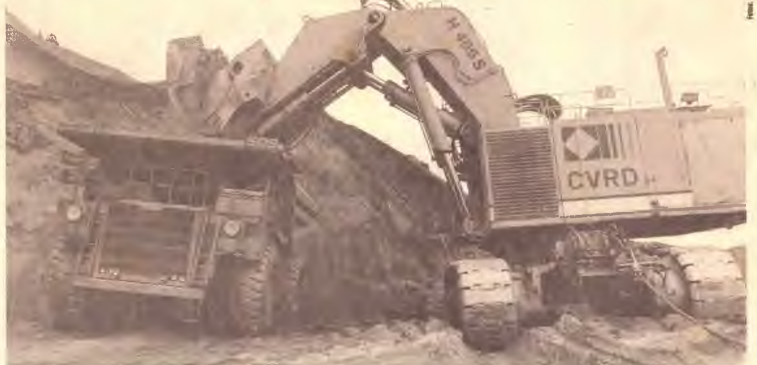
Mina de ferro do complexo Conceição, em Itabira (MG): através da Vale, Brasil é o maior produtor e exportador do minério do mundo

Como explicar, então, os lucros extraordinários que a Vale vem obtendo ao longo dos anos? Em 1995, segundo a Folha de S. Paulo (23/01/97), a empresa lucrou US$ 338 milhões, exportou um total de US$ 1,46 bilhão (o dobro da Autolatina) e investiu US$ 440,2 milhões. Uma empresa desse porte é fundamental para que o País possa direcionar seus inves-