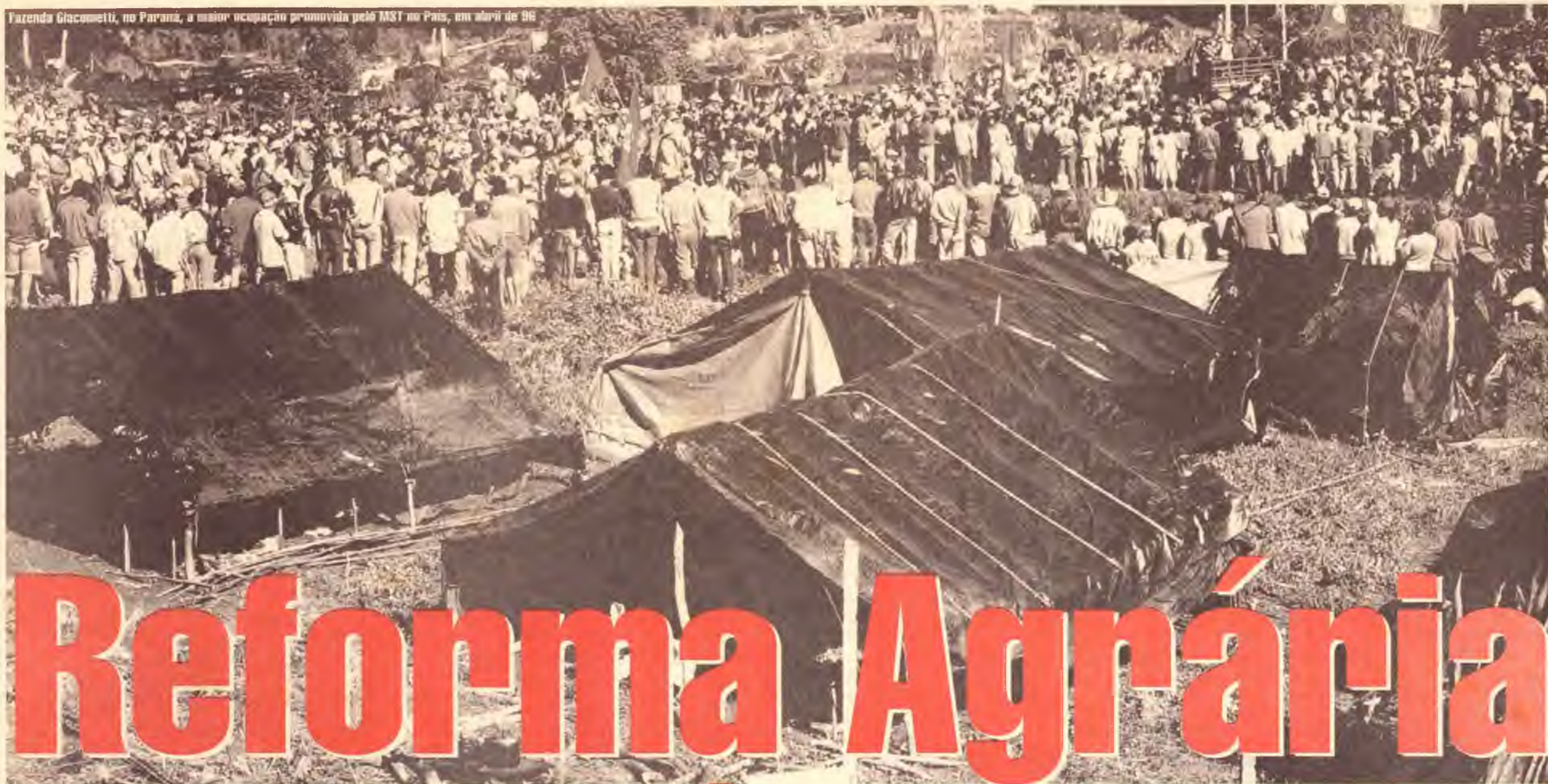
Fazenda Giacometti, no Paraná, a maior ocupação promovida pelo MST no País, em abril de 96