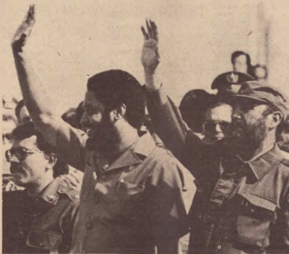
Daniel Ortega (Nicarágua), Maurice Bishop (Granada) e Fidel Castro nas comemoração do 1º de maio em Havana.

Aqui, uma história da revolução granadina, de suas principais conquistas.