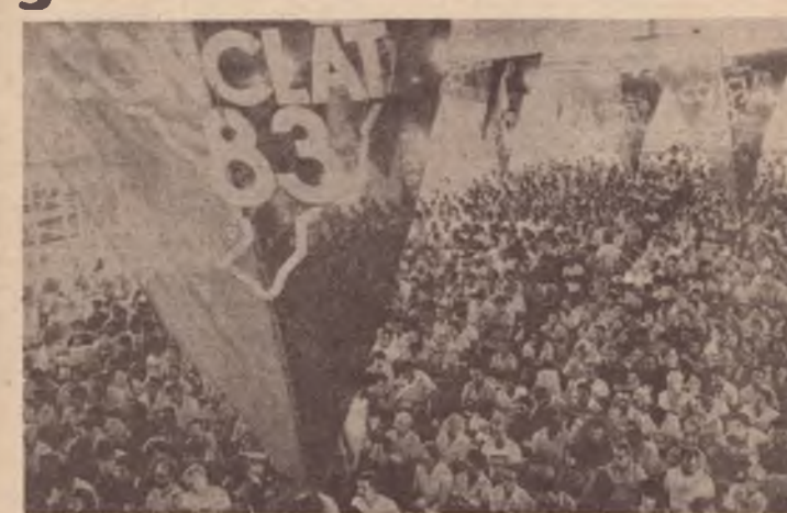
O Congresso reuniu 1.258 entidades

4) O leitor deve notar que os "sindicatos urbanos" incluem, além de entidades de base nacional, os sindicatos de indústria e de serviços básicos (eletricidade, saneamento, etc) e as atividades terciárias (comércio, serviços, etc.), que poderiam ser desagregados da seguinte maneira: