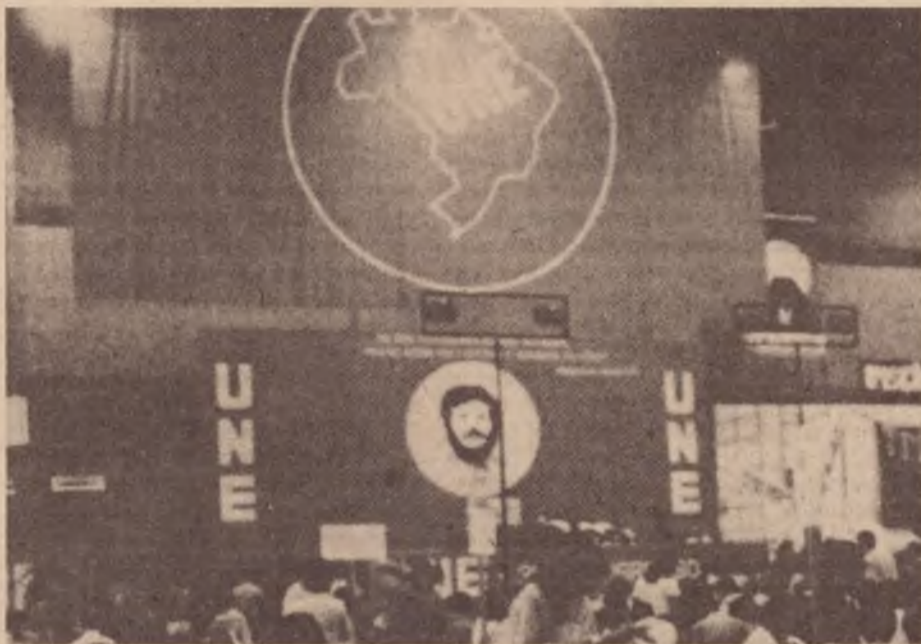
2.800 delegados no Congresso da UNE

Contrariando as expectativas formadas nos principais congressos estaduais, as posições do bloco combativo não foram majoritárias, embora demonstrassem um sensível crescimento.