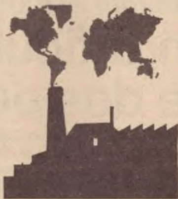
parte das bases trabalhadores do próprio peronismo.

Alfonsín, figura não comprometida com o regime e que dirigiu a modernização da União Cívica Radical, o mais antigo partido da Argentina, e no qual as classes dominantes depositam irrestrita confiança. Pôde, assim, capitalizar todo o anseio dos argentinos de superação não apenas da ditadura mas da violência política associada ao peronismo. O candidato do radicalismo foi eleito com o apoio da burguesia e da esmagadora maioria das classes médias, além de