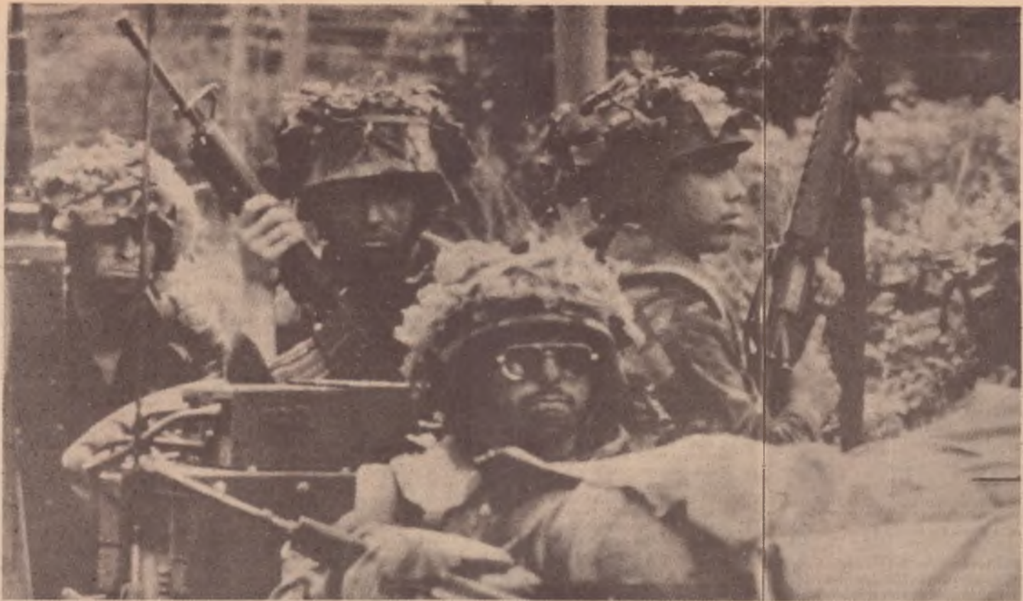
Soldados americanos dirigem-se ao campo de batalha na ilha invadida.