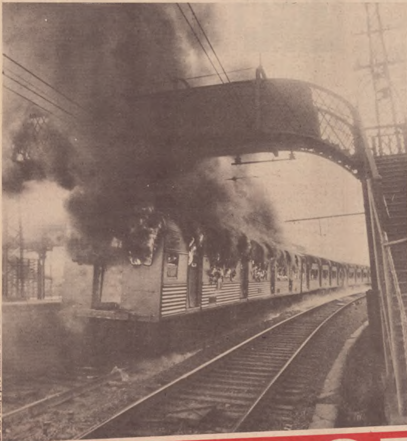
Em São Paulo, o povo incendia trens em atraso

Fundada a central da conciliação págs. 8 e 9