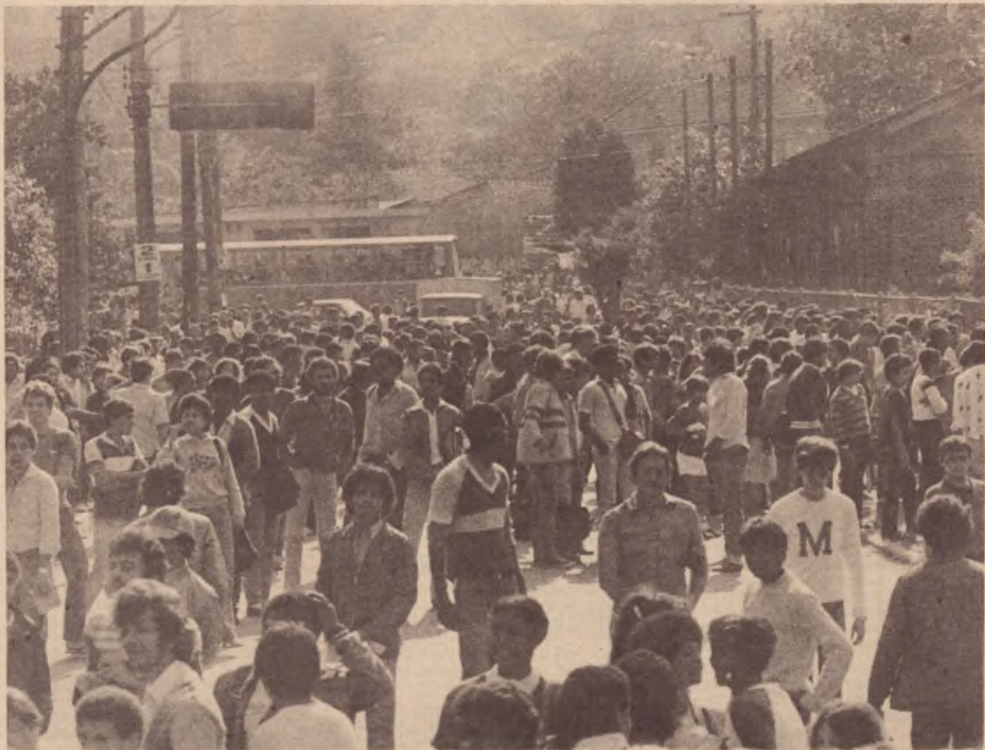
Milhares de pessoas na estação: a hora de quebrar

A ocupação de terrenos vem se avolumando à medida da crise do BNH do aumento do desemprego, do aumento dos preços de aluguéis. Pode-se dizer que vêm ocorrendo sistematicamente em todos os cantos do país. Ficaram famosos os casos da ocupação do conjunto