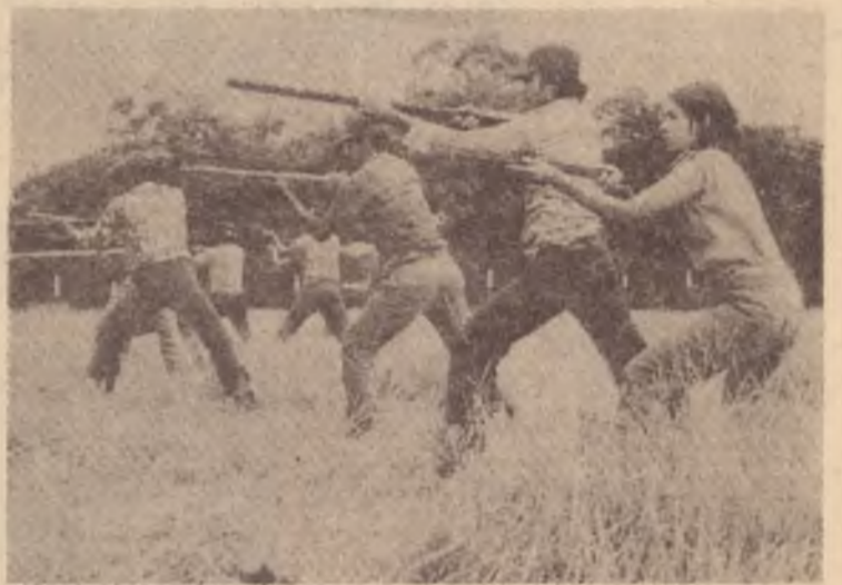
Treinamento de milícias populares

— RG: Vejamos um exemplo: na colheita de 80/81 foram colhidos 220 mil fardos de algodão, nosso principal produto de exportação. Agora, quando já deveríamos estar semeando 80% dos hectares destinados ao algodão, apenas 30% está semeado. Ou seja, está se orquestrando a paralisação do país. Aí então, quem terá que responder é a classe operária e os pequenos e médios produtores que estão organizando-se para sustentar a economia; porque os grandes latifundiários se negam a desenvolver uma atividade econômica.