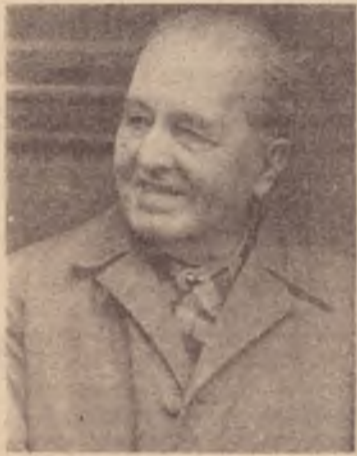
Luiz Carlos Prestes