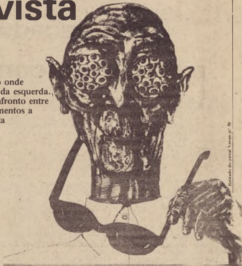
Retrato do jornal Verde p. 8