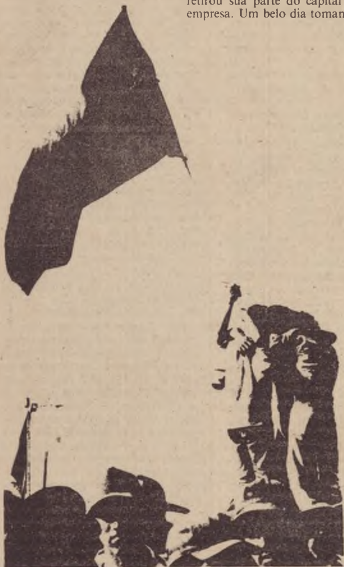
1979: comemoração da vitória

— ARG: Este caso é um exemplo claro de até onde "La Prensa" chegou. Quanto a esse homem, são comprovados seus contatos com os bandos armados contra-revolucionários, está comprovado que tem juntado fundos para eles, que tem armas etc. O homem aceita esses cargos e "La Prensa" sai em sua defesa. Até onde chegará essa generosidade? Será o povo, os dois milhões e meio de nicaraguenses quem decidirá até quando.