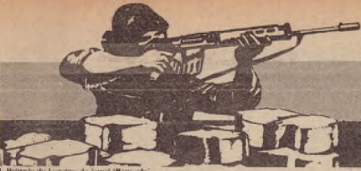
Retrato do Logotipo do jornal "Barricada"