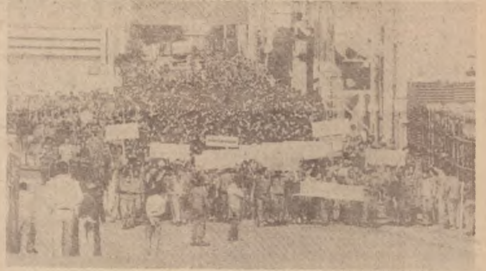
Operários da Ford fizeram passeata no pátio da empresa.

Organizando assembleias nas portas das fábricas, paralisando a produção, os sindicalistas do ABC demonstram que a classe operária está disposta a resistir à ofensiva dos patrões.