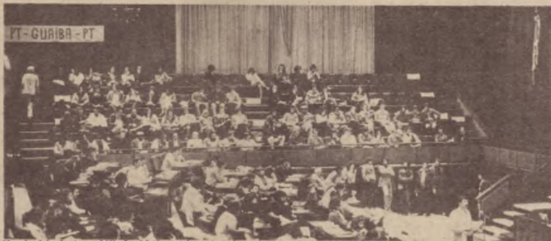
No plenário da Assembleia Legislativa petistas de todo o estado realizaram sua pré-convenção.

No que concerne à tática eleitoral, o texto da Comissão Regional defendia a necessidade de