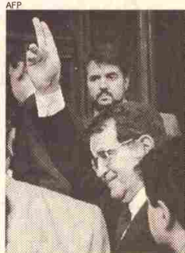
Prodi na saída do Parlamento

O RD vetou os cortes do orçamento propostos por Prodi, exigindo que não se tocasse nos fundos de pensão e nos planos de assistência médica e reivindicando jornada de trabalho para 35 horas semanais, sem redução