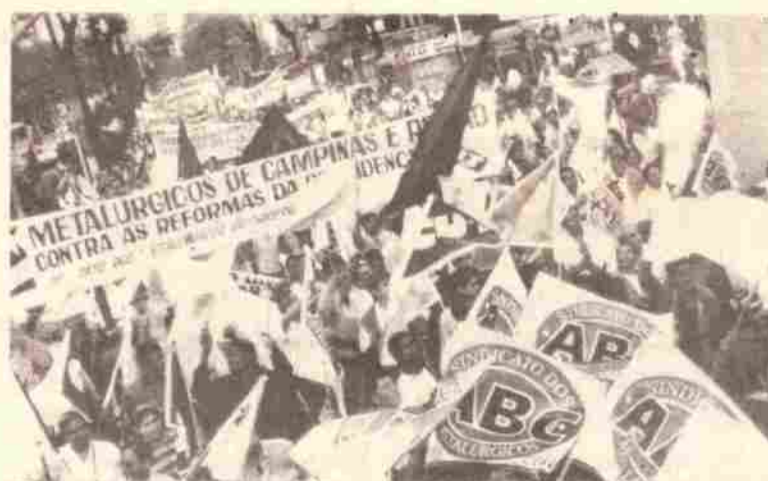
Manifestação em São Paulo, no dia 1º, alavancou mobilizações

rumo a Brasília. A previsão é que, no dia 12 de novembro, os participantes cheguem à Capital Federal, onde farão manifestação em frente ao Congresso Nacional. “Será