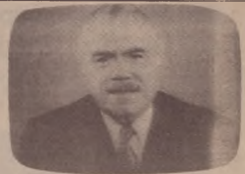
Desta boca, a verdade não flui