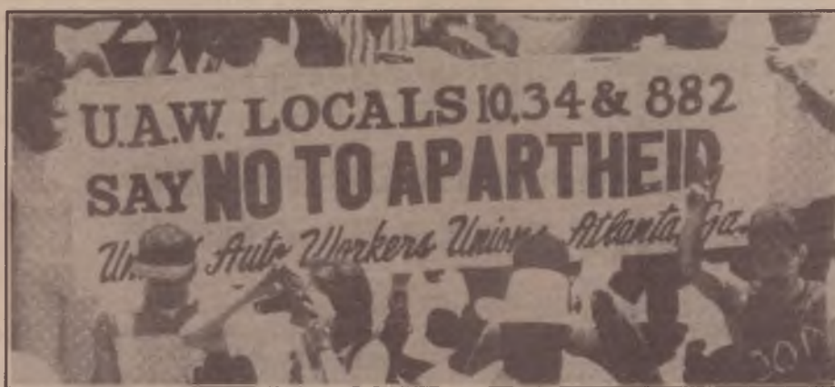
Diga não ao apartheid: cem mil na marcha de 14 de junho em Nova York

Se a negativa desses governos denuncia os interesses estratégicos que possuem na manutenção do apartheid, as sanções até agora adotadas por outros países se revelam de uma ineficácia a toda prova. E desmentem sobretudo as justificativas "humanitárias" de Reagan e Thatcher de que a imposição de sanções resultariam em maior prejuízo à população sul africana e aos países menos desenvolvidos da região, que dependem da economia da África do Sul para sua sobrevivência.