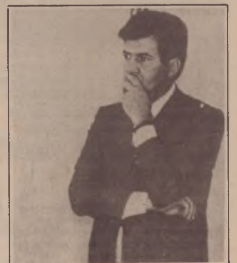
Pazzianotto: uma doce lei para os patrões

Na parte que diz respeito a solução de pendências entre trabalhadores e patrões, a novidade introduzida é a da possibilidade de um arbitramento fora da justiça desde que estabelecido de comum acordo entre as partes. Na legislação anterior só havia duas possibilidades: a instauração de dissídio coletivo ou a greve. Por fim, a greve continua explicitamente proibida nos seto-