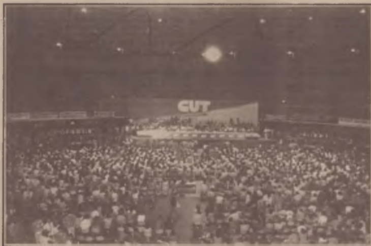
5.181 delegados presentes no Maracanãzinho

Na verdade, o II Congresso Nacional da CUT foi antes de tudo uma grande festa da classe trabalhadora, de demonstração da sua força e de sua unidade. Vencendo todas as dificuldades econômicas, 5.181 dos 6.517 delegados inscritos foram ao Congresso. De todos os cantos do país, de todos os ramos de atividade econômica: 1.860 do campo; 1.250 do setor de serviços; 991 de associações pré-sindi-