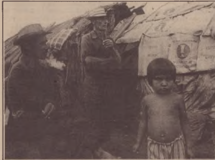
O "milagre mineiro": fantasmas da agonia

Afinal, financiadores do grande capital, administradores dos interesses de uma burguesia curta e grossa, os governos militares e seus prepostos não mantiveram qualquer compromisso com a questão social, fazendo da vida de milhares de trabalhadores um inferno.