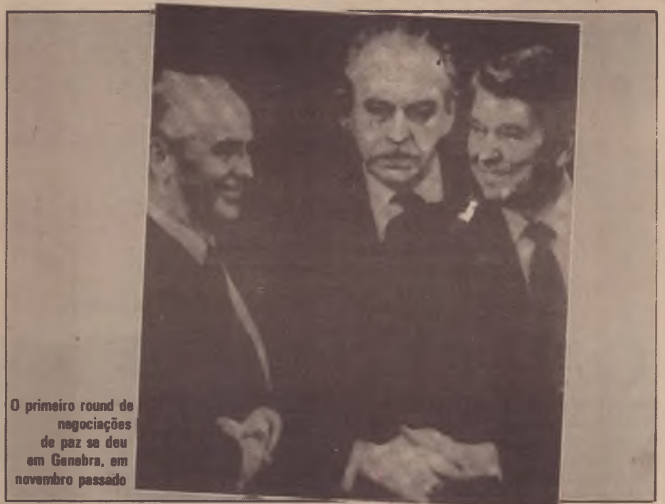
O primeiro round de negociações de paz se deu em Genebra, em novembro passado

Da atitude americana ressalta atualmente uma grande impressão de confu-