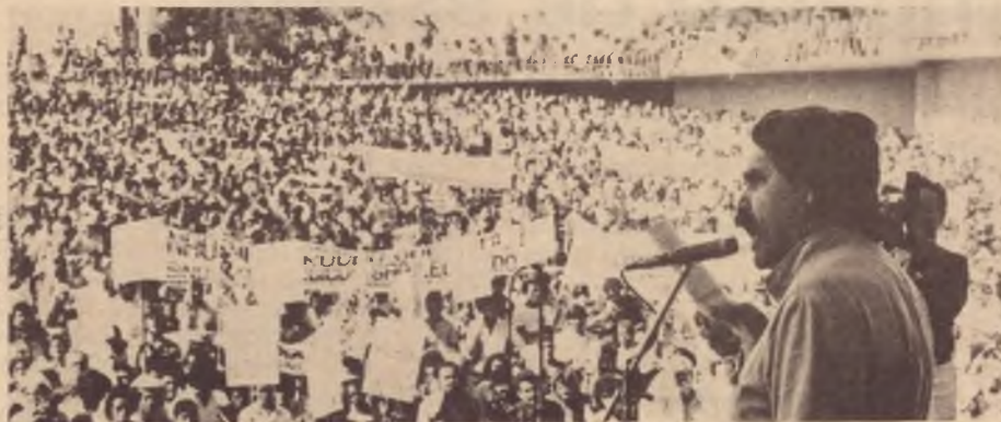
Assembleia dos Trabalhadores Gaúchos