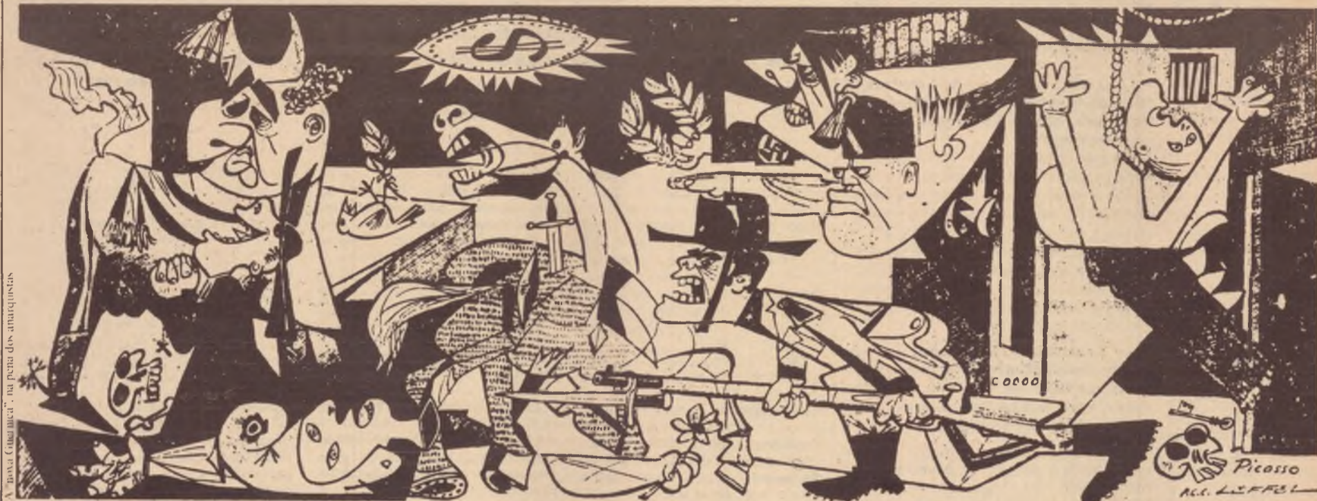
A "Brava Catalunya", na pena dos anarquistas