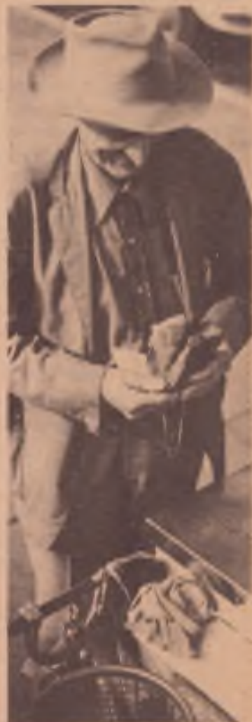
Com as demissões e os arrochos, o povo procura qualquer expediente para sobreviver (Foto: Vera Lúcia).