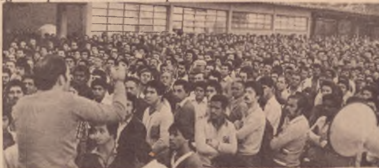
No dia 24 de janeiro os operários vão fazer assembléia na porta da Mercedes, como fizeram na porta da Ford em 82