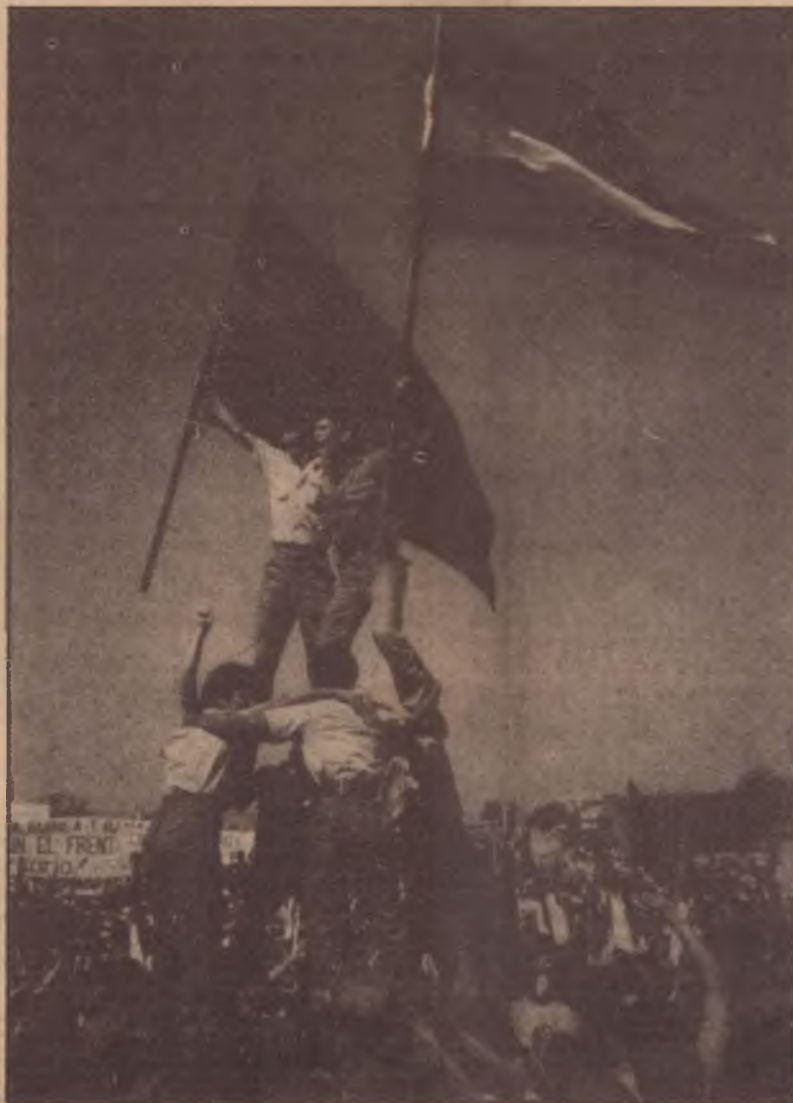
A unidade dos revolucionários: a chave da vitória

A FSLN tinha feito uma certa divisão de trabalho entre seus membros, devido às necessidades da luta, entre montanhas, cidades e trabalho de massa. "Os golpes da ditadura", explica Borges, "converteram essa divisão de trabalho em um relativo isolamento de seus diversos elementos entre si. E a percepção da realidade através de experiências distintas condicionadas por essa divisão de trabalho, sobre a base do isolamento conduziram, entre outros fatores, à formulação de três tendências no seio da FSLN."