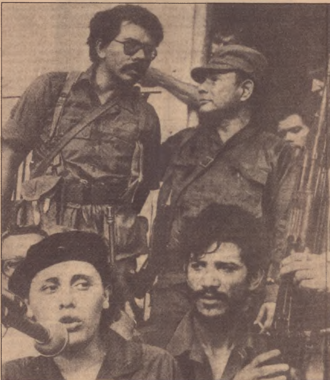
À frente: Dona Maria Tellez (comandante dois) e Omar Cabezas. Atrás: Daniel Ortega, Tomás Borge, Jaime Wheelock. Os sandinistas ocupam o centro de Manágua

Essa situação se mantém até o dia 19 de julho, quando é lançado o ataque final contra a Guarda Nacional. Sob a pressão ao ataque, a Guarda Nacional implode, rompendo com isso a espinha dorsal do estado burguês na Nicarágua. Somoza foge. Manágua passa para as mãos dos sandinistas. O poder de decisão passa efetivamente para a FSLN. Surgia assim o segundo Estado operário no continente americano.