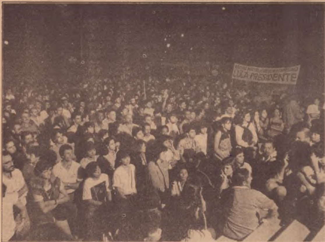
Lula nas ruas: sinais de crescimento da campanha

Nas feiras, nas filas de ônibus, nas ruas o povo está falando da situação do país com as veias inflamadas de indignação. Se queremos nos encontrar com ele é preciso que o nosso discurso político absorva e expresse todo o seu potencial transformador.