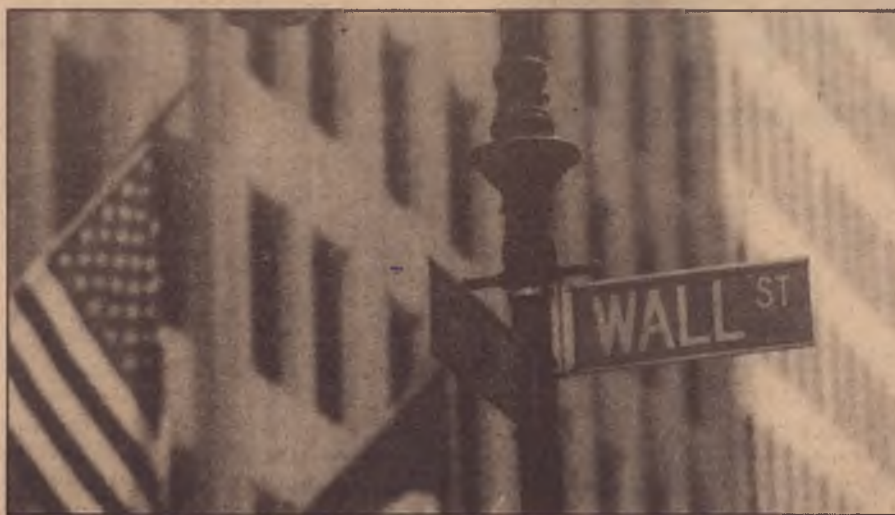
Há superabundância e não carência de capitais nos países capitalistas centrais

O segundo mecanismo é o da supressão brutal das subvenções aos preços dos produtos alimentícios e dos serviços vitais (saúde, educação, transportes coletivos, etc.) sob exigência direta do FMI. Isto também implica numa deterioração radical do nível de vida das massas. Segundo a UNICEF, nos trinta e sete países mais pobres, as despesas em educação e saúde por habitante foram reduzidas respectivamente em 50% e 25% nos últimos anos.