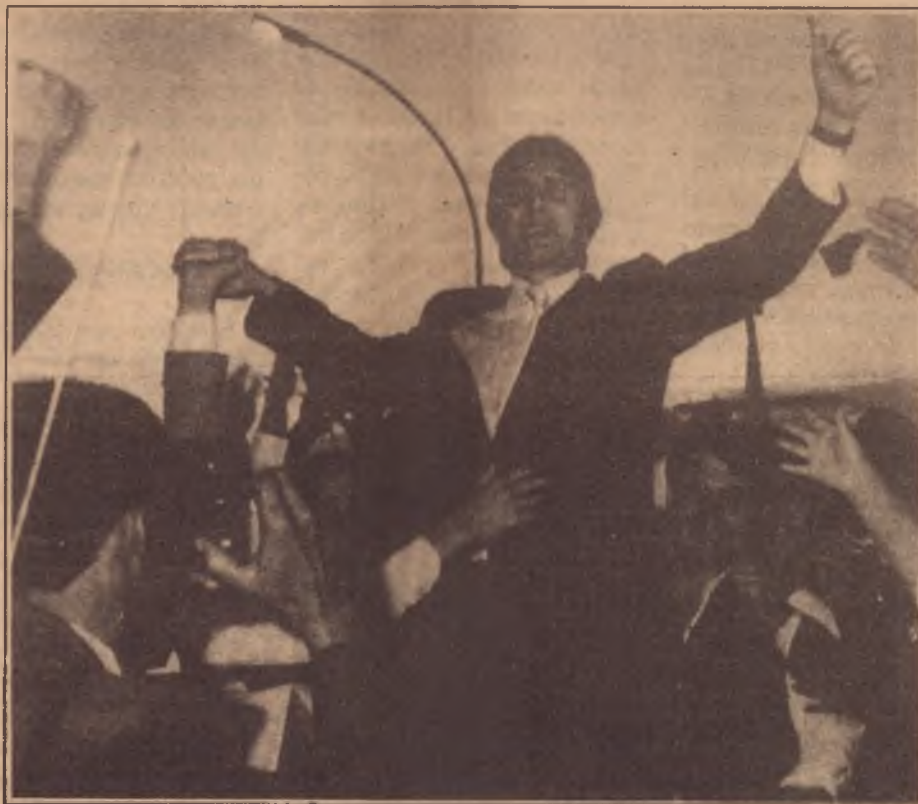
Collor: um aventureiro na vertigem de governar as massas

O quarto momento, pós-eleitoral, inclinava-se claramente para a esquerda: Lula e Brizola na dianteira das pesquisas eleitorais, o PT ascendendo como sigla partidária preferida, a greve geral dos dias 14 e 15 de março. Por todo o país, um sentimento contra os partidos da “Nova República”, alguns movimentos, espontâneos mas significativos, de revolta contra vencimentos