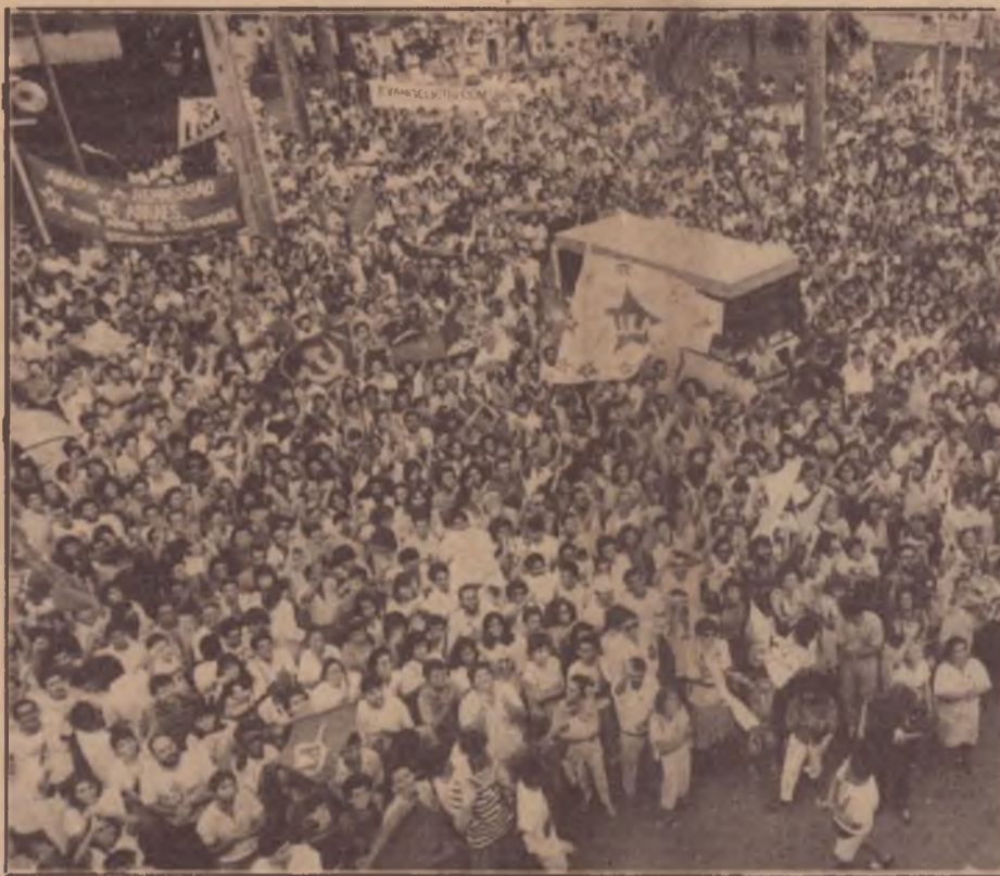
PT: o povo na aventura de se autogovernar

Esta passagem da frustração coletiva para a imagem de um “herói” só pode ocorrer através da redução da complexidade da luta de classes a um símbolo simples e manipulável. O “marajá” é