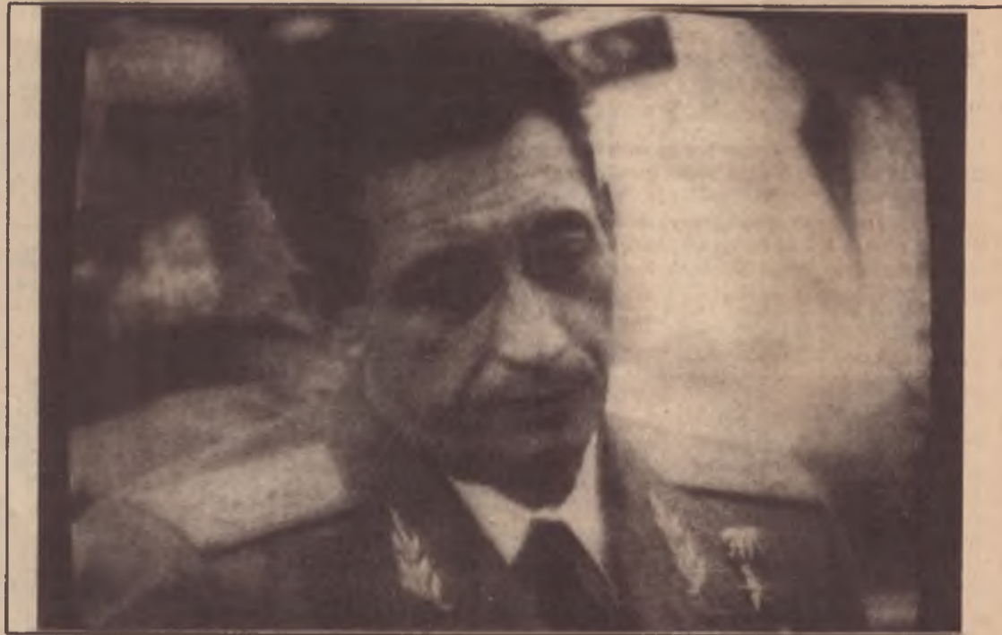
Ochoa na TV: “Não tenho mais razões para viver”

Segundo o Granma , a implicação de Ochoa no tráfico de droga só foi descoberta a 12 de junho. A 13 de julho ele foi executado. Contrariamente ao