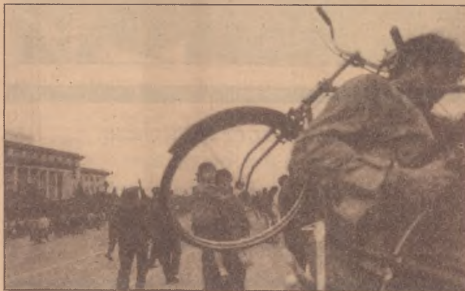
Socialismo e democracia: um enigma na história

* O mais forte posicionamento de apoio às autoridades chinesas parece ter vindo do parlamento da Alemanha Oriental: "Os deputados da Assembleia Popular sustentam que na atual conjuntura a solução política dos problemas internos perseguidos de forma determinada pela liderança do partido e do estado foi obstruída pelos sangrentos excessos de elementos anti-constitucionais. Como resultado disso, o governo foi forçado a enviar tropas para restaurar a ordem. Lamentavelmente, isto levou a que muitas pessoas fossem feridas e até a que algumas fossem mortas."