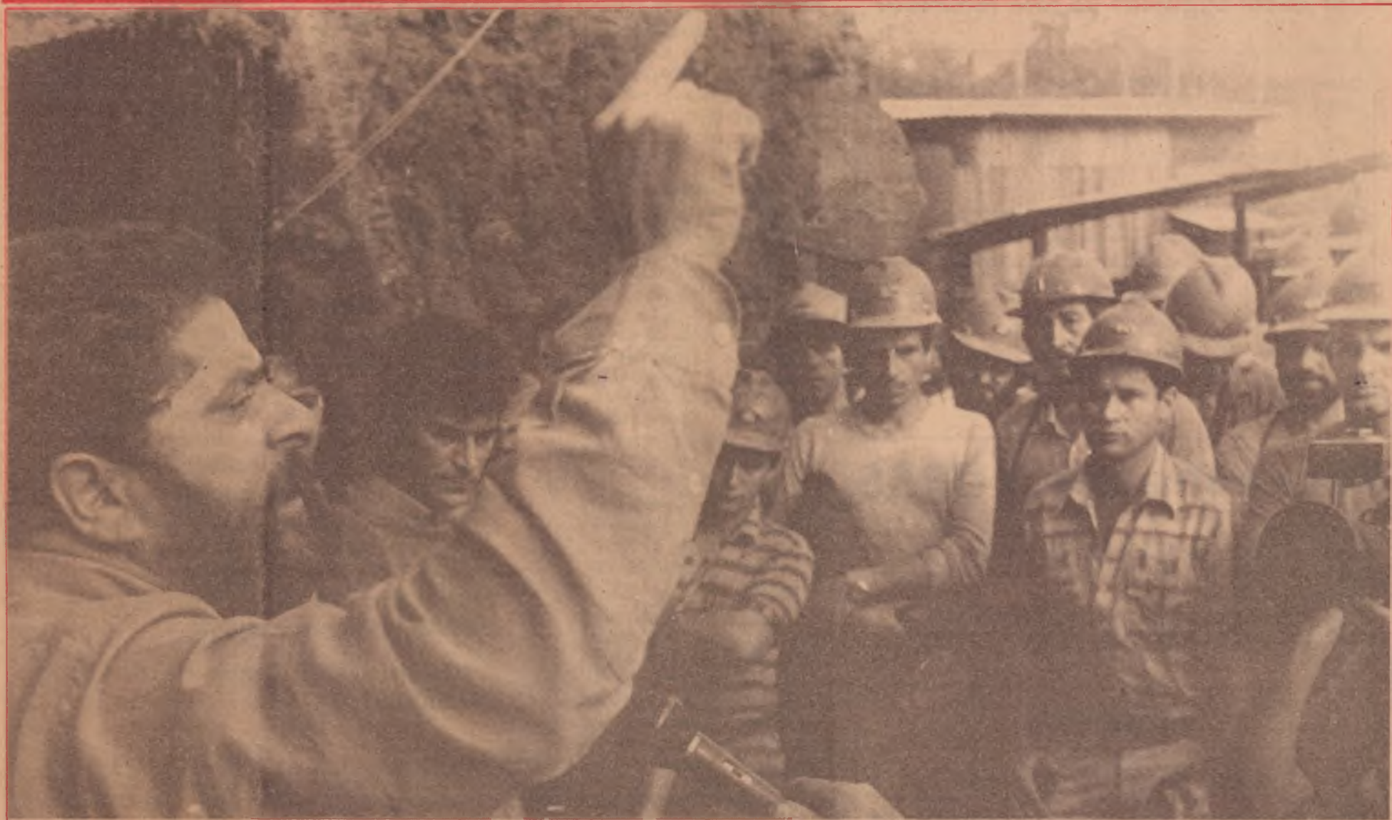
Lula fala aos mineiros da Criciúma, Santa Catarina

Compreender as raízes da ascensão de Collor e encontrar o veio do discurso democrático radical capaz de conquistar a consciência e o coração das amplas massas em revolta com a "Nova República". Págs. 2 a 5