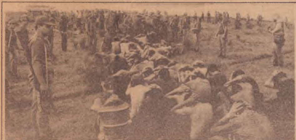
Cerco militar dos sem terra na Fazenda Santa Elmira

Dez anos do heróico movimento dos sem-terra