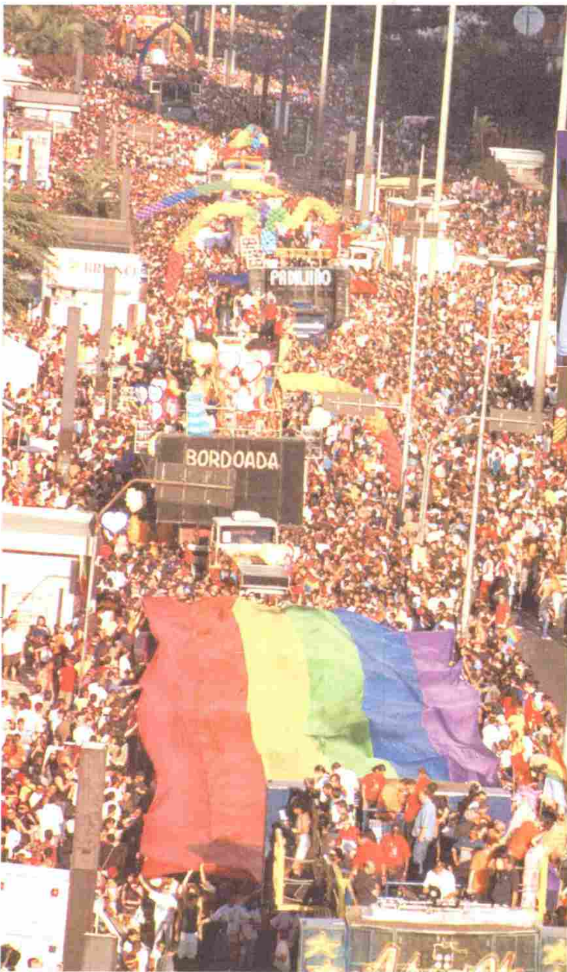
Manifestantes na Parada Gay, que contou com bloco formado por petistas (destaque)

De acordo com Ivan Valente (PT-SP), não está descartada a possibilidade da apresentação de emendas individuais ao projeto. “A apresentação de emendas é um direito individual dos parlamentares.”