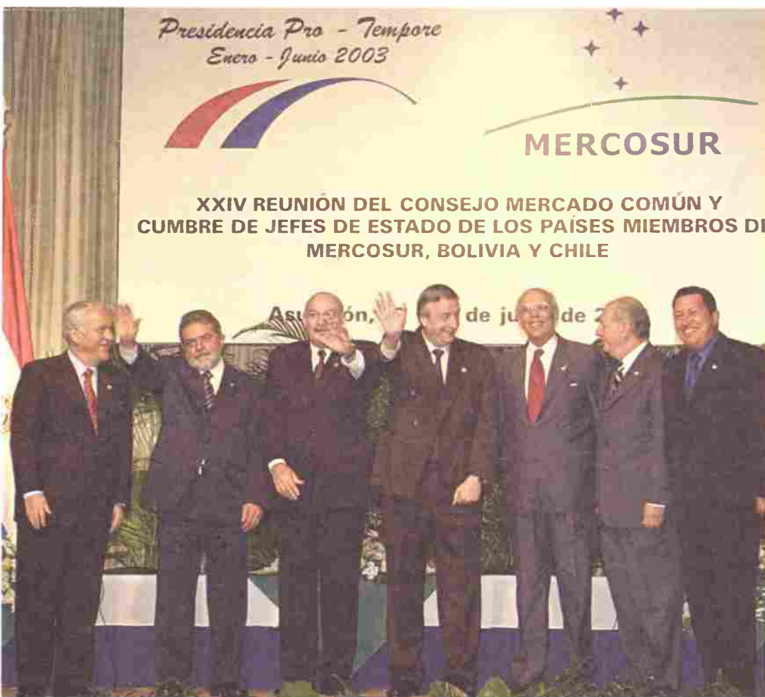
Presidentes do Mercosul, mais os da Bolívia, Chile e Venezuela, posam para foto oficial