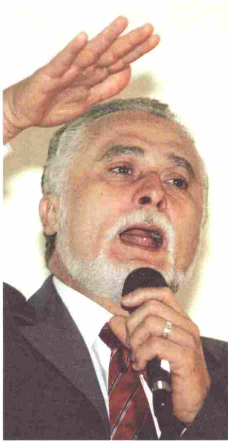
Genoíno em encontro com deputados estaduais do PT