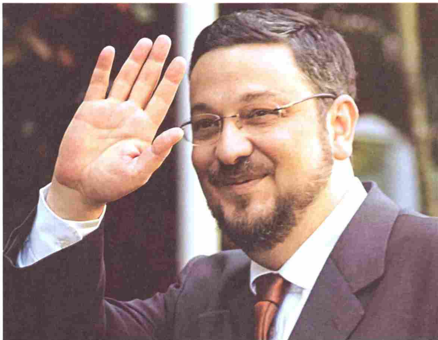
O ministro da Fazenda, Antônio Palocci, acena ao chegar para uma reunião no Ministério do Planejamento

PARA LULA, CORTE DE 0,5 PONTO, O PRIMEIRO EM 11 MESES, INDICA QUE O BRASIL ESTÁ PRONTO PARA CRESCER