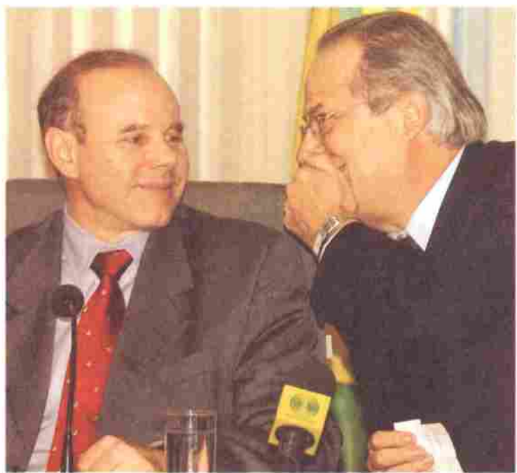
Mantega, do Planejamento, e Dirceu, da Casa Civil

Segundo ele, as políticas econômicas que foram adotadas foram necessárias para que o governo consiga agora cumprir as novas etapas de estímulo ao crescimento da economia. “Todos sabem que a queda dos juros é importante, mas não suficiente. Nenhum país do mundo cresceu fixado apenas nos juros”, complementou Palocci.