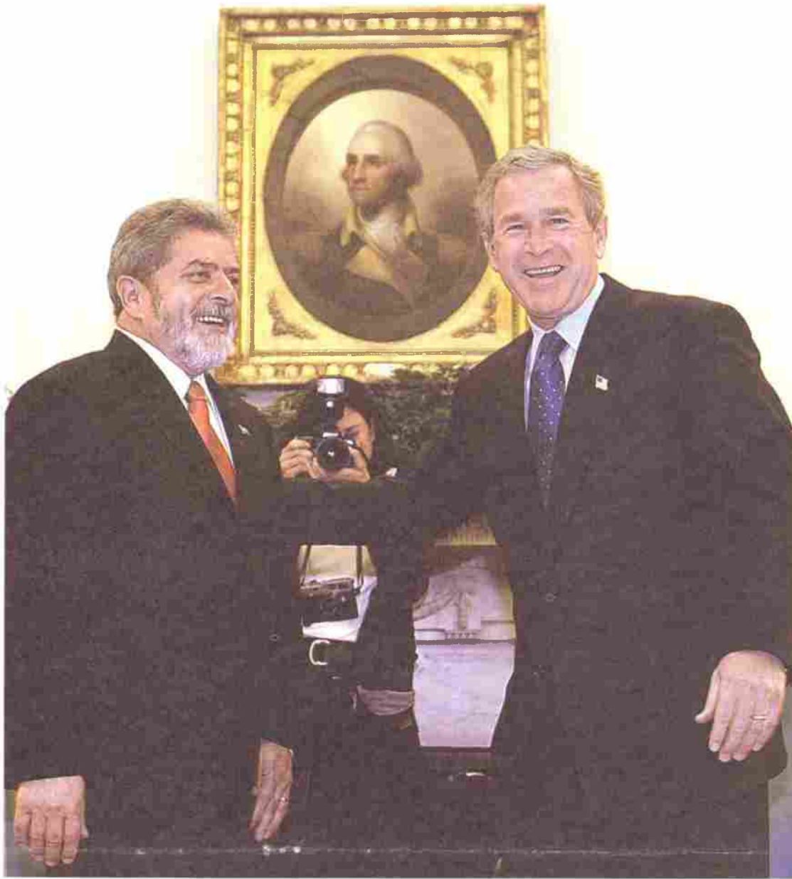
Lula é cumprimentado por Bush durante encontro dos presidentes na Casa Branca

O presidente lembrou os novos ares políticos na região, com sua eleição, a de Néstor Kirchner, na Argentina, e a de Nicanor Duarte Flores, no Paraguai. “Os resultados das urnas resultam em clara opção das sociedades em favor do Mercosul. Os eleitores aprovaram esta proposta.”