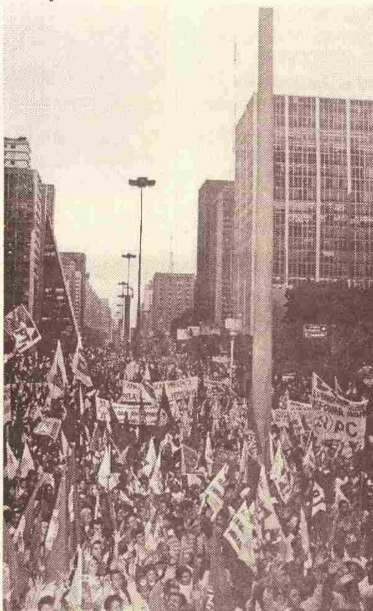
Mais de 15 mil pessoas lotam a avenida Paulista no dia 25

O ato Abra o Olho, Brasil, dia nacional de mobilização contra a política neoliberal do governo federal, realizado em 25 de julho, foi, segundo o presidente nacional do PT,