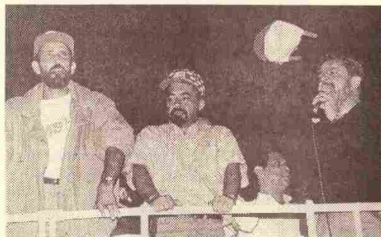
José Rainha e Lula representam união do campo e da cidade