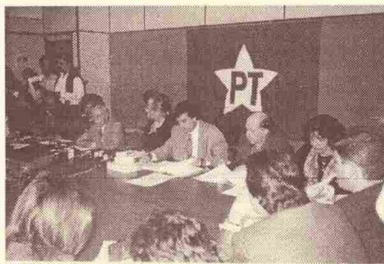
Conclusões e resoluções são divulgadas durante entrevista