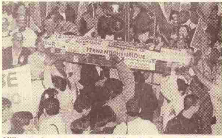
Militantes fazem o enterro simbólico de Fernando Henrique