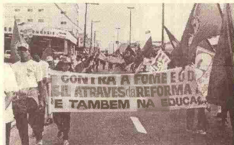
Caravanas do Interior se encontram com pessoal de Osasco

Lula terminou com um recado ao presidente da República. "Ele vai ter que deixar de ser prepotente e chamar o movimento popular para conversar. Vai ter que arranjar dinheiro para a reforma agrária, para construir casas populares e para uma política industrial que gere empregos. Se quiserem nos derrotar, vão ter que ir às ruas nos encerrar de frente", concluiu.