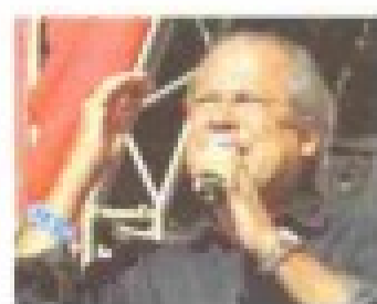
“Criamos emprego e melhoramos a renda. Este é um governo que precisa e merece o apoio dos trabalhadores, pelo que tem feito e pelo que fará.” (José Dirceu, ministro-chefe da Casa Civil)