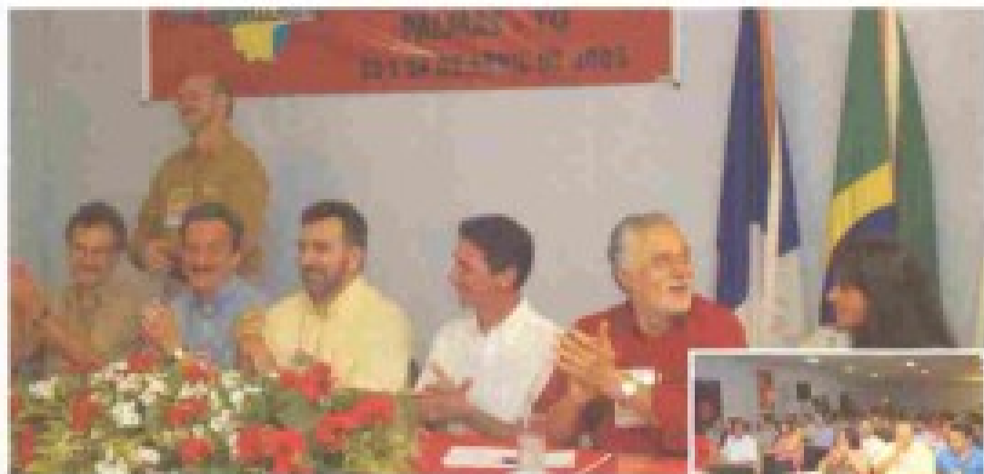
Políticas devem seguir a lógica local, conclui evento

6. Entre as principais resoluções definidas desde o I Fórum do PT da Amazônia e confirmadas nos demais fóruns e conferências realizadas — com destaque para o II Fórum do PT, em Manaus, no ano de 2003, e a III Conferência da Amazônia, em Porto Velho, no ano de 2004 — duas merecem destaque: I) a necessidade de uma visão de planejamento estratégico integrado para a Amazônia, com respeito às especificidades regionais; e II) o importante papel do ordenamento territorial para a implementação de um novo modelo