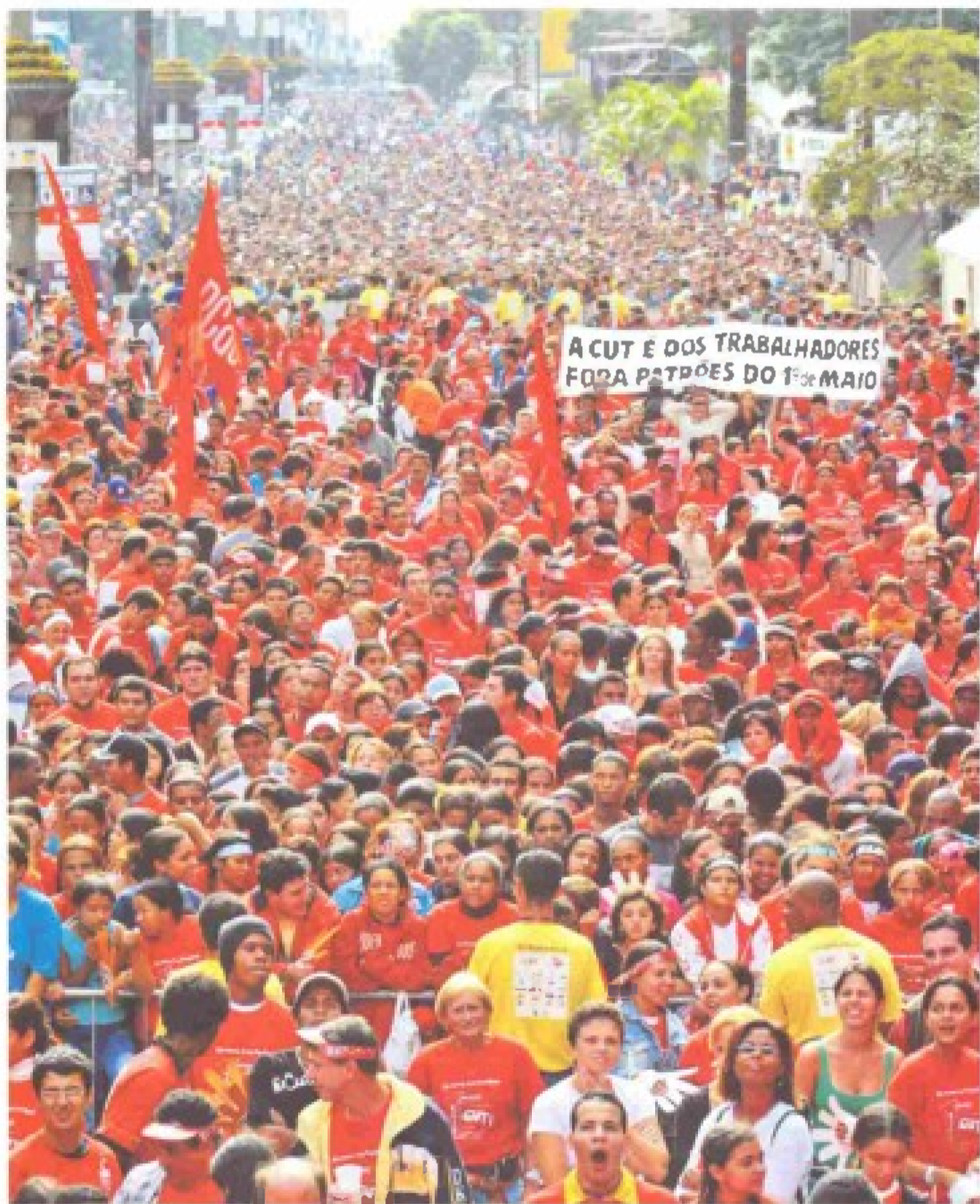
Manifestação na Paulista, promovida pela CUT, reuniu 1 milhão de trabalhadores e reiterou apoio ao governo Lula

O presidente nacional do PT, José Genoino, também comemorou as conquistas sociais do governo Lula sob perspectiva de que ainda há muito por fazer. No palco montado na Paulista, disse à multidão de trabalhadores: “A minha referência nesta data é a luta, é o protesto. Vamos continuar protestando, exigindo e lutando. A luta faz vitórias. A nossa luta deve continuar, estando nós no governo, fora do governo, nas greves, nas caminhadas e nas marchas para que o país seja capaz de crescer e gerar mais empregos”.