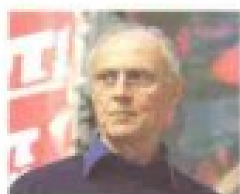
“Lula fez a economia crescer mais do que nos dez anos anteriores. Agora é preciso fazê-la crescer mais para garantir a ampliação das vagas de emprego.” (Eduardo Suplicy, senador PT-SP)