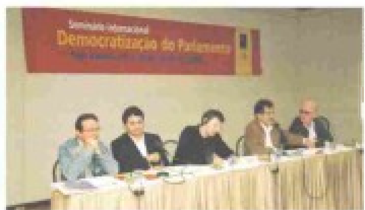
Evento discute crise da democracia só representativa