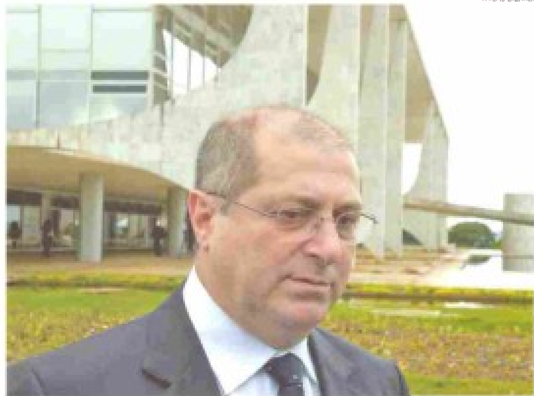
Bernardo: manter finanças em ordem é pressuposto para um projeto nacional eficiente

Como consequência do envelhecimento da força de trabalho federal, das aposentadorias daí decorrentes e da necessidade do fortalecimento de algumas atividades, 12 mil servidores ingressaram por concurso público, em 2004, para as áreas de fiscalização tributária (auditores fiscais e técnicos da receita federal), jurídica (advogados da União, procuradores da Fazenda Nacional e procuradores federais), pessoal do ciclo de gestão (analistas de orçamento, finanças e controle) e polícia (federal e rodoviária federal). O aumento líquido dos funcionários civis na administração direta foi de 640 desde 2002. ( Boletim Em Questão )