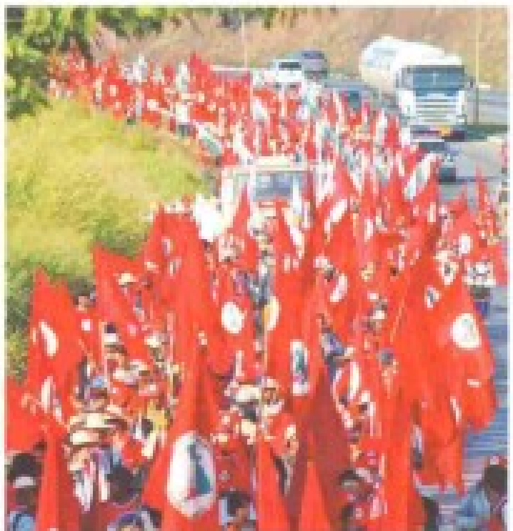
Marcha tem a maior adesão da história: 11 mil pessoas