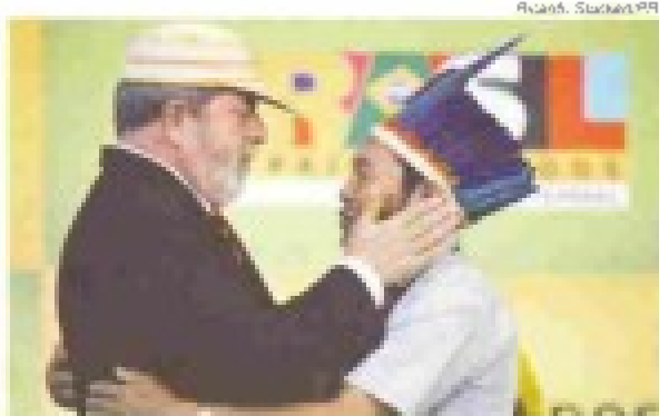
Lula recebe representante de terra indígena

O governo também anunciou cinco medidas para garantir o desenvolvimento da reserva e o fim dos conflitos. Entre as ações, estão o pagamento de R$ 1 milhão em indenização para 27 famílias não-indígenas que estão na reserva; o reforço da linha de crédito do Ministério do Desenvolvimento Agrário para projetos instalados no local; a garantia de que as 63 escolas terão energia elétrica; um novo plano de gestão do Parque Nacional do Monte Roraima, compartilhado com o povo Ingari-kó, e o início do levantamento de lotes vagos no Estado para assentar as famílias que receberão as indenizações.