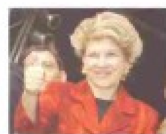
“O governo Lula pensa prioritariamente no trabalhador e executa políticas que já apresentaram resultados, como a criação de 2,5 milhões de empregos.” (Marta Suplicy, ex-prefeita de São Paulo)