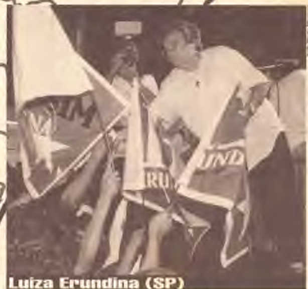
Luiza Erundina (SP)