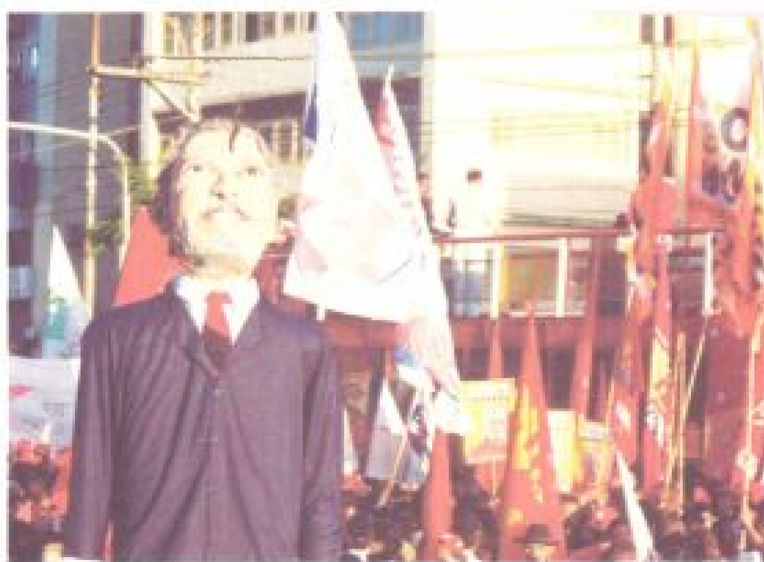
Boneco do candidato petista se destaca na manifestação realizada em Recife

Lula e Alencar visitaram também cidades de Minas Gerais, Rio Grande do Sul e Santa Catarina, nas quais discutiram propostas para alguns setores, como a cafeicultura e a agricultura familiar. Pág. 3