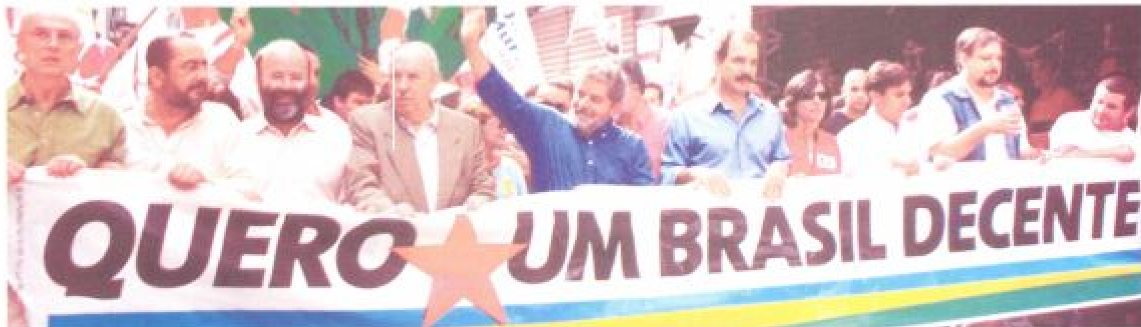
Lula, com o candidato a vice e companheiros e parlamentares do PT, participa de caminhada no centro de São Paulo, no início do período de propaganda da campanha