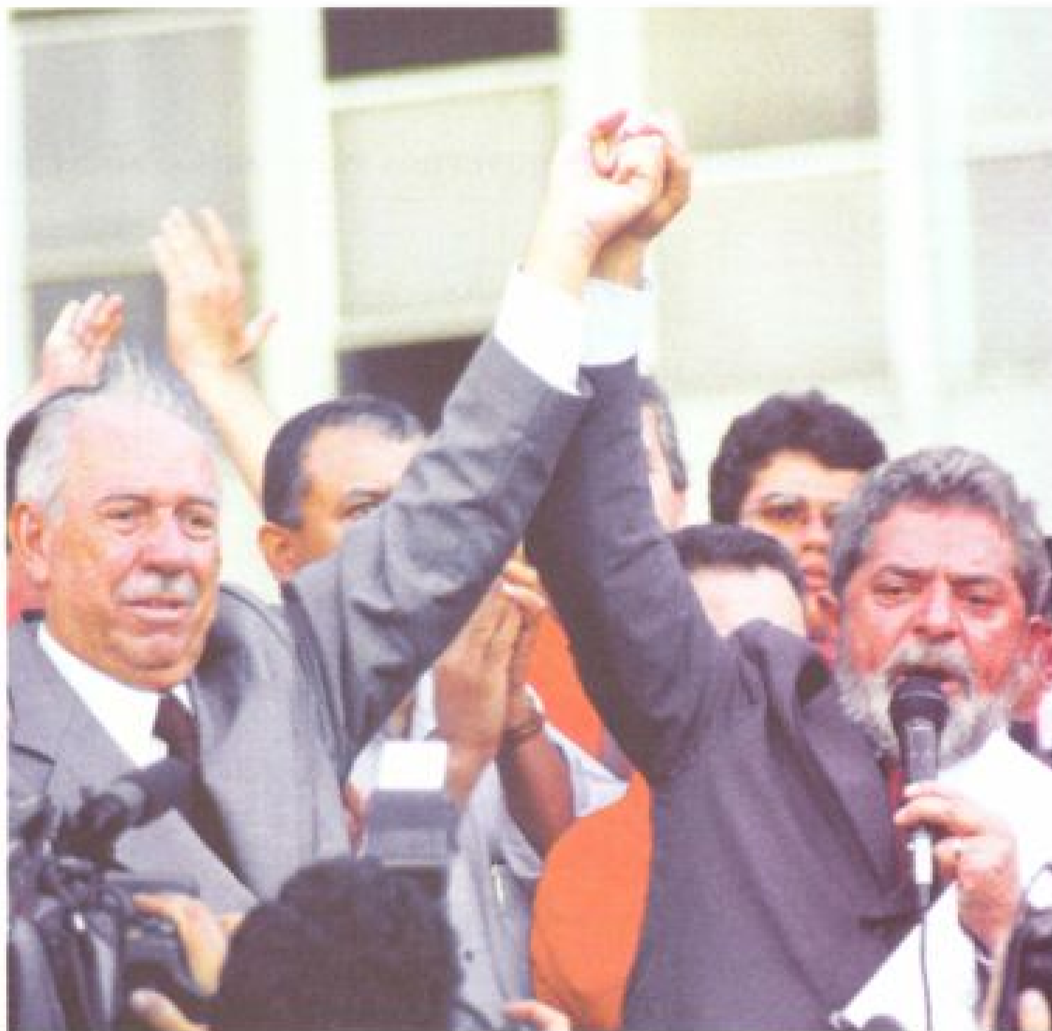
Lula e o seu candidato a vice, José Alencar, participam de ato em frente ao prédio da Sudene, em Recife

política econômica. "Uma vez na Presidência, quem vai orientar os destinos do Brasil será o governo — e o povo. Sem ingerência de organismos internacionais". Leia a íntegra. Pág. 6