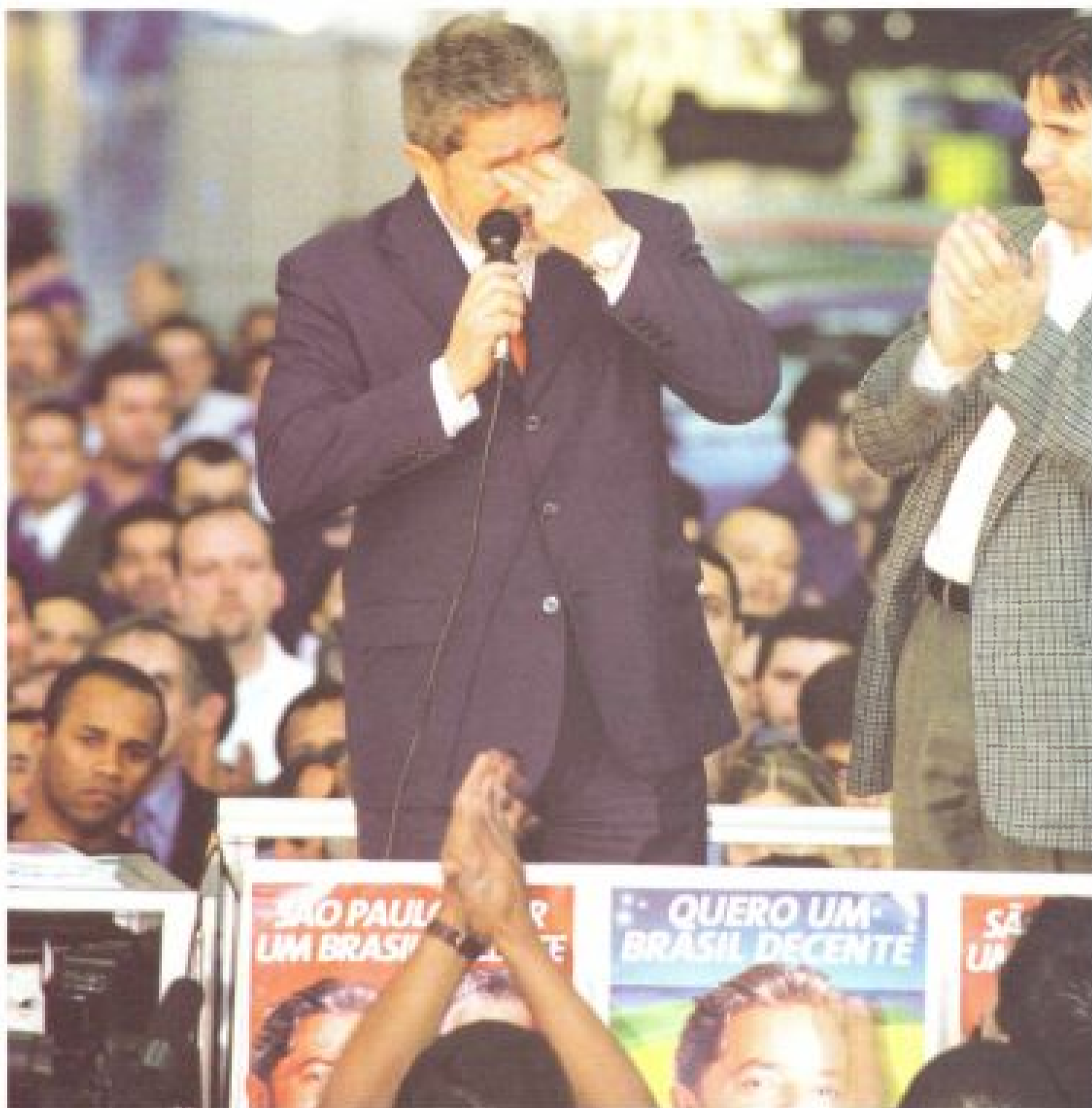
Lula se emociona durante visita à fábrica da Volkswagen em São Bernardo do Campo, no dia 19 de julho

No dia 25, Lula seguiu para Chapecó, no oeste catarinense. A cidade está na segunda gestão petista — o prefeito José Fritsch é o candidato ao governo de Santa Catarina — que, durante este período, implantou 52 agroindústrias familiares na área rural. Lá, Lula participou de um encontro com mais de 5.000 agricultores familiares da região Sul. No último fim-de-semana, os candidatos fizeram campanha em São Paulo. (CC/PL)