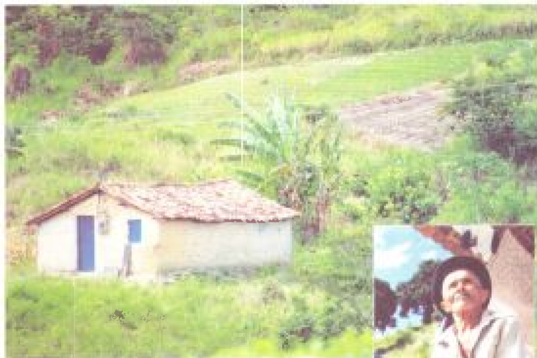
Casa e morador do Engenho da Galiléia (PE)

Passados 43 anos, os bisavós do sindicalismo rural brasileiro padecem ainda de deficiências de infra-estrutura idênticas às reclamadas por boa parte das famílias recém-assentadas pelo governo federal. "Somos quase 1.500 moradores. Aqui não tem telefone. As estradas