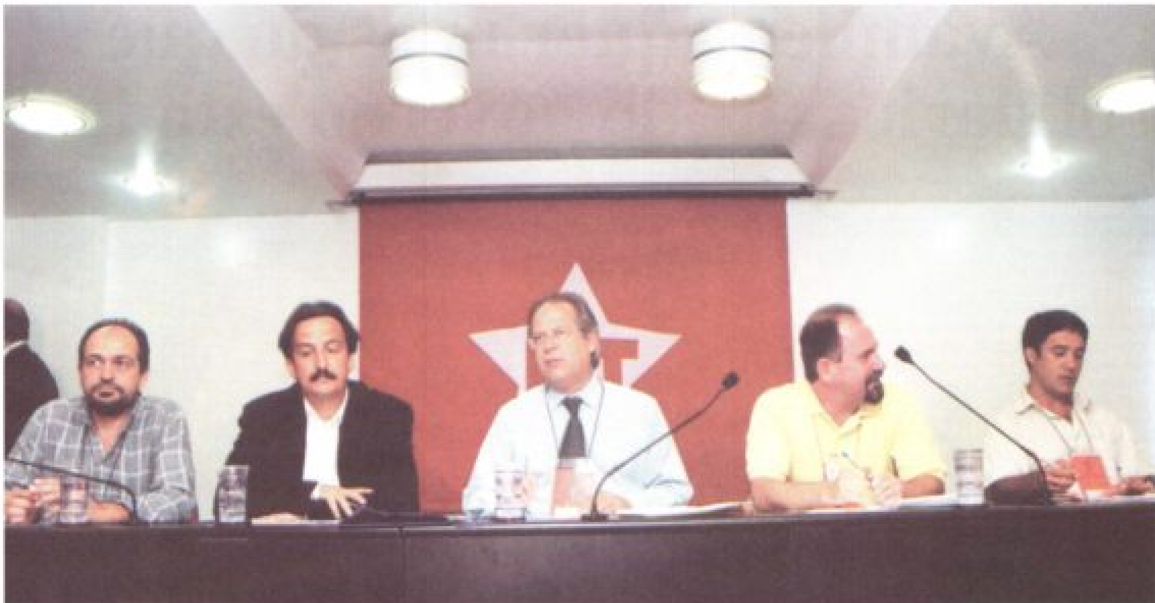
Dirigentes do PT discutem violência em reunião extraordinária da Executiva Nacional