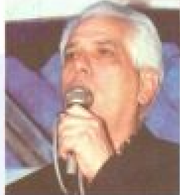
a presidência do Sindicato dos Metalúrgicos de Santo André e ainda a presidência da CUT regional e a tesouraria da CUT estadual. Foi vereador e presidente do PT de Santo André.