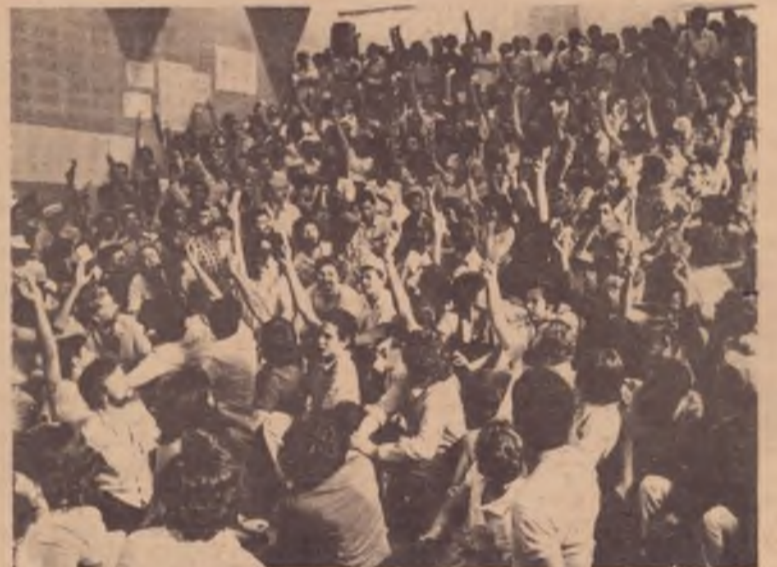
No plenário do Encontro Nacional do PT, a votação da Constituinte foi apertada.

O "Programa" do ex-PTB brizolista, depois de defender a anistia e a liberdade de organização de par-