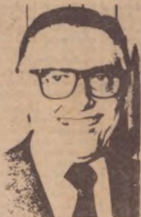
Mas consegui ficar assim. Graças ao OTIMISTOL DELFIM!

Texto: Sebastião Nunes. Artes: Renato Prata. Montagem: Eliazar Palleteima.