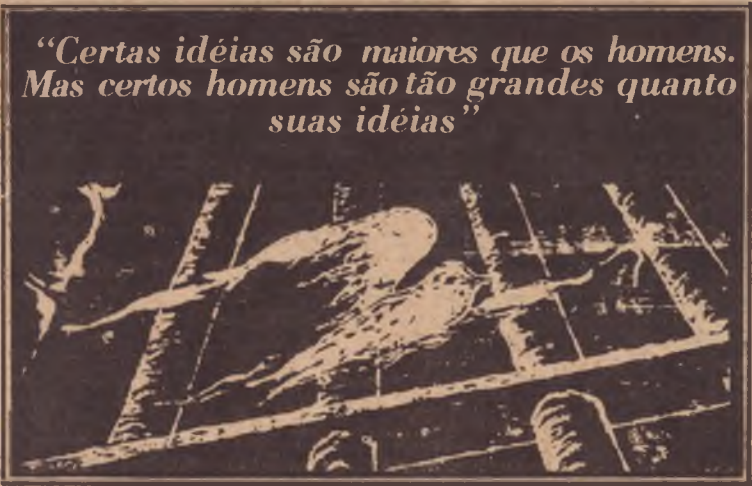
“Certas idéias são maiores que os homens. Mas certos homens são tão grandes quanto suas idéias”

Com a frase acima o Comitê Brasileiro pela Anistia, há tempos, lançou a luta pelo esclarecimento da situação dos mortos e desaparecidos, vítimas da repressão política no Brasil, e punição dos responsáveis por estes atos. Agora, o CBA/SP dando curso à campanha — neste momento em que a anistia restrita de Figueiredo para alguns vai ficando como a solução definitiva para o problema — apela aos órgãos de imprensa comprometidos com a luta pela anistia ampla, geral e irrestrita para, que a cada mês, publiquem a lista dos mortos e desaparecidos cujo final trágico ocorreu no referido mês.