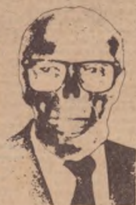
Quase fiquei assim.