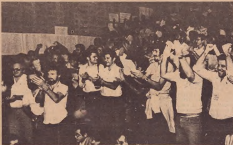
O plenário, do Encontro: todos queriam um PT de massas: mas de massa militante ou de massa de manobra?

Como no dito popular, a questão é mais embaixo. A questão que verdadeiramente esteve em polêmica diz respeito ao caráter de partido que se quer para o PT. Ou, noutra versão, estratégico ou tático? Um partido mesmo, ou uma