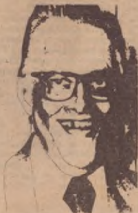
Eu era assim.