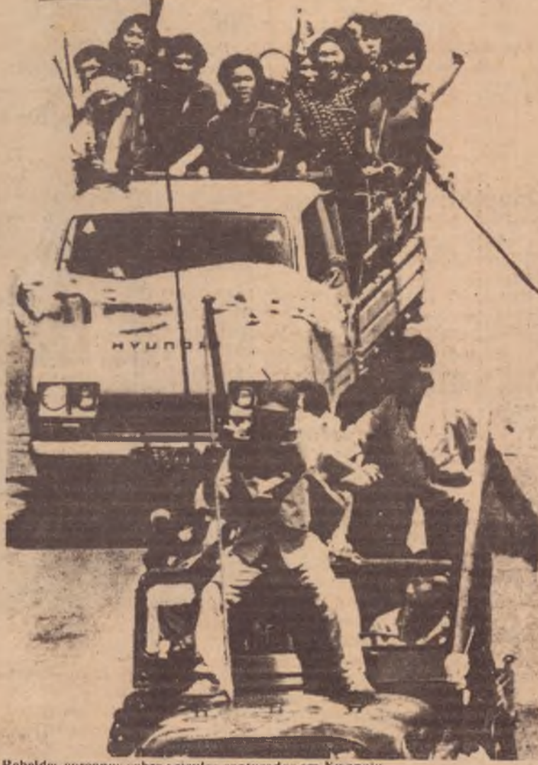
Rebeldes coreanos sobre veículos capturados em Kwangju