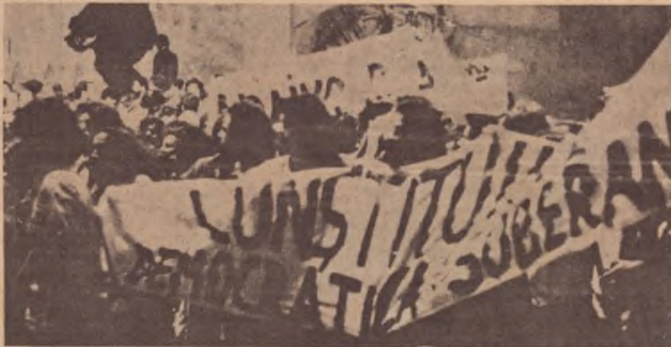
Com a bandeira, os trabalhadores poderão formar a dianteira da luta democrática

A crise da ditadura coloca na ordem do dia a questão da Constituinte. Esta é uma bandeira não só dos partidos políticos como de entidades do prestígio de uma OAB que recentemente em sua 7ª Conferência Nacional, em Manaus, rati-