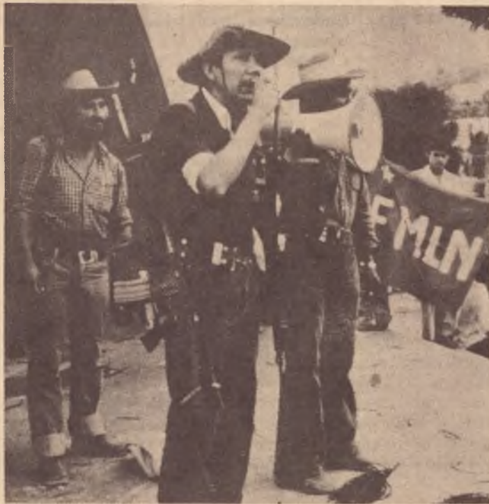
Comandante guerrilheiro realizando um comício em uma cidade ocupada

Numa das maiores batalhas deste ano em El Salvador, as forças guerrilheiras da FMLN infringiram uma grande derrota no batalhão Ramon Belloso. O "batalhão gringo", como é chamado por lá, foi treinado nos Estados Unidos. Em 30 de março, os combatentes da FMLN atacaram as forças do governo em San Isidro, a cem quilômetros ao norte da capital. Dezessete paramilitares foram mortos e os rebeldes ocuparam a cidade.