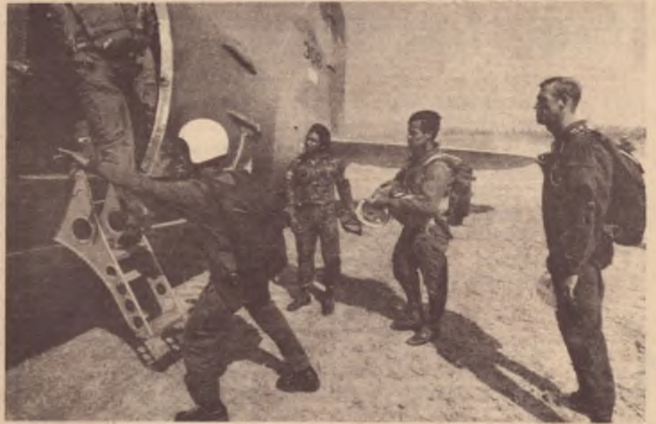
Instrução de paraquedistas hondurenhos por um instrutor norte-americano perto da fronteira com a Nicarágua.