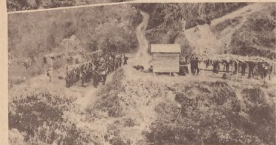
Um acampamento contra-revolucionário ao norte da Nicarágua: armamentos americanos

Pelo menos sete ataques contra a Nicarágua foram praticados pelas unidades militares hondurenhas entre os dias 20 e 27 de março. O mais sério de todos ocorreu quando uma unidade hondurenha cruzou a fronteira internacional e atacou uma patrulha sandinista, ferindo um soldado.