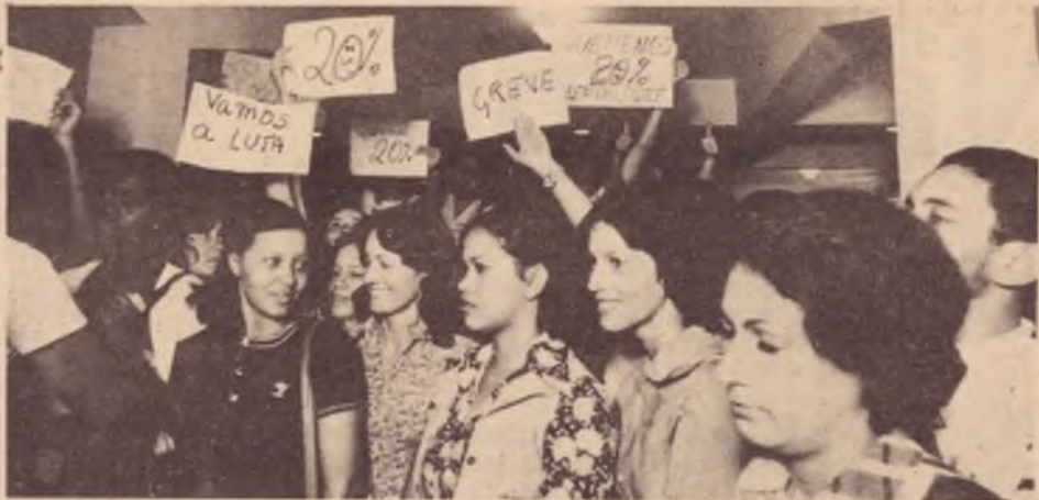
Fumageiras de Belo Horizonte, em greve. 1979

Um passeio pelas filas do SINF (Sistema Nacional de Emprego, do Ministério do Trabalho) mostra claramente isso. Muita gente é recusada em empregos por motivos inteiramente absurdos: "muito gorda para a função", "parece ter traços efeminados", "ultrapassa o limite de idade". (Folha de São Paulo, 15.01.82). Mulheres casadas não nem se fala, principalmente com filhos. Isso quando entram mulheres. E tem