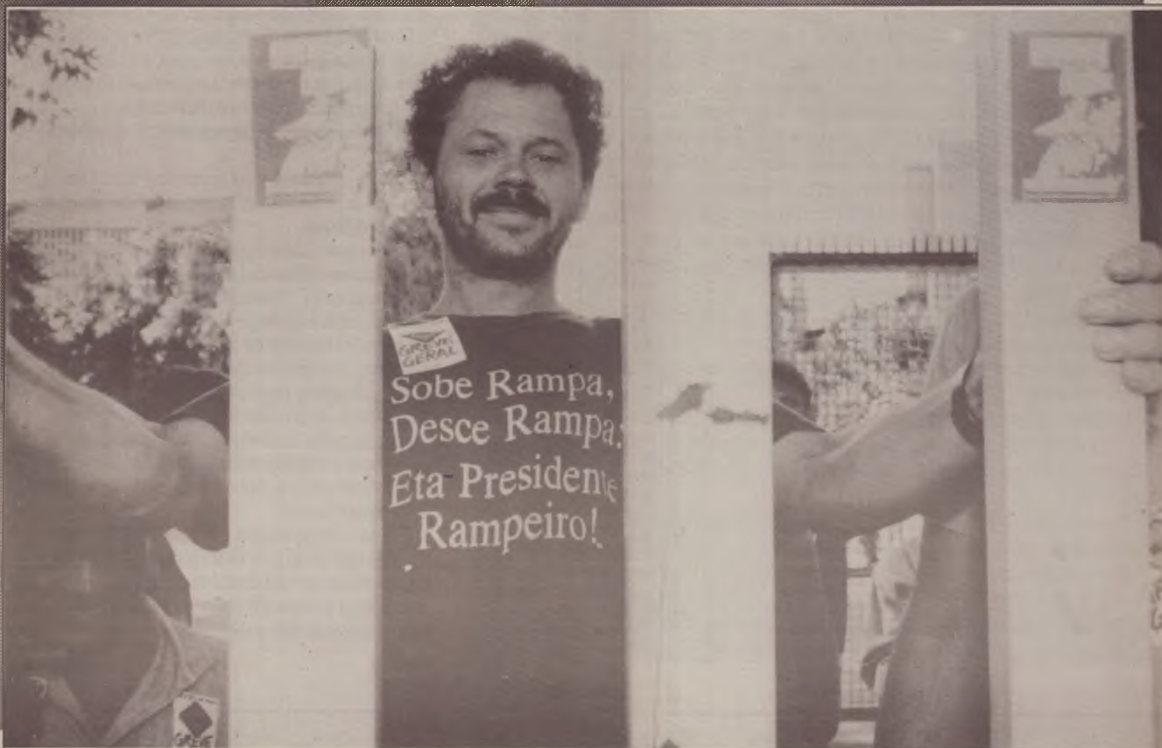
Operário da Brastemp de São Bernardo do Campo - 22/5/91

Neoliberalismo: Eduardo Galeano/René Dumont