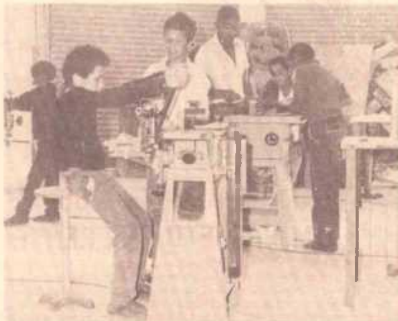
Oficina de Marcenaria para menores (Centro de Diadema)

Este projeto, desenvolvido em caráter experimental pela Prefeitura de