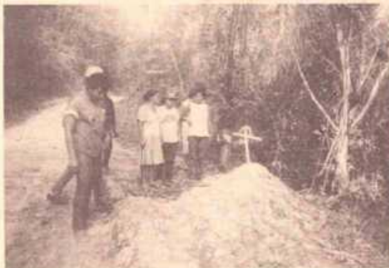
Capoema: a cova de um dos posseiros mortos

Um grupo de, aproximadamente, sessenta pessoas, representando várias entidades e partidos, havia chegado à região e, dividido em comissões, passou a atuar, ao longo de dois dias, em Buriticupu, Capoema e Arame com o objetivo de averiguar e, se possível, obter prova das anunciadas 27 mortes. Mais ou menos 1.500