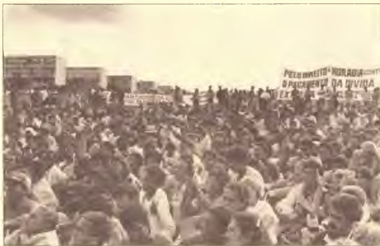
2ª Caravana da Moradia para Brasília — 1989

A nova Central tem papel estratégico no enfrentamento do modelo