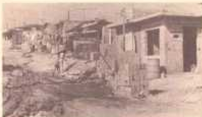
Favela urbanizada — Jardim Guaimim

so, dos 19 bilhões de cruzeiros do orçamento de 1984, apenas 10% pôde ser aplicado no atendimento das reivindicações da população, pois 40% foi destinado ao pagamento das dívidas assumidas na administração anterior e 50% no pagamento dos servidores municipais.