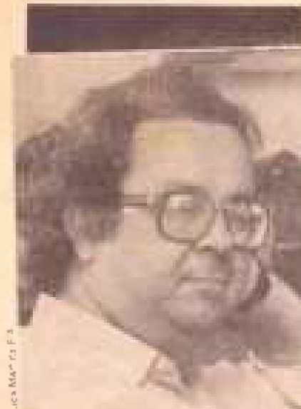
J. L. M. / 13 F. 3

Weffort: "A crise é real, mas o PT continua"