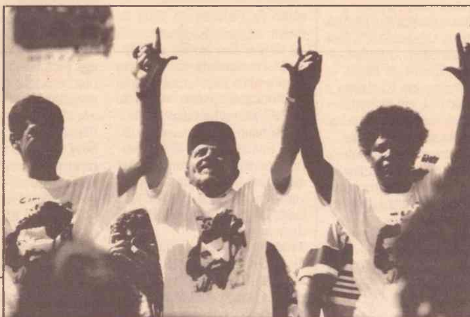
Caminhada Pela Vida no Rio de Janeiro